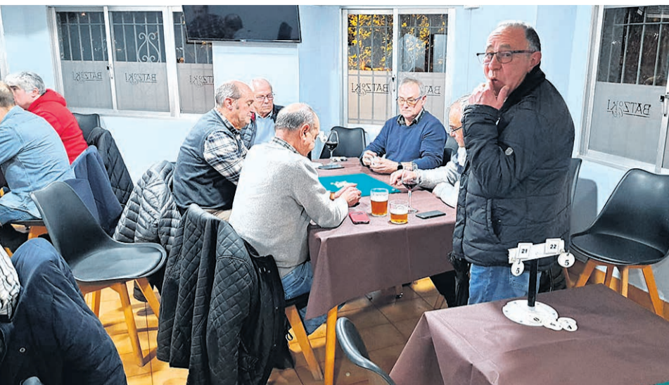
Las personas mayores son un sector del que se preocupa el Ayuntamiento.

A partir de esa información oficial, califican a los Consistorios como 'Excelentes', con 37 Ayuntamientos, entre ellos Basauri en ese puesto