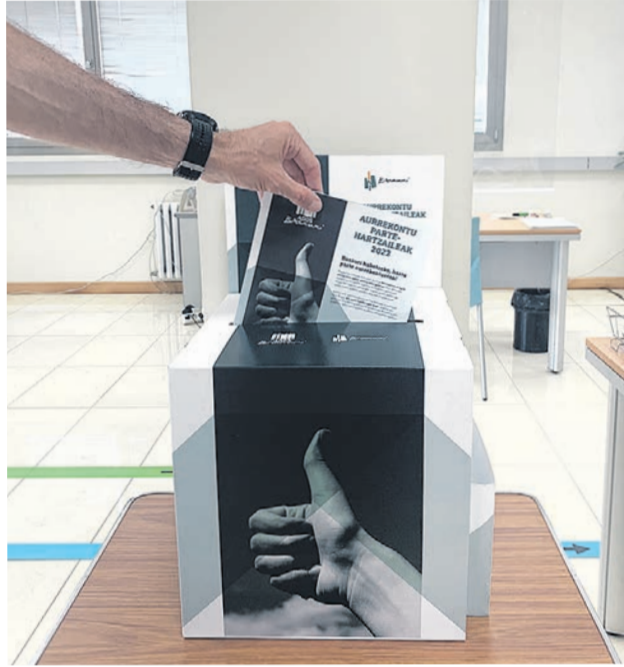
Urna en la que se pueden incluir las sugerencias.

El plazo de votación abre hasta el 28 de enero inclusive, y podrán hacerlo las personas mayores de 16 años empadronadas en Basauri. "Los ciudadanos recibirán en sus domicilios un cuestionario para rellenar y entregar en cualquiera de los puntos