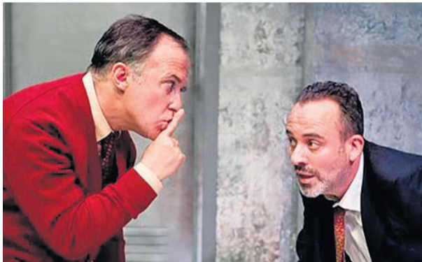
Los actores en "El traje".