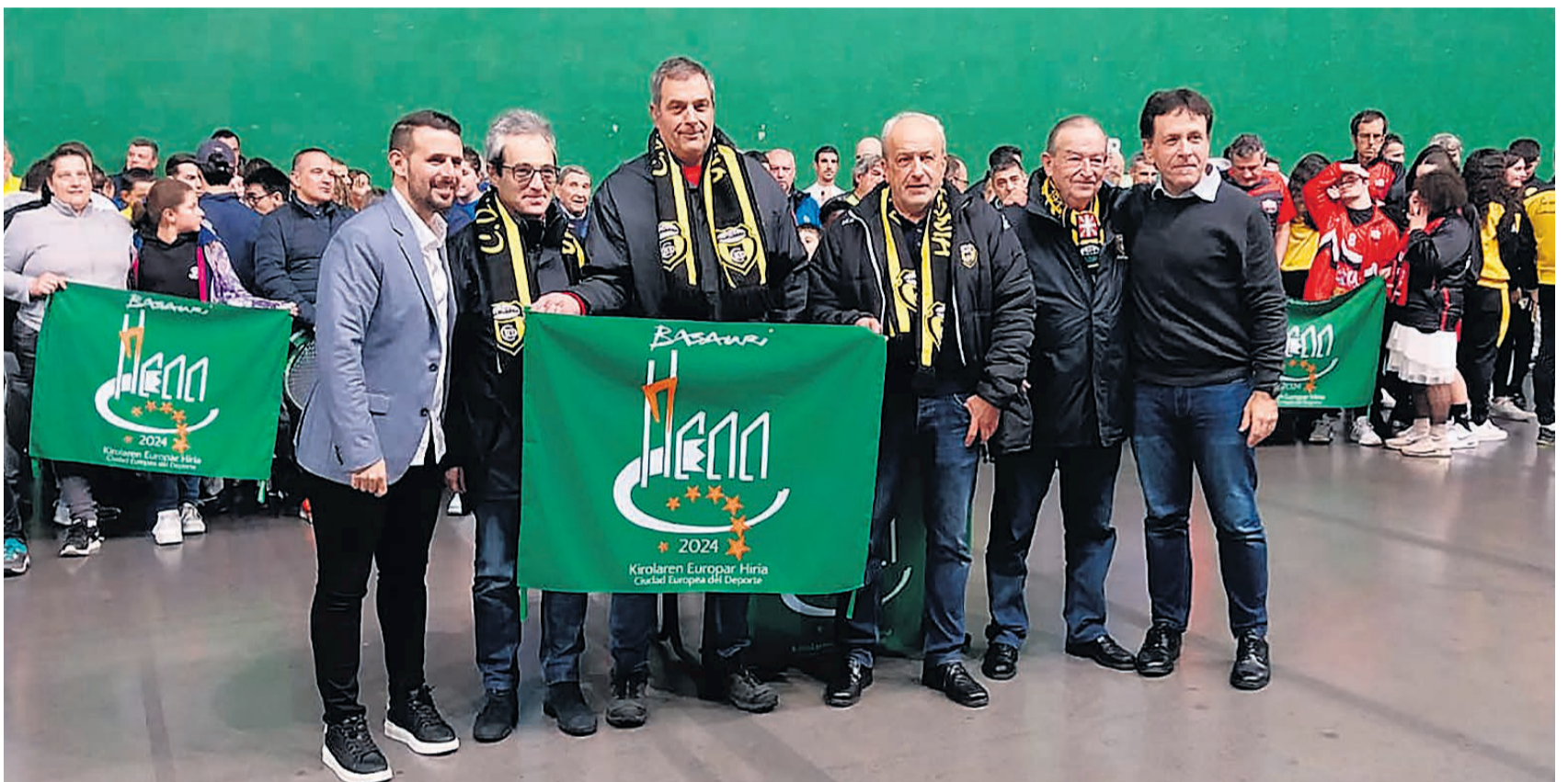
El Basconia, club decano y centenario del pueblo, recogió la bandera de manos del alcalde y del concejal de deportes.