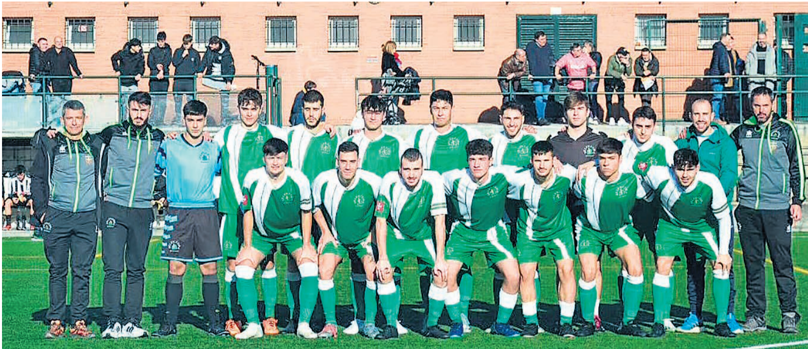
□ Plantilla y cuerpo técnico de la Selección de Basauri 23-24.