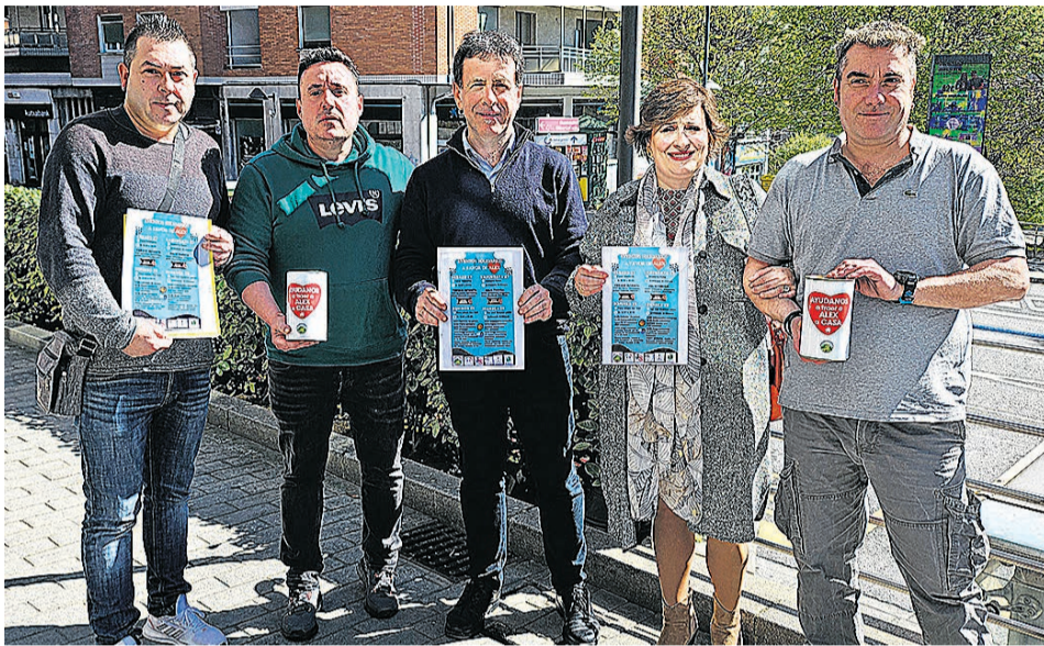
Los participantes en la presentación de la campaña.