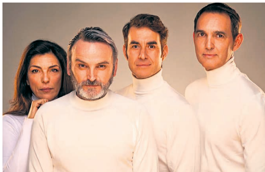
□ "Camino al zoo" podrá verse el 4 de mayo.

El día 5, a las 12:30 horas, la cita es para los niños con Teatro Paraíso. "Kutxartean" invita a disfrutar del juego, a superar dificultades en compañía e imaginar que, junto a otros se-