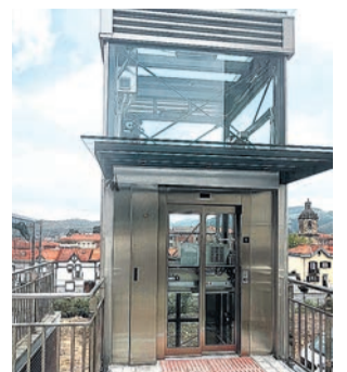
☐ El nuevo elevador.

Por otro lado, desde CIFP Andra Mari LHII, cada curso mandan a alumnos que realizan prácticas en empresas e instituciones colaboradoras en la formación de los profesionales, para que su incorporación al mercado laboral cuente con garantías de capacidad adecuada a la demanda. "Estas prácticas, incluso se realizan más allá de nuestras fronteras, en Portugal, Italia, Noruega, Suecia, Escocia", recalcan.