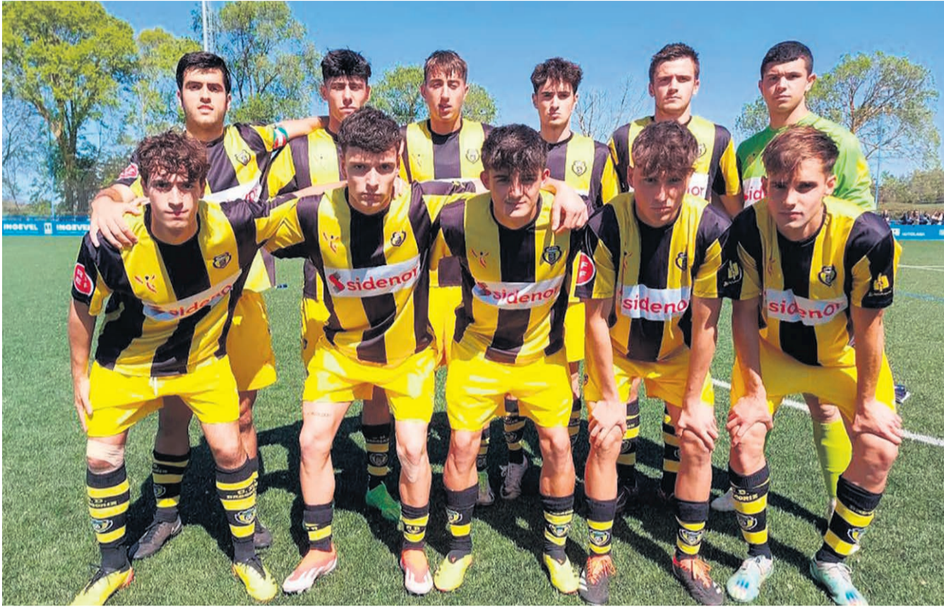
□ Alineación titular del C.D. Basconia en su partido contra el Alavés C.

No obstante, en las últimas jornadas ha conseguido echar el cerrojo en su portería, lo que le ha permitido volver a ocu-