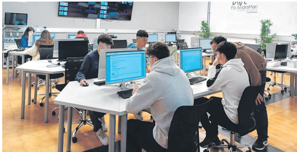
☐ Alumnos en una clase.