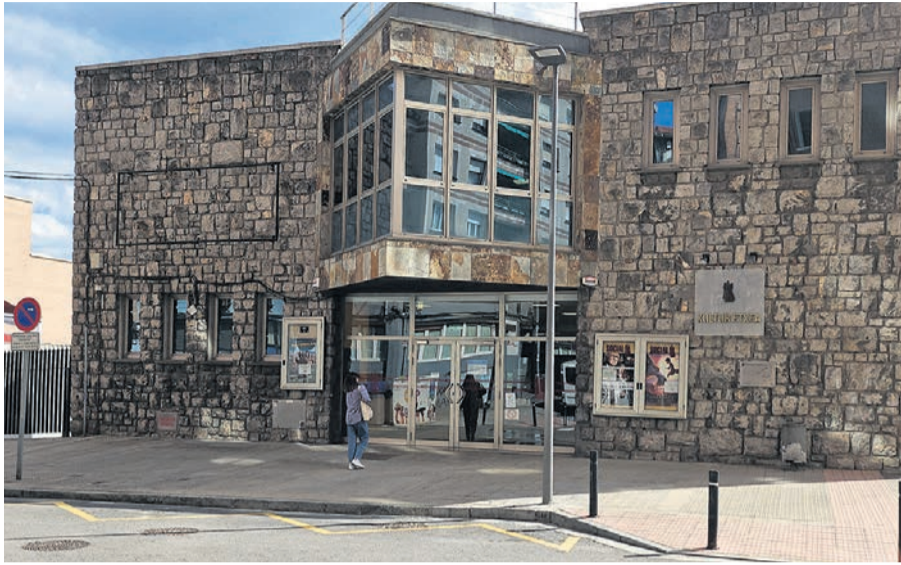
□ Casa de Cultura de Ibaigane.

El local, que no es propiedad municipal, "no se encuentra en las mejores condiciones de conservación y, aunque la Brigada Municipal ha ido haciendo pequeñas reparaciones, no se pueden realizar obras de mayor envergadura al no ser propiedad del Ayuntamiento. En consecuencia, se ha evidenciado que resulta imprescindible trasladar la ludoteca a otro espacio de la Kultur Etxea y, tras analizar la idoneidad de diferentes ubicaciones, se ha concluido que el único espacio que cumplía todos los requisitos es el que en la actualidad ocupa el Kzguneko Casa de Cultura de Ibaigane, cercano al local actual de Agirre Lehendakari", añadían.