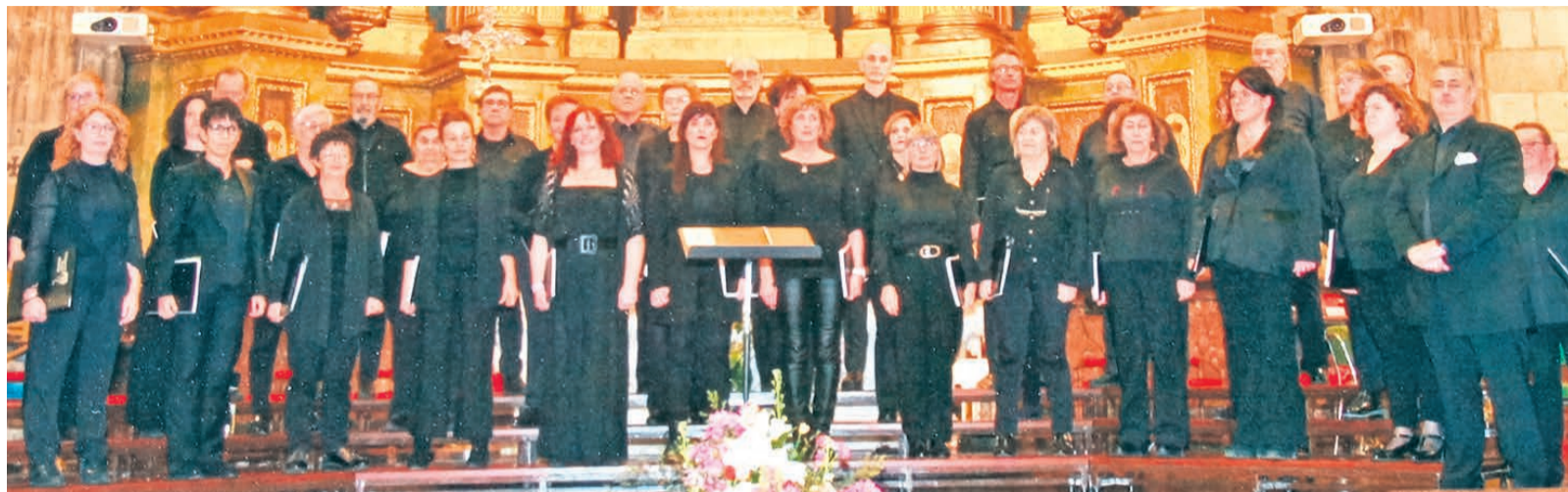
□ Miembros de Basauri Koralek Elkartea.

"Esperamos que cuente con la participación de todos los basauriarras que, como nosotros, aman la música, y animamos al resto a que descubran el mundo coral y disfruten de este arte universal que no entiende de idiomas ni fronteras", comentaban sus organizadores desde Basauri Koralek