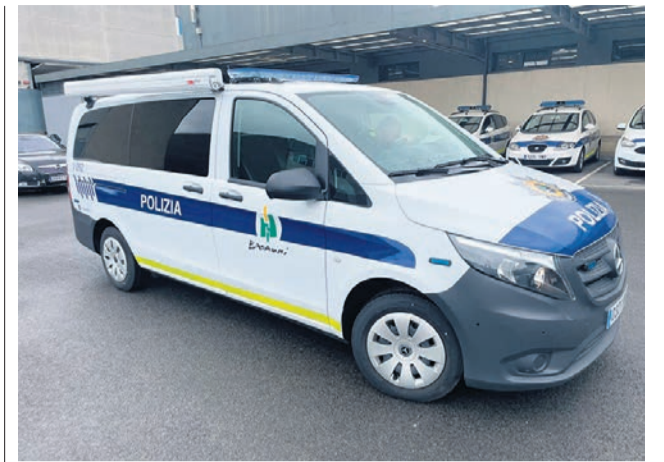
□ La oficina móvil.

reflexión sobre la revitalización del consejo de sostenibilidad; seguimiento de la campaña de recogida de residuos orgánicos; sistemas de autoconsumo energético; Plan de Movilidad Urbana Sostenible; bosque autóctono, y ruegos y preguntas.