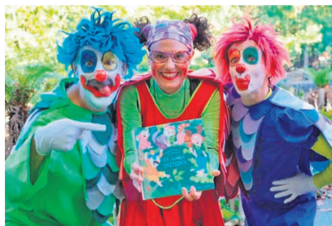
□ Porrotx y Marimotots visitarán Basauri.

Los establecimientos adheridos tendrán una pegatina identificativa. No obstante, se puede consultar cuáles son en https://bono.basauri.eus/es .