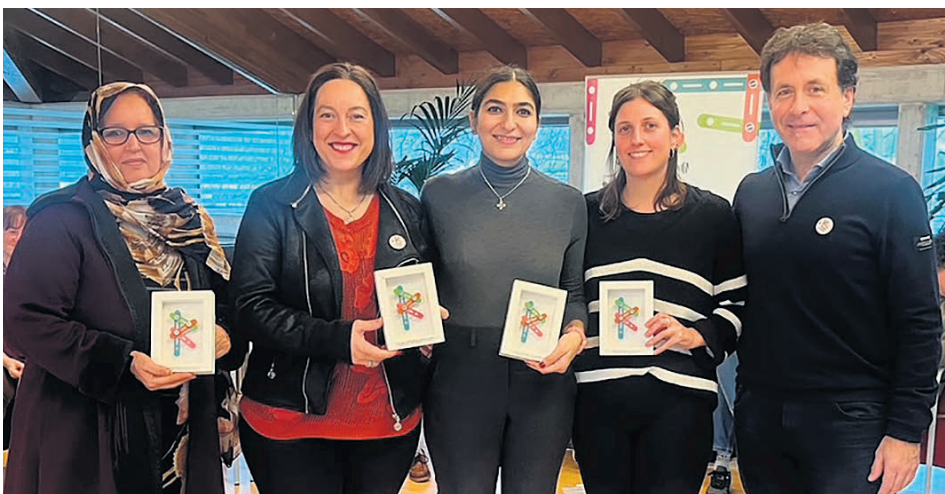
Un momento el día de la proyección.

Tirada de esta edición: 18.000 ejemplares (buzoneados en Basauri)