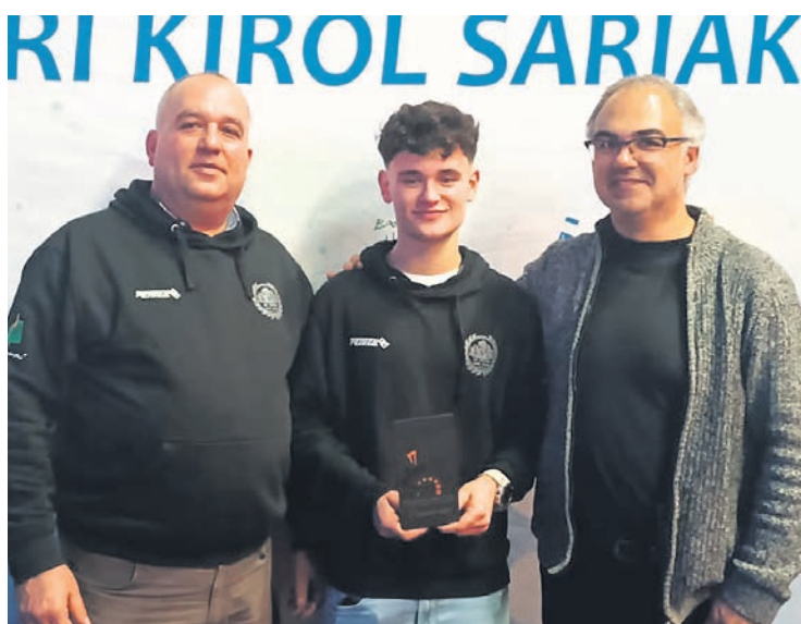
□ Miembros de SPR Basauri Xake Kluba en los Kirol Sariak.

Y han sido muy numerosos los campeonatos, principalmente, por Euskadi y Cantabria, en los que los integrantes del club han tomado parte a lo largo del año "disfrutando, aprendiendo, haciendo nuevas amistades y consiguiendo éxitos", listaban. El último, precisamente, el 22 de diciembre en el torneo de Abadiño, cuando copaba los primeros puestos en las distintas categorías. "Estamos seguros que este 2025 vendrá cargado de diversión y aprendizaje", finalizaban.