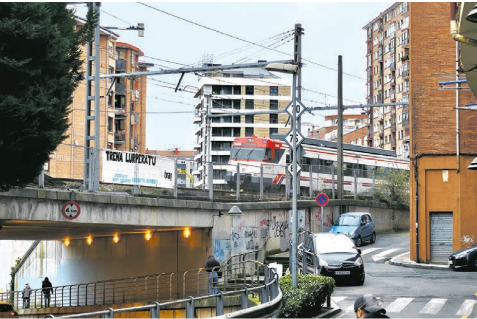
El paso del tren genera ruidos en Basauri.