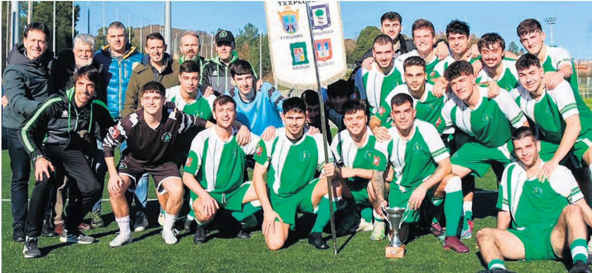
La Selección de Basauri tras ganar el Interpueblos 2024.

I. SÁNCHEZ Ohitura onak ez direla galdu behar esan ohi da, horregatik, beste behin ere, joan den abenduaren 28an, Hego Uribe Herriarteko Futbol Txapelketaren edizio berri bat egin zen Arrigorriagan. Basauri, Galdakao, Arrigorriaga eta Etxebarriko selekzioek herri arteko txapelketa jokatu zuten, eta eskualdeko futbolzaleen gozagarri izan ziren. Oraingoan, Basauriko selekzioa izan zen txapelketa berri irabaztea lortu zuena, hainbat urteren ondoren, finalean galdakoztarrak 1-0 garaitu ondoren. Dicen que no hay que perder las buenas tradiciones, por ello, el 28 de diciembre tuvo lugar en Arrigorriaga la edición del Torneo Hego Uribe Interpueblos de Fútbol. Las selecciones de Arrigorriaga, Basauri, Galdakao y Etxebarri disputaron el campeonato en el que volvieron a deleitar a los aficionados al fútbol de la comarca. En esta ocasión, fue la Selección de Basauri quien lograba volver a hacerse con el campeonato, después de varios años, tras vencer a los galdakoztarras en la final por 1-0. En vista de que las últimas dos edi-