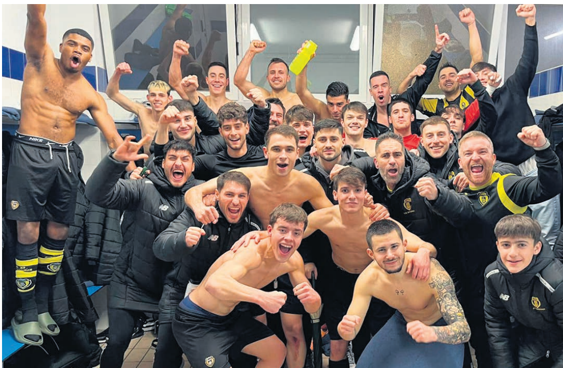
El equipo del Basconia B celebra la victoria ante el Otxarkoaga en el vestuario.

FÚTBOL. Después de haber estado buscándolo sin cesar los últimos años, este sí parece el del ascenso. Y es que tras 7 victorias consecutivas, el Basconia B se postula como gran favorito para ascender a la máxima categoría vizcaína, es decir, División de Honor. La victoria cosechada el pasado 25 de enero contra un rival directo, el Otxarkoaga, hace que los gualdinegros obtengan una ventaja