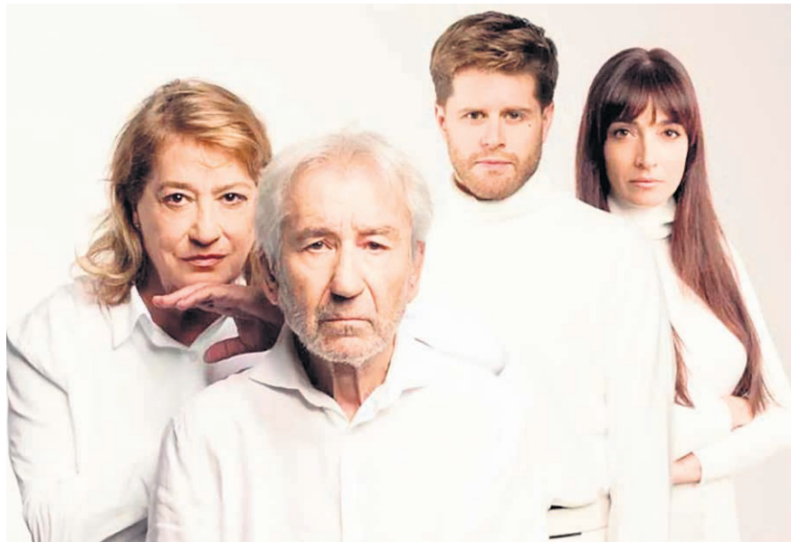
Actores de 'La colección'.

También regresa la ópera con 'Il Trovatore' de Verdi, de la mano de Opera 2001. Será el 8 de febrero a las 20:00 horas. Desnuda los sentimientos más extremos del ser humano, mueve entre contrastes, amor y odio, violencia y calma, venganza y ternura, celeridad y suspensión o vulgaridad y refinamiento. Se puede decir que es la primera obra de Verdi con un solo color predominante y