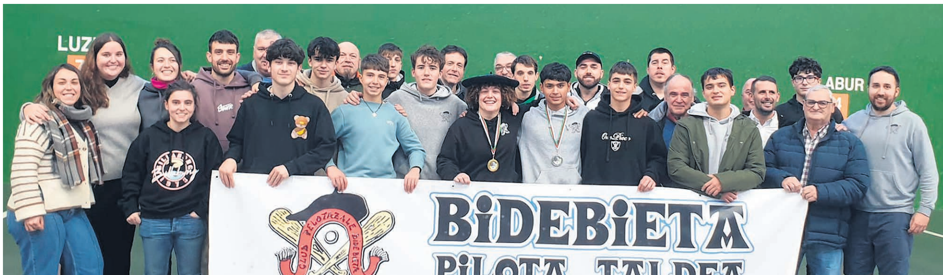
Los pelotaris locales junto a directivos, familiares, autoridades y prensa local.