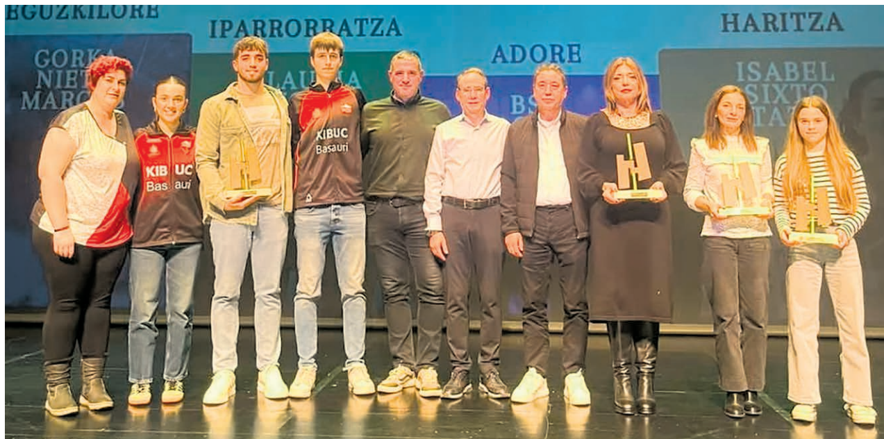
□ Premiadados en la gala de deportes.

Para finalizar, la gala reconoció a todos los clubes del municipio con una placa por sus respectivas trayectorias deportivas.