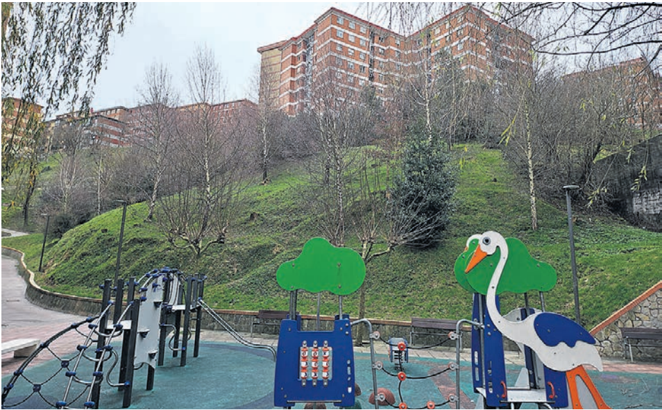
El objetivo es mejorar la accesibilidad entre el Kalero y Basozelai.

Los responsables municipales informarán puntualmente a los vecinos sobre los avances del estudio antes de darlo por finalizado, “manteniendo así el compromiso de una escucha activa con los residentes en los barrios objeto