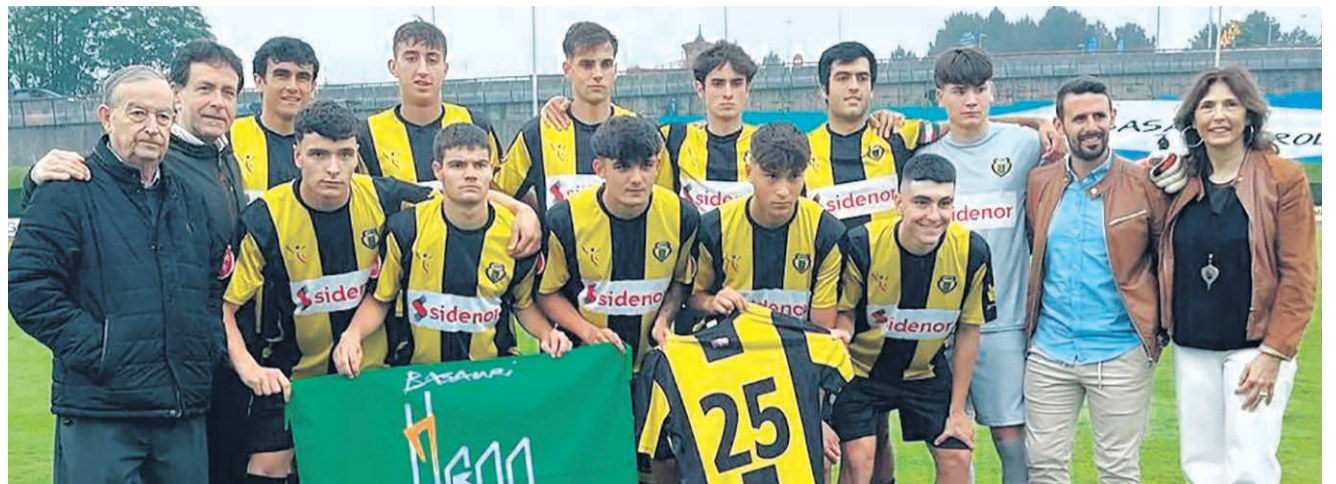
□ Alineación del CD Basconia para enfrentarse al Portugalete.

Ligako txapelketan zure aurkariaren aurretik geratu izanak edo etxeko moduan jokatzek ez dizute garaipena edo pasea ziurtatzen, eta, hain zuzen ere, CD Basconia lehener pertsona bizi ahal izan zuen. La Florida galdu eta gero, joan den maiatzaren 26an talde basauritarrek playoffetako itzuliri buelta emateko gogoz ekin zion. Hala ere, Portugaletek garaipena lortu zuen Artunduagan 0-3ko emaitzarekin.