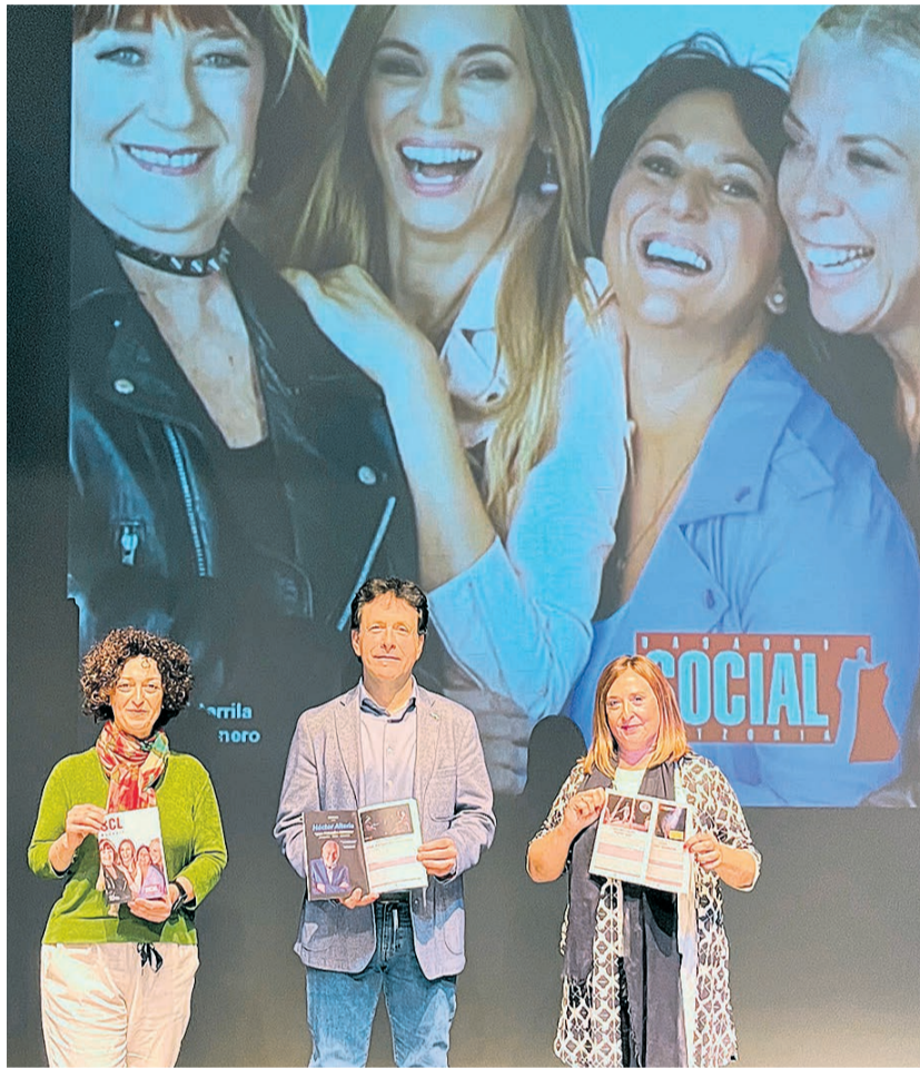
Presentación del programa del Social hasta enero.

El 14 de diciembre, “Las que gritan” firma elenco de lujo formado por Beatriz Carbajal, Norma Ruiz, Pepa Rus y Eva Isanta, con la historia de tres hermanas y una madre desaparecida que quiere ser feliz. Y el 10 de enero Carlos Hipólito protagoniza “Burro”, acompañado en el escenario por tres músicos que ayudan a esta mezcla de