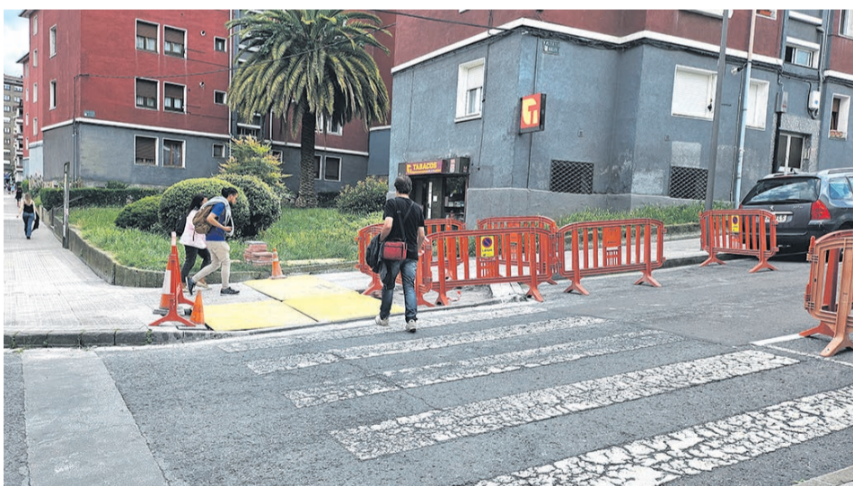
□ Aspecto actual de los trabajos.