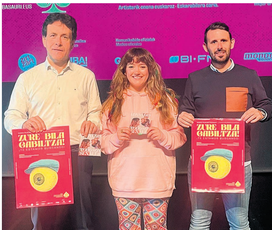
Presentación de la nueva cita con el Rockein.

Para participar es necesario tener, al menos, un componente nacido o residente en la Comunidad Autónoma Vasca (CAV) o Navarra. Para optar al premio a la Mejor banda local: contar, al menos, con un componente empadronado en Basauri, Arrigorriaga, Etxebarri, Galdakao, Ugao-Miraballes, Usansolo o Zaratamo. Para el premio Eskarabillera, que al menos el 50% de los componentes del gru-