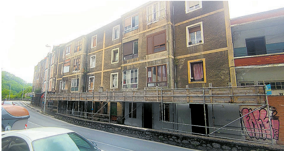
□ Zona de Kareaga donde se ubican los números 1, 2, 5, y 7.

Comentabam asimismo, que "ha sido prioritario desde hace años dar una respuesta efectiva a la situa-