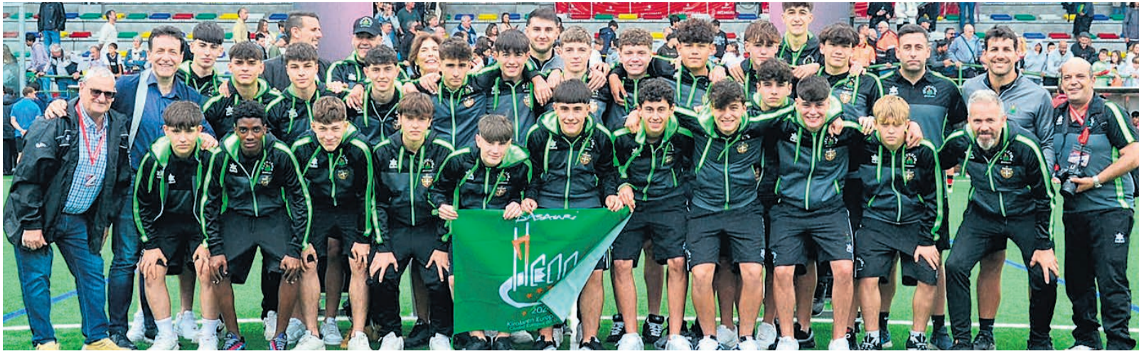
□ Selección de Basauri 2024 en el Piru Gainza.