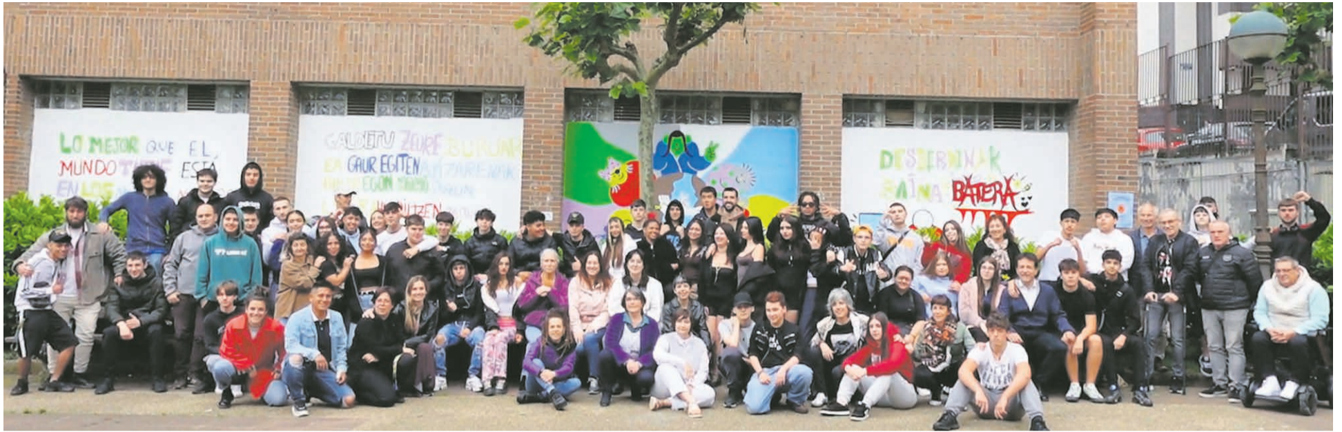
Algunos de los participantes en la fiesta, junto al alcalde.