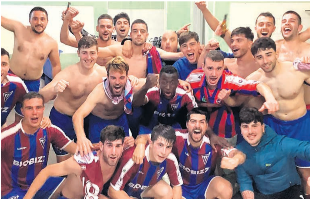
□ Alineación del CD Basconia para enfrentarse al Portugalete.

FÚTBOL. Siempre se suele decir que a la tercera va la vencida, y es que la UD San Miguel, tras dos años quedándose a las puertas del ascenso, esta temporada ha logrado su objetivo. Después de quedar tercera en liga por segundo año consecutivo, logró salir victoriosa de la eliminatoria de pla-