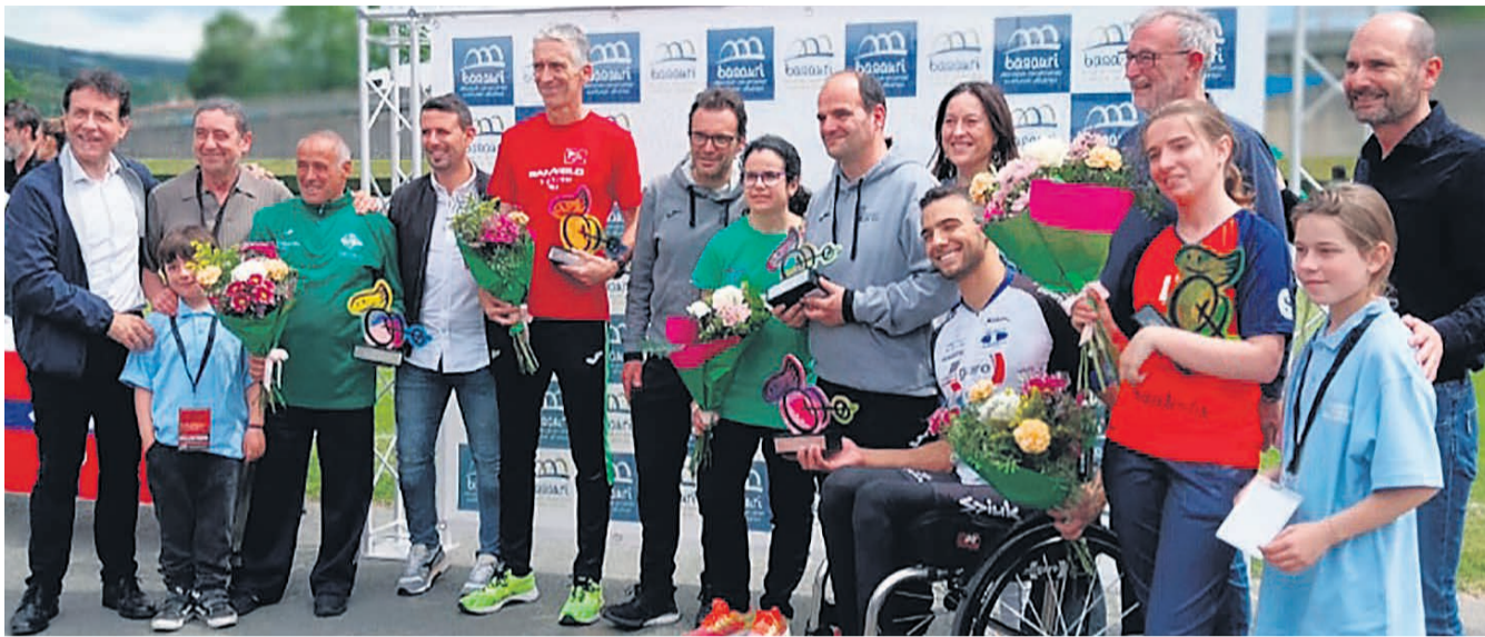
□ Varios premiados junto a autoridades.

Joan den maiatzaren 5ean Artunduagako polikiroldegian XXVI Meeting Paralinpikoa Basauriko Probak 2024 ospatu zen, non 250 atleta elkartu ziren 70 klub ordezkatuz. Beste behin ere, proba paralinpikoa oso arrakastatsua izan zen gaitasun-tako markei eta lehiaketan zehar lortutako ikusle kopuru handiari dagokienez. Herrialde ugarietako atletak izateaz gain, Estatuko klubuen presentzia handia eta euskal parte-hartzea gero eta ugariagoa izan zen.