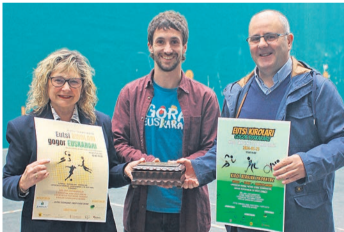
□ Un momento de la presentación.

"Lo más importante es el proyecto que llevamos