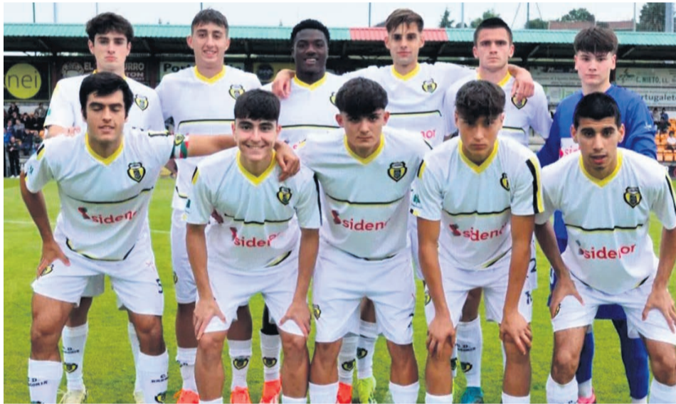
□ Alineación titular del C.D. Basconia en su partido contra Portugalete.

FÚTBOL. Llega el mes de mayo y Artunduaga se viste de gala, y es que por estas fechas en las últimas campañas, nos hemos acostumbrado a que el C.D. Basconia dispute el play-off de ascenso, en este caso, a 2 RFEF. Un año más, tras haber obtenido un meritorio segundo puesto en la competición liguera, se ve inmer-