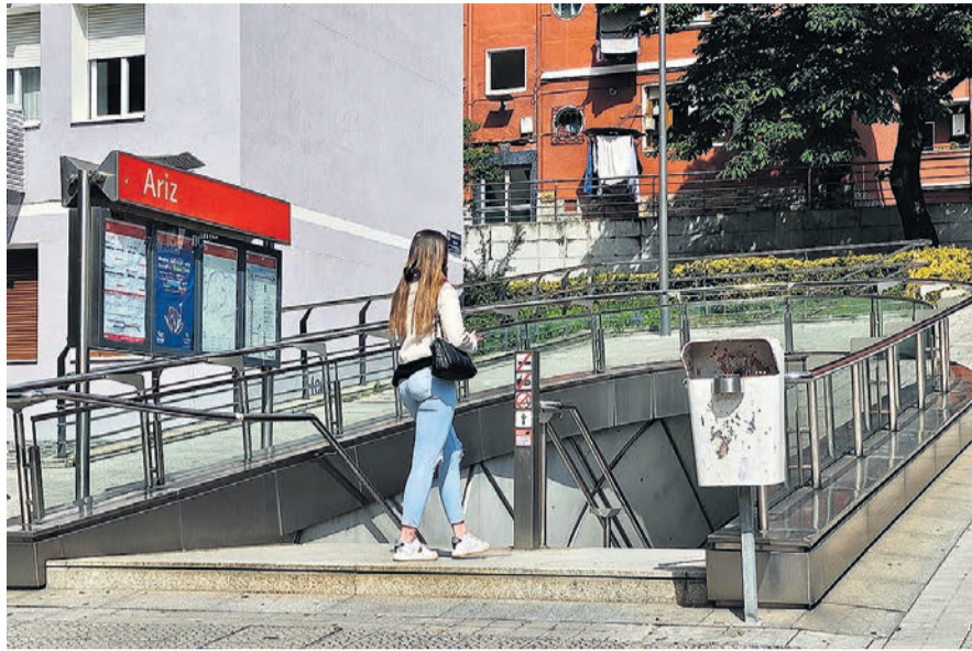
□ Acceso al metro en Basauri.