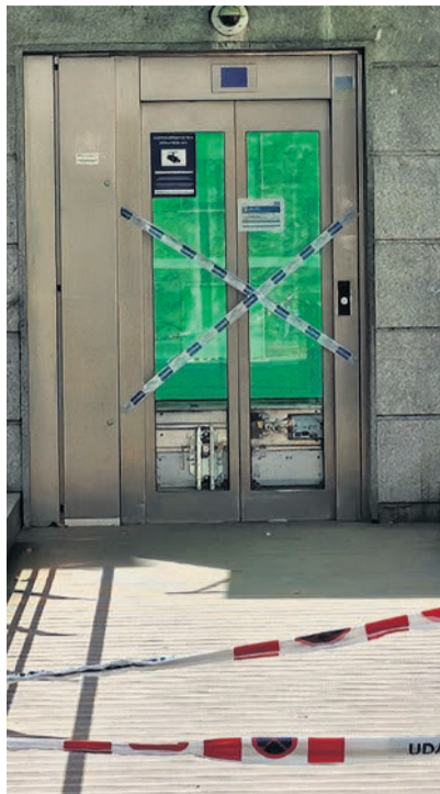
Ascensor de la calle Aragón.