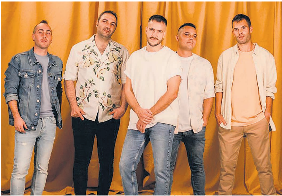
El grupo ETS.