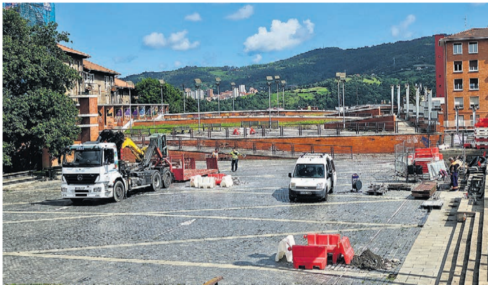
Estado actual de las obras en la plaza San Fausto.

Las obras contemplan la conservación del arbolado presente en el parte de la plaza existente y la renovación del alumbrado público, del mobiliario y de todos los pavimentos de la zona.