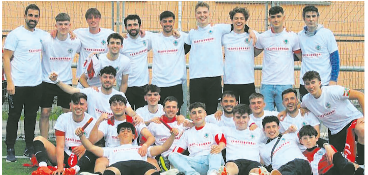
□ La plantilla del Indartsu celebra su ascenso.