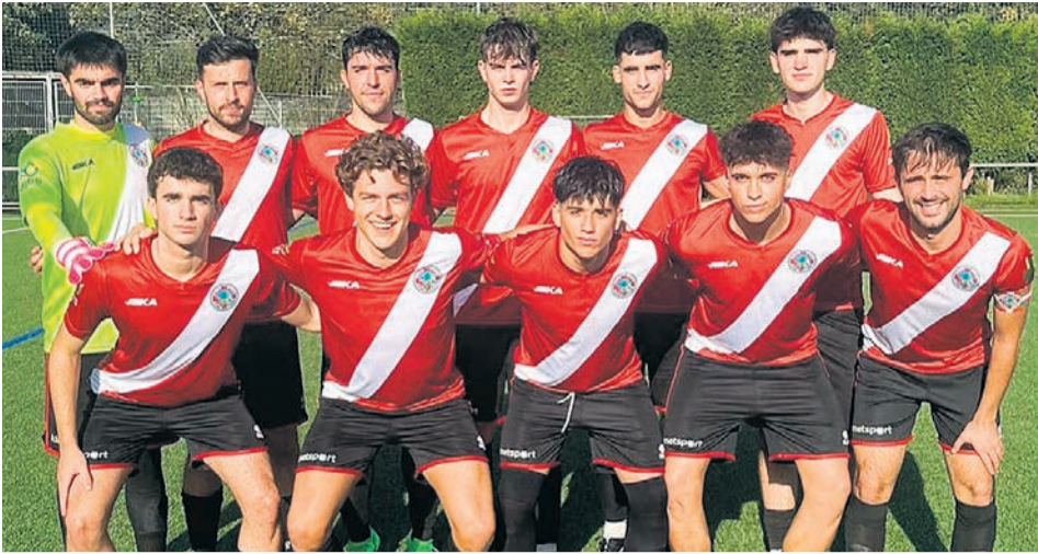
□ Alineación titular del Indartsu.