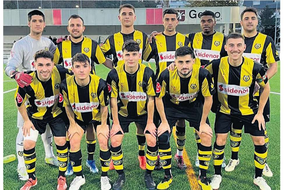
□ Alineación titular en el último partido del Basconia "B".