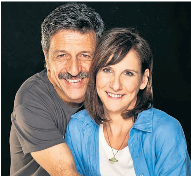
Los actores de 'Los amigos de ellos dos'.

Para el día 29 a las 20:00, suben al es-