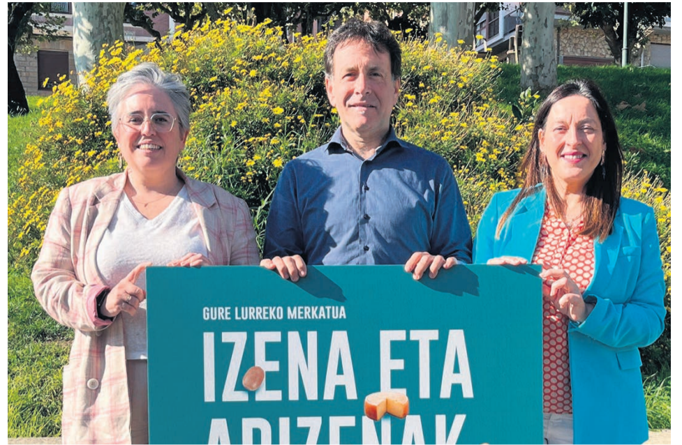
Presentación del nuevo mercado.