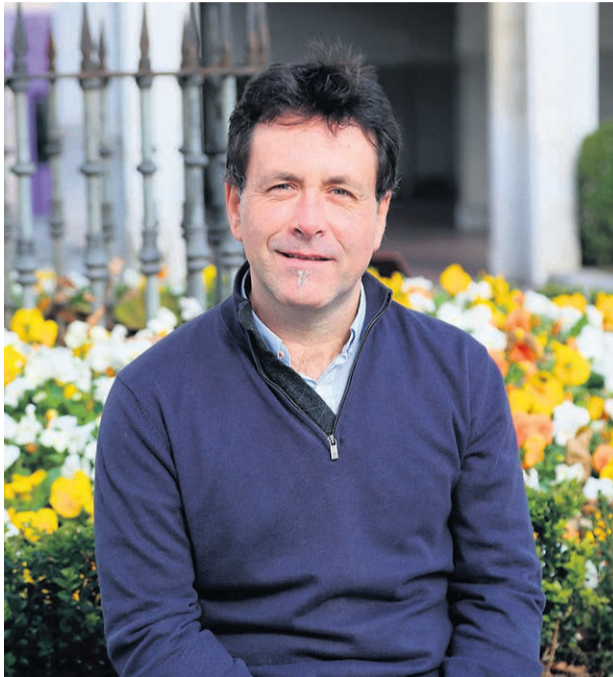
El primer mandatario de Basauri.

Todo lo que pueda decir es poco. Aunque como basauritarra y como alcalde agradeciera mil veces a Herriko Taldeak y a las cuadrillas su esfuerzo, me quedaría corto. Además, el ser alcalde me ha dado la oportunidad de ver más de cerca lo que hacen, que es una auténtica pasada. Organizan unas fiestas para un pueblo grande, con el trabajo que eso conlleva, se encuentran un montón de obstáculos por el camino, a