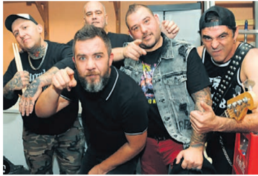
Los componentes de 'Kaotiko'.

Una jornada después, el sábado 12, toca el turno de Gozategi a las 22:30 horas. El grupo nació en Orío, enmar-