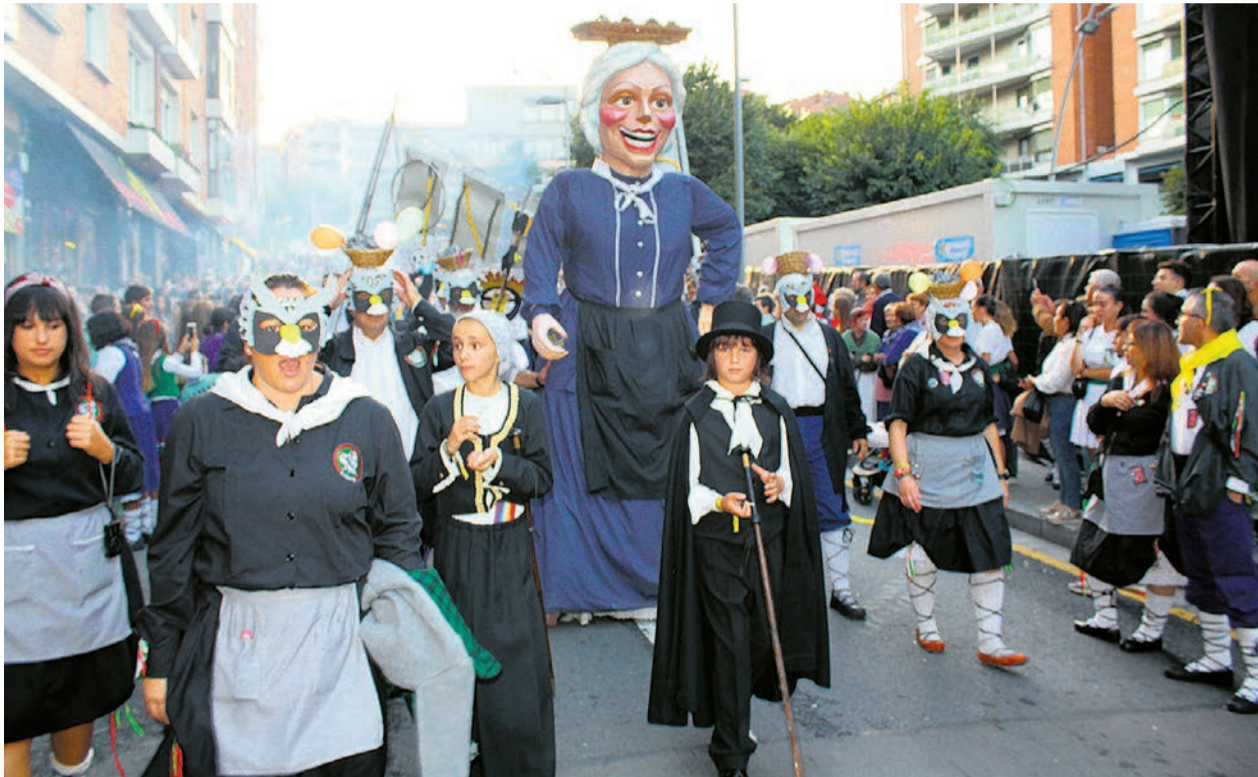
□ La bajada junto a la Escarabillera es uno de los actos más emblemáticos de fiestas.