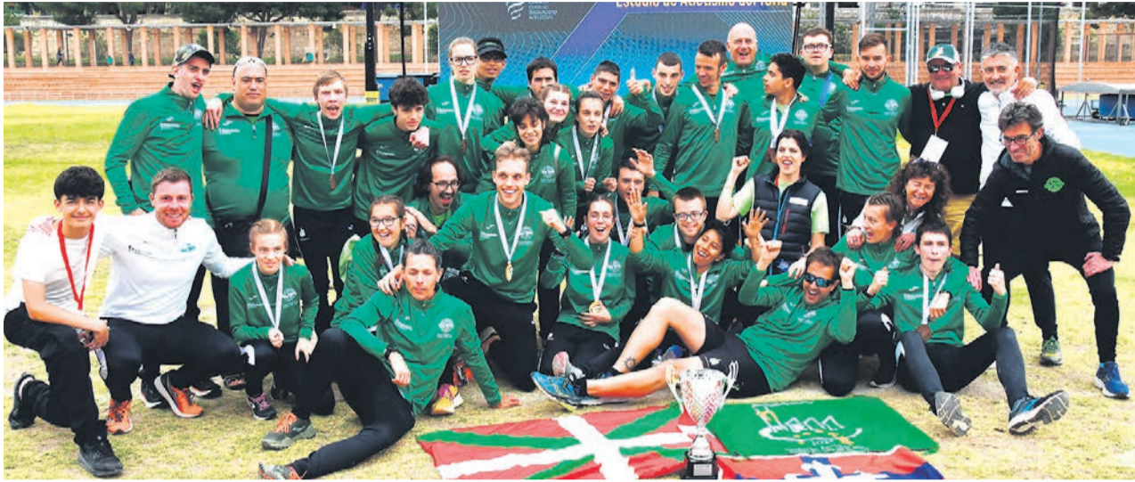
□ Integrantes del equipo.