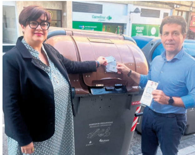
Presentación del nuevo sistema.

So ofrece una tarjeta por vivienda para abrir la cerradura electrónica pasándola por el lector. Hasta enero de 2025 las bolsas compostables podrán recogerse lunes, martes y miércoles de 10:00 a 14:00 horas en el Servicio de Atención Ciudadana (SAC) de la