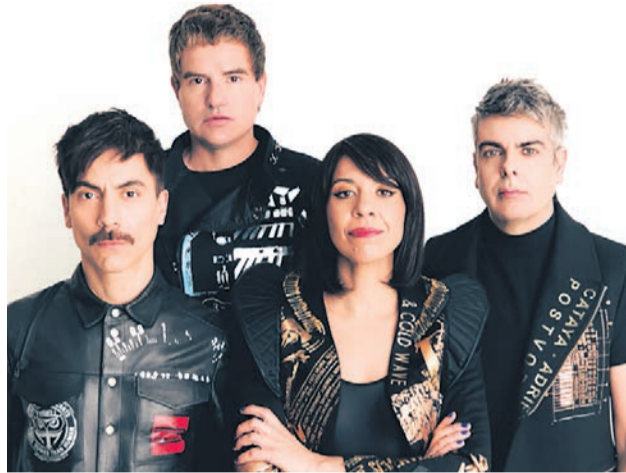
Los integrantes de Dorian.