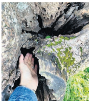
□ Uno de los árboles.

tección y gestión del arbolado urbano de Basauri aprobada en junio de 2022, los Servicios Técnicos, con la colaboración del servicio de mantenimiento de parques, jardines y arbolado, realizan controles del arbolado, a fin de detectar posibles problemas fisiológicos, patológicos o de estabilidad. Como fruto de esos exámenes y de dos informes técnicos, se han detectado varios ejemplares cuyo estado, provo-