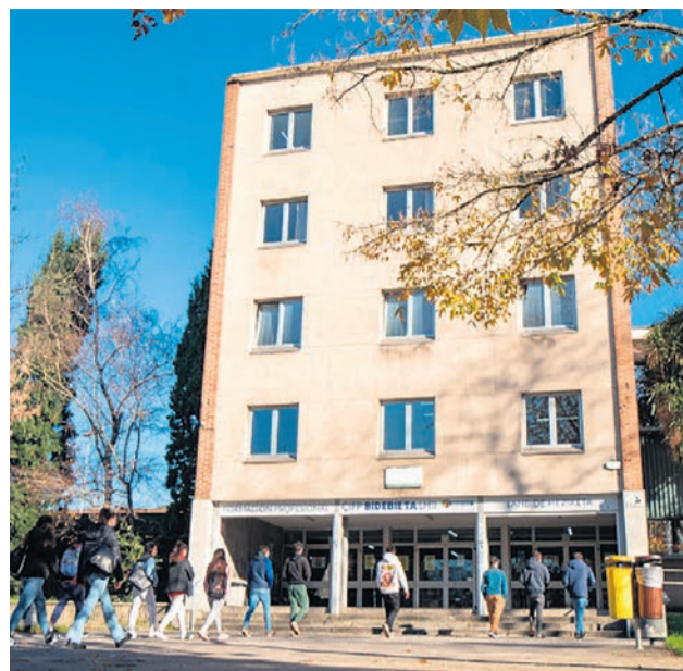
Fachada del CIFP Bidebieta.

El CIFP Bidebieta LHII ofrece gratuitamente cursos de capacitación digital. La iniciativa del Departamento de Educación del Gobierno Vasco se dirige a la ciudadanía en general. Financiados por el Ministerio de Educación, Formación Profesional y Deportes y por la Unión Europea NextGenerationEU, en el marco del Plan de Recuperación, Transformación y Resiliencia, cuentan con 8 horas, a impartir en octubre y noviembre durante 4 jornadas, 2 horas cada día. "Se impartirán en diferentes opciones de horario y calendario para facilitar la asistencia a las personas interesadas", comentan desde el centro.