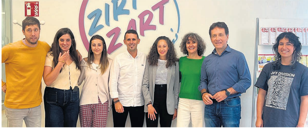
Presentación del nuevo servicio.

Alrededor de 300 metros cuadrados son los que ocupa el local, con dos plantas y patio exterior. Dará atención directa e información a jóvenes y organizará actividades culturales y lúdicas, cursos, espectáculos y talleres, entre otras opciones. En el primer piso está la Oficina de Información Juvenil, el área de Gaztegune y una sala polivalente denominada ‘Coworking Gunea’, que se puede reservar para trabajos en grupo, reuniones o cualquier iniciativa social o