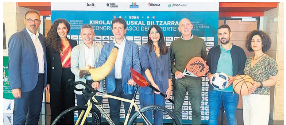
□ Presentación del congreso.

El grupo ecologista Sagarrak advirtió sobre esta tala. Hasta Bizkotxalde y la ribera del río, junto a la Torre de Ariz, se desplazaron varios miembros para protestar. Aseguran que algunos tocones estaban "sanos", otros sí presentaban "alteraciones u hongos". A pesar de eso, la cantidad de árboles les parece "excesiva", por lo que pidieron "pruebas que determinen el problema" y anunciaron queja por escrito.