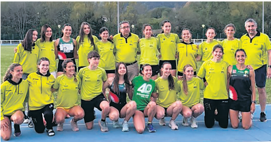
□ Foto de grupo del equipo durangarra.