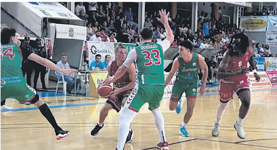
□ Una acción del partido del pasado fin de semana en Benicarló.