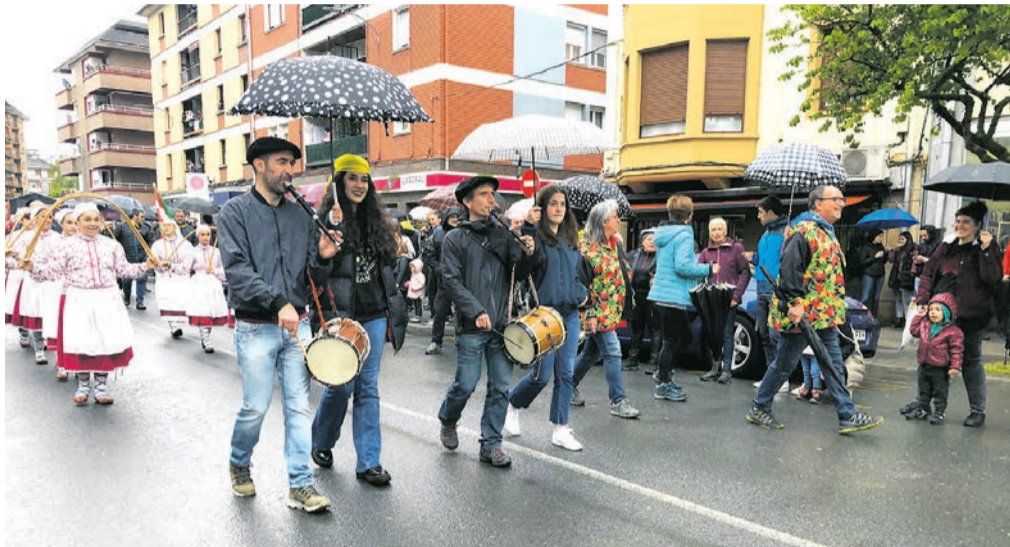
Instantes previos al inicio de las fiestas de Matiena en una anterior edición.