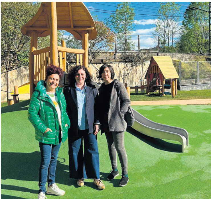
La alcaldesa Ainhoa Salterain, en el centro, acudió a visitar las instalaciones.

Y se han creado itinerarios accesibles que conectan la fuente de agua con la salida al exterior, fomentando un entorno seguro y estimulante para el juego y la exploración. La introducción de áreas de trabajo y socialización equipadas con mesas y sillas ofrece espacios versátiles para la enseñanza y el descanso.