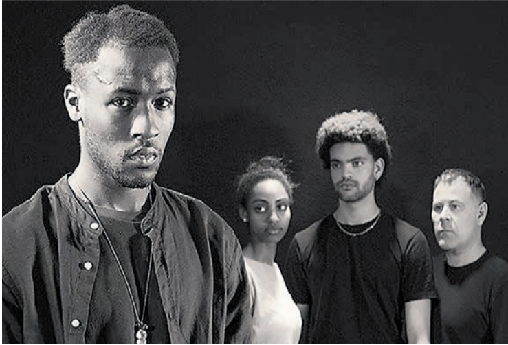
□ La obra teatral 'Miñan', de Artedrama, llega a Amorebieta.

El 26 de diciembre, a las 17.30 horas, será el turno para 'Kontukantari 3: Zimurren artean kontukantari', un viaje intergeneracional lleno