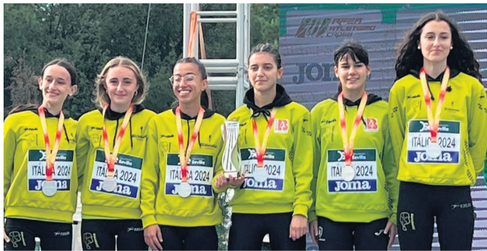
Integrantes del equipo Sub 20, subcampeonas de España de cross.