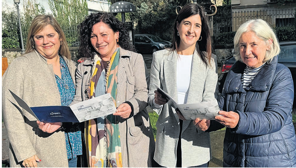
Integrantes del equipo de gobierno posan con el libretto de cuentas del próximo año.

Uno de los proyectos más significativos es la transformación de Urgozo kiroldegia en un espacio polivalente capaz de albergar actividades deportivas, culturales y sociales. Este proyecto busca maximizar el uso de esta infraestructura y convertirla en