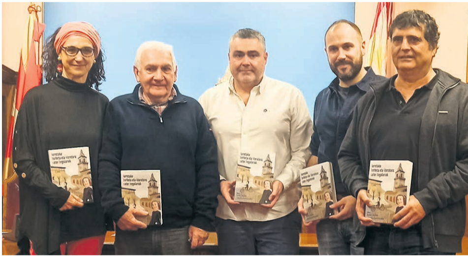
Liburua Iurretako udaletxean aurkeztu zuten.