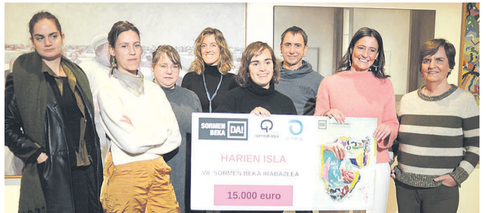
Imagen de la entrega del premio el pasado día 8 en el Museo de Durango.

Además, se organizarán visitas guiadas y charlas con el objetivo de enriquecer la experiencia del público y acercar a la ciudadanía la profundidad y diversidad de la obra de Basterretxea. Para más información, las personas interesadas pueden contactar con el museo o visitar sus instalaciones.