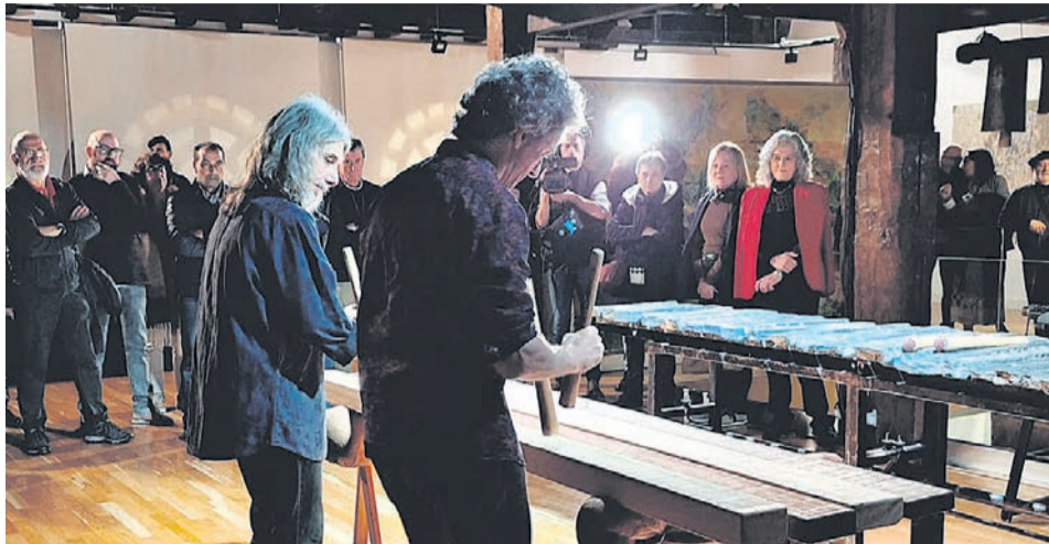
Una imagen del día de la inauguración de la exposición.