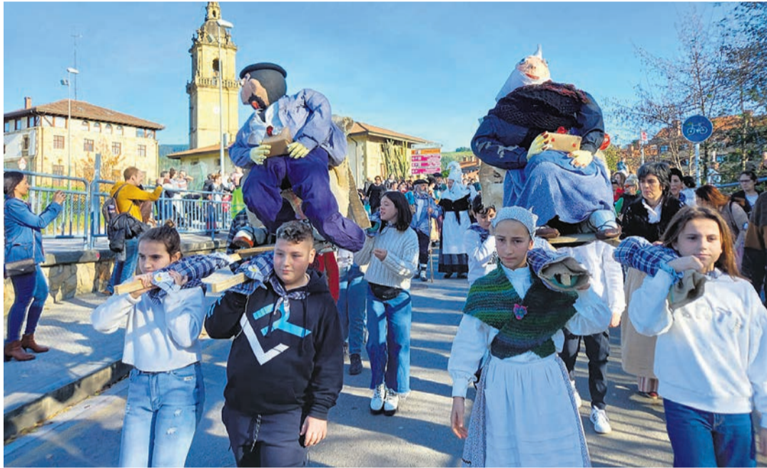
La kalejira por Iurreta el pasado año.

Por lo que respecta a los programas navideños, el 21 Durango abre en Landako Gunea la pista de hielo, hasta el 6 de enero. Ese día hay rastrillo navideño de 10.00 a 20.00 en el pórtico, taller de pintxos navideños a las 12.30 en la plaza del mercado, kalejira del Orfeón de 12.00 a 14.00 y concierto de la banda de música a las 19.00 en San Agustín. Los días 22 y 23 programan feria de ar-