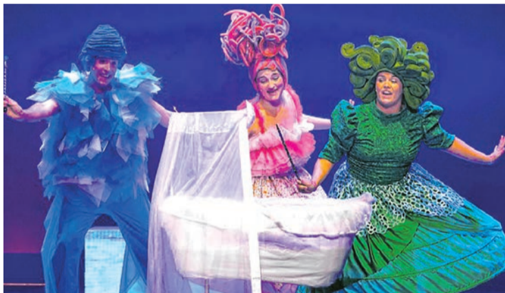
‘Loti ederrak’ se podrá ver en Durango el 18 de febrero.