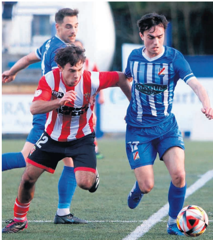
□ Una acción del partido ante el Pasaia en Tabira

Precisamente este sábado 17 de febrero a