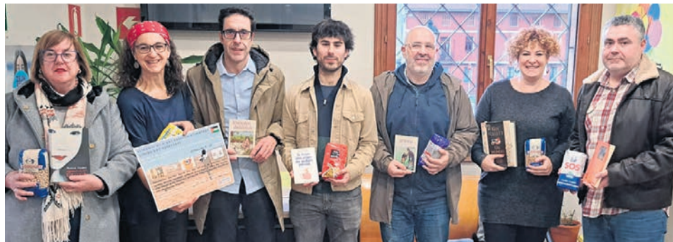
Presentación de la campaña solidaria.