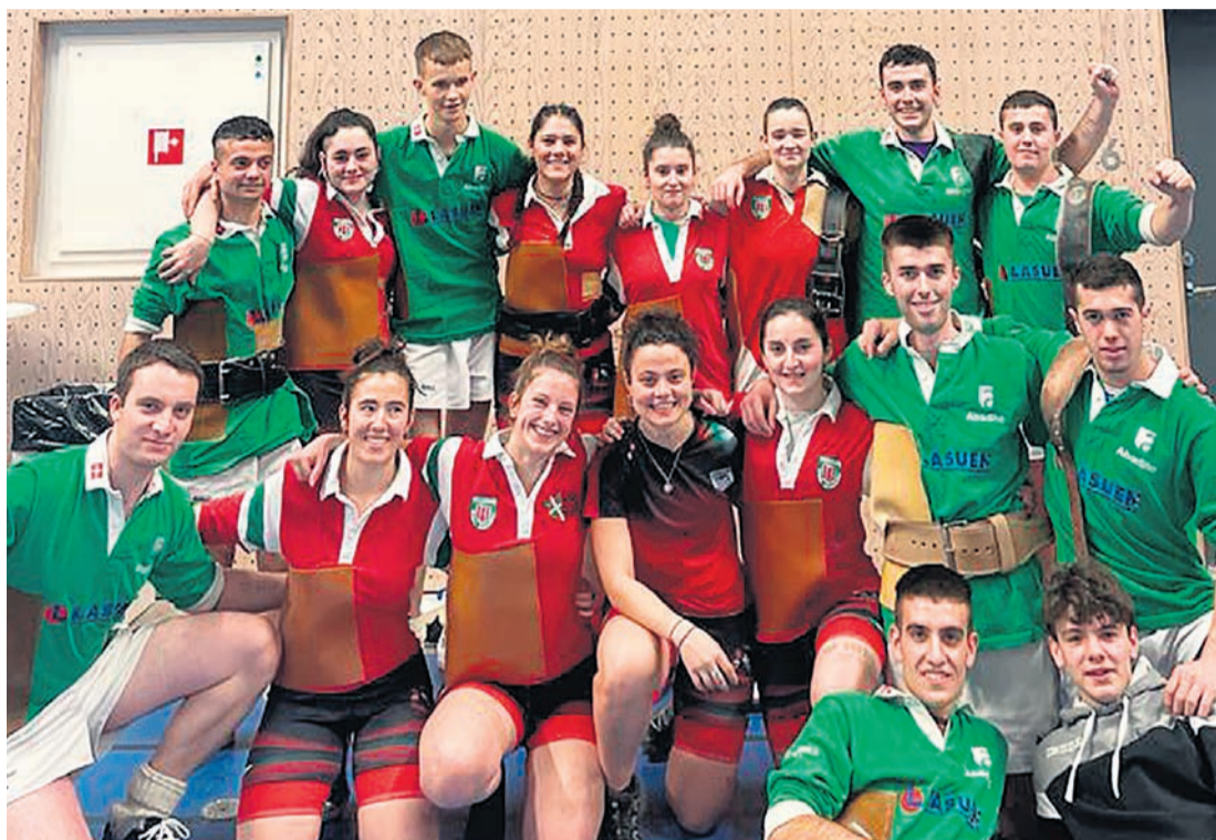
Los campeones de Abadiño.