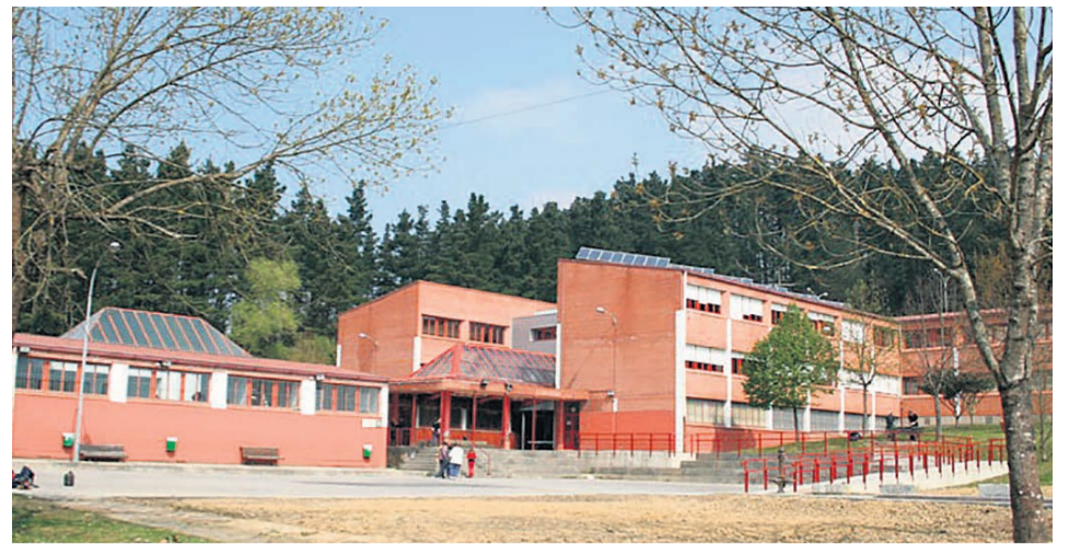
□ El actual edificio del instituto.

La unidad familiar debe estar empadronada en Iurreta desde el 1 de enero de 2023. Información: 94 620 03 42, Ibarretxe Kultur Etxea, HAZ-SAC o la web www.iurreta.eus .