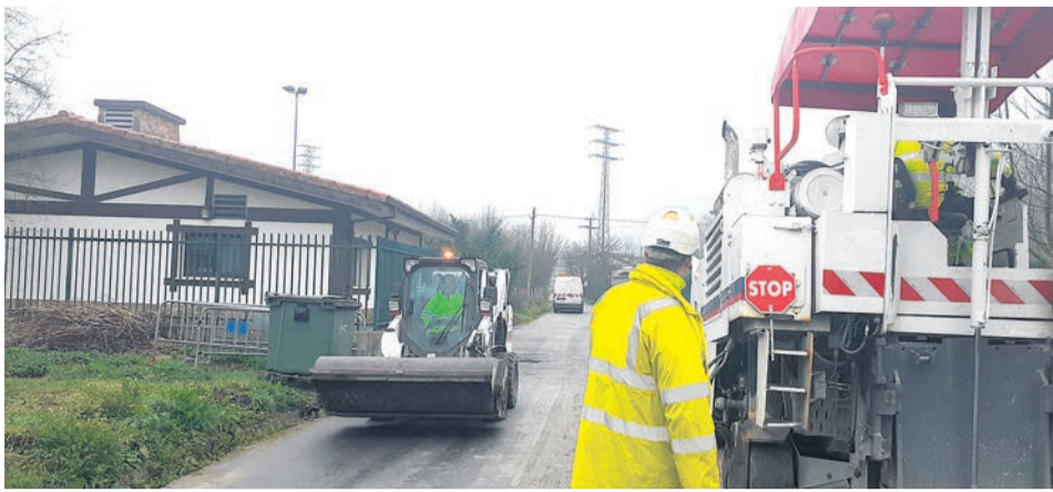
Trabajos en los barrios de Amorebieta-Etxano.