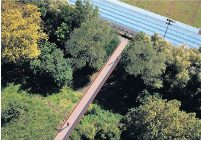
□ Aspecto que tendrá la pasarela.

La nueva estructura tendrá una longitud de 42,6 metros y un ancho de 2,48 metros.