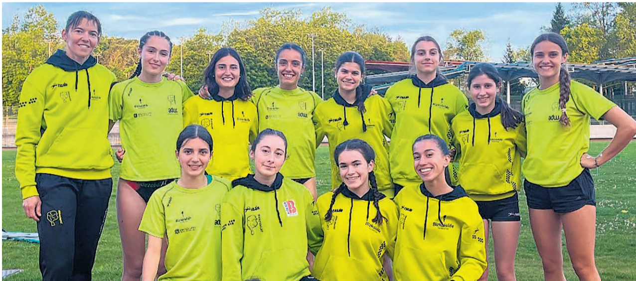
Atletas del conjunto durangarra participantes en la final de descenso.

El Bidezabal no solo consiguió salvar la categoría, sino que además logró ser el mejor equipo en esta final por la permanencia. “La primera jornada, donde ocupamos la última plaza, hizo que saltaran todas las alarmas. En la segunda jornada, con un segundo puesto, conseguimos subir hasta la 11ª posición. Y con esta última victoria, nuestras atletas han conseguido clasificarse en el 9º puesto general mejorando nota-