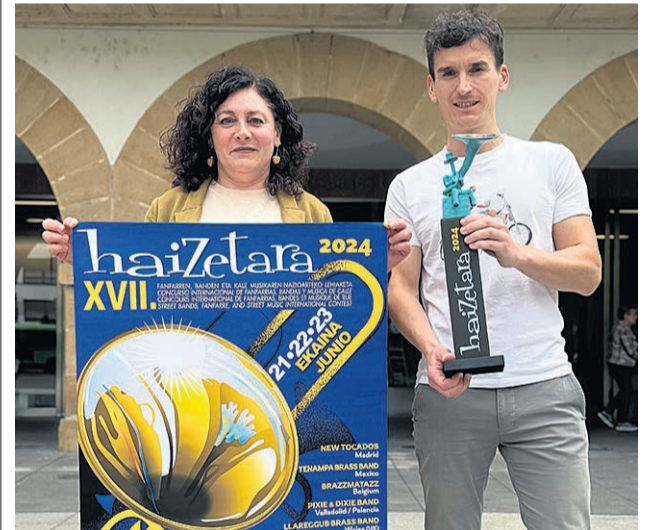
Salterain y Bilbao presentaron Haizetara.