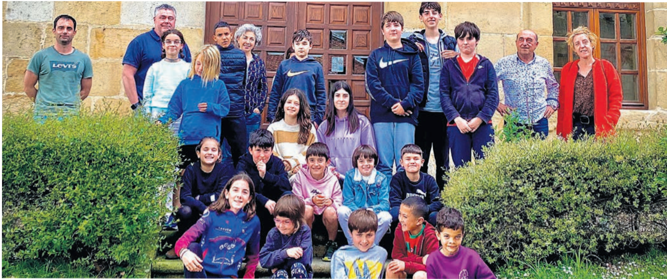
Udal Foroan parte hartu zuten ikasleak udaletxearen aurrean.

Hartutako konpromisoak hauek izan dira: sentsibilizazio-kanpaina bat egitea, ingurumenaren aldeko ekint-