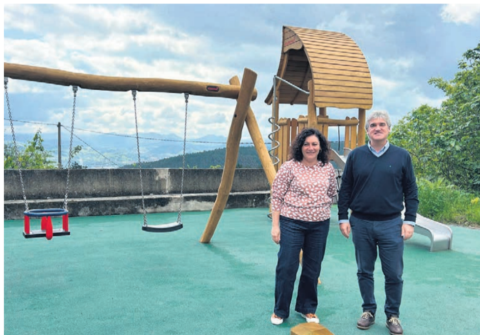
□ Salterain y Gandiaga en Bernagoitia.