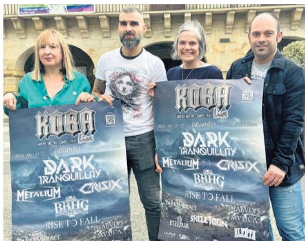
El festival fue presentado el pasado 11 de junio.

"Durante todo el año podemos escuchar en Abadiño una gran variedad de estilos musicales, a los que KOBA