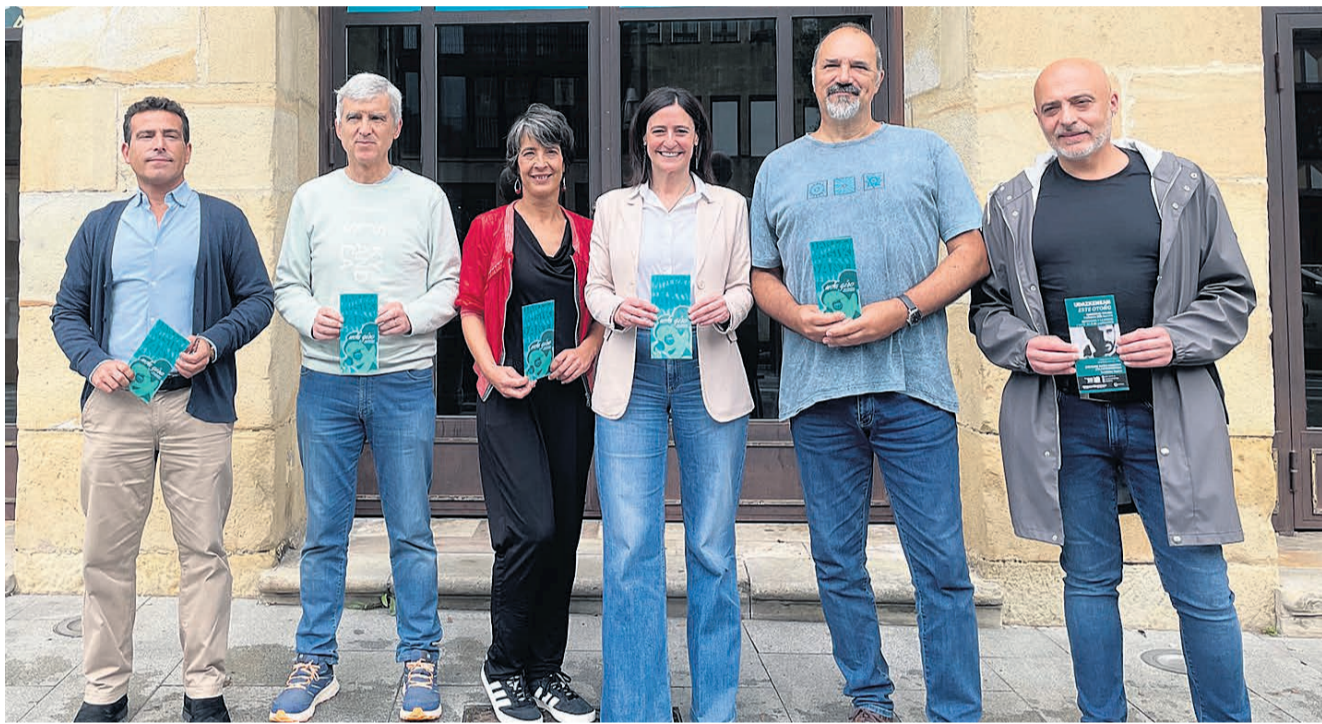
El programa fue presentado el pasado martes 11.