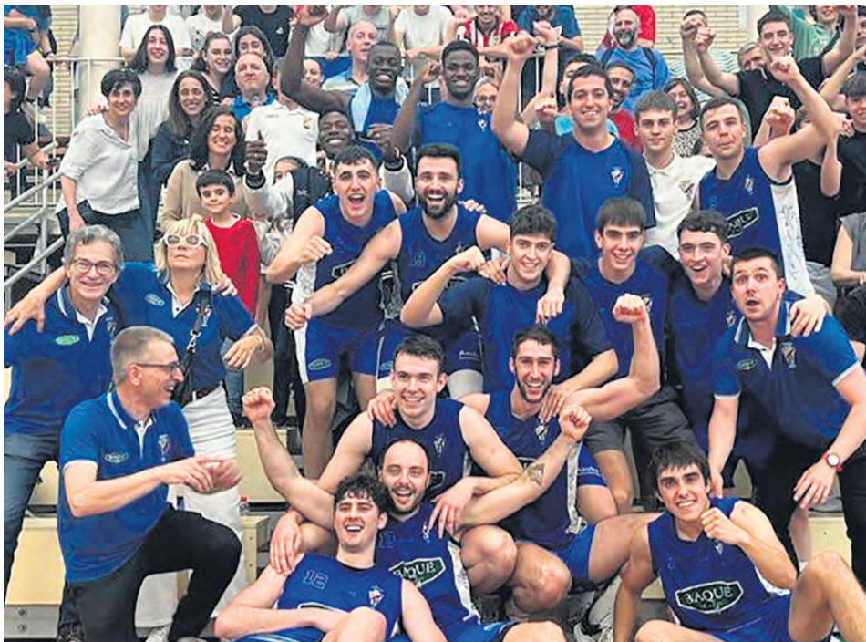
El equipo celebra el ascenso certificado el día 11 en la cancha del Loiola Indautxu.