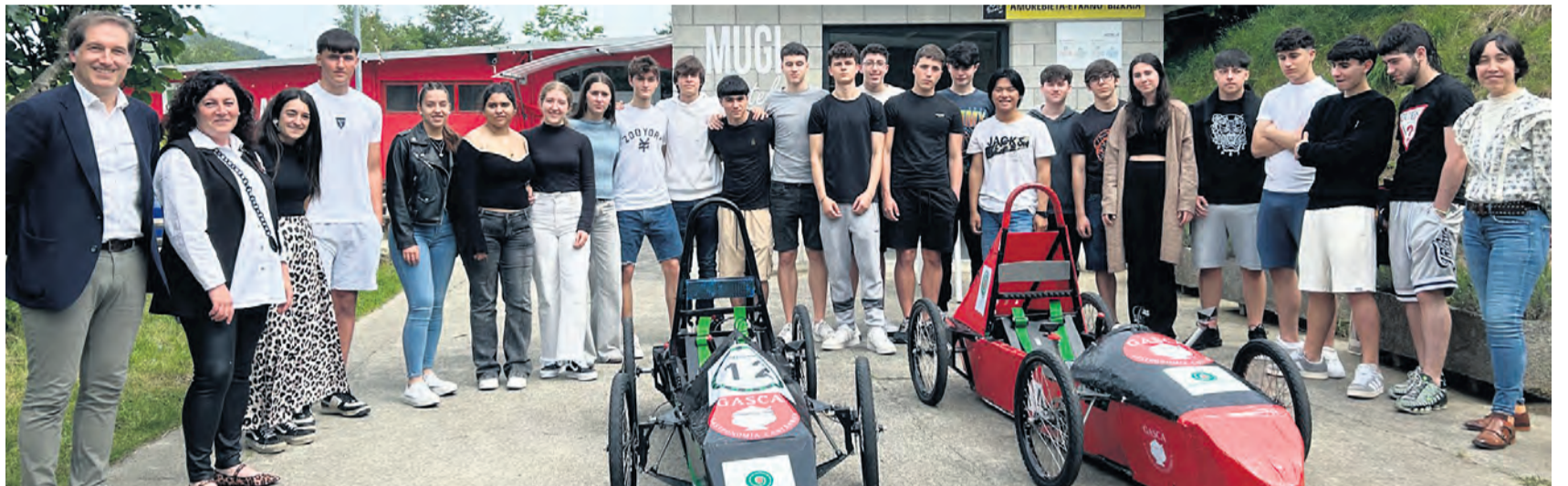
Estudiantes de Lauaxeta tomarán parte en el evento.