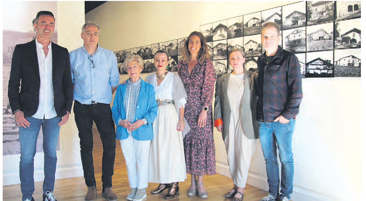
□ Representantes municipales y de la familia Ansorena.

Operando desde un laboratorio improvisado en el camarote de su casa en Barrenkale, utilizó una cámara de clichés de cristal de 6x9 para documentar la vida de Durango, creando