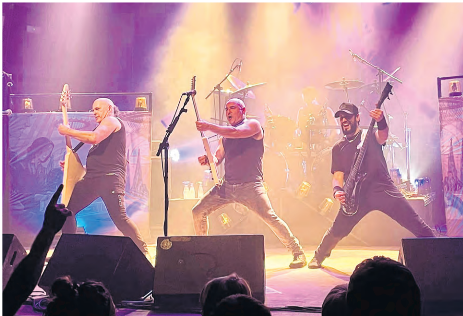
El concierto de Su Ta Gar será uno de los platos fuertes.

El sábado 25 de mayo será el turno para la obra "La batalla de los ausentes" de La Zaranda. En 2023 cumplió 45 años encima de los escenarios y lo celebra con esta metáfora de la vida como combate, donde los tres actores clásicos de la compañía son los restos de un ejército en desbandada, en esta guerra sin cuartel. Épica para tres farsantes, sátira de todo poder humano, la dignidad y la fe como acto de resistencia. Las entradas cuestan 12 euros (9 euros para socios).