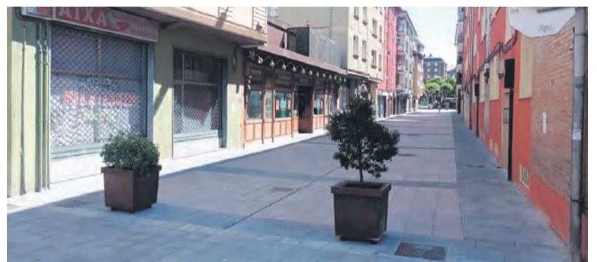
□ Así luce ahora la calle Txinurrisol.

"Este era uno de los retos de esta legislatura. Una obra importante, largamente esperada por vecinas y vecinos, y que supondrá una mejora sustancial de la calidad de vida. Es un paso importante en el proceso de renovación de Traña-Matiena", destacó el alcalde, Mikel Urrutia.