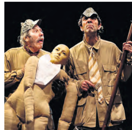
□ El viernes 24 se podrá ver "La batalla de los ausentes" de La Zaranda.

El 7 de junio llegará el coro y orquesta de cámara de Bilbao con la velada musical "Jesucristo Superstar, West Side Story, Beatles, ABBA". Comenzará a las 20.00 horas y la entrada cuesta 6,20 euros.