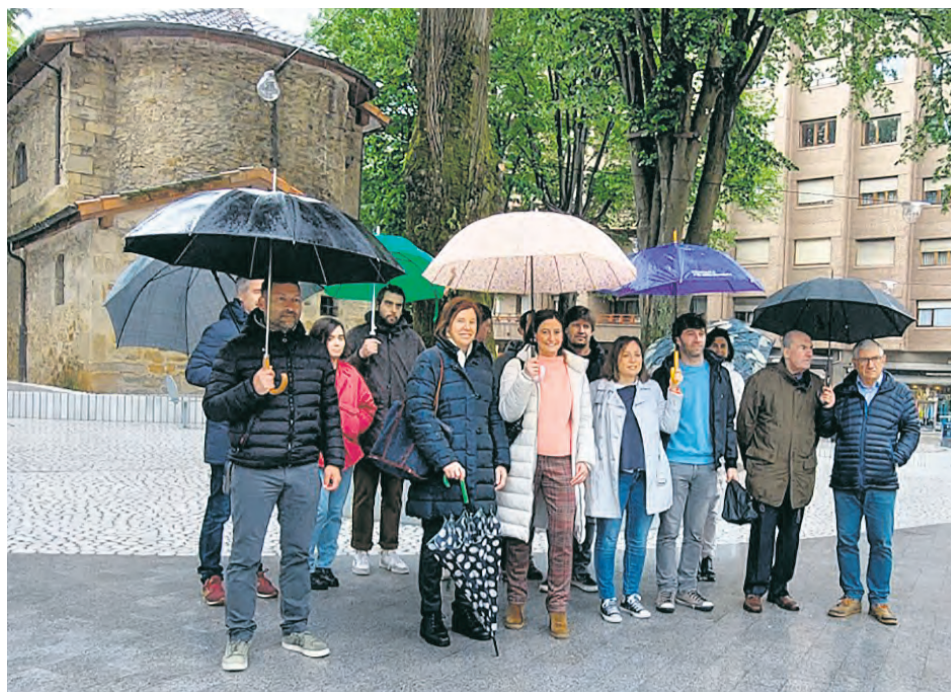
Representantes del Ayuntamiento y de la asociación vecinal de la zona en la inauguración del espacio.