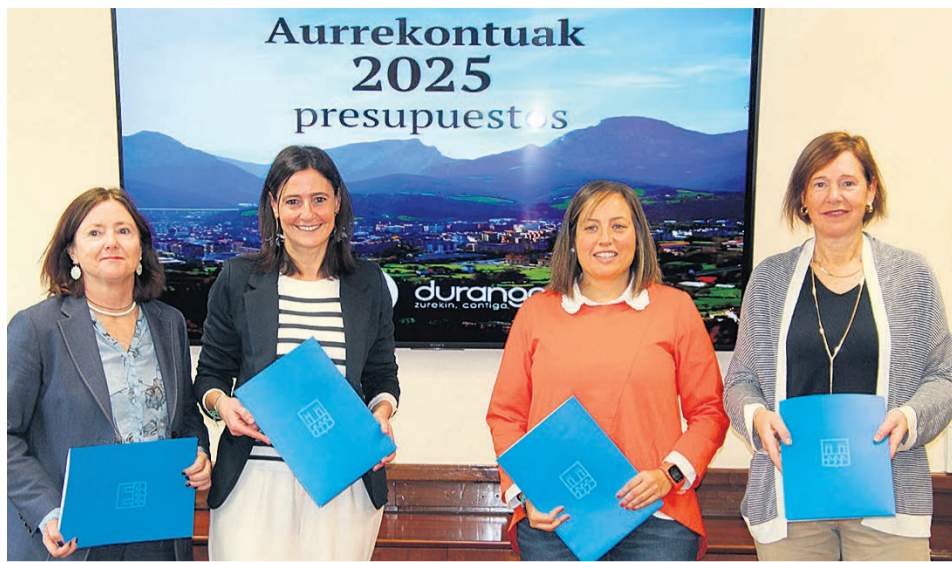
Integrantes del equipo de gobierno que dieron a conocer el proyecto.