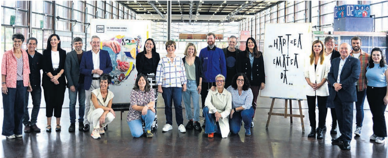
□ Aurtengo kartela eta leloa aurkezteko eginda prentsaurrekoaren irudia.