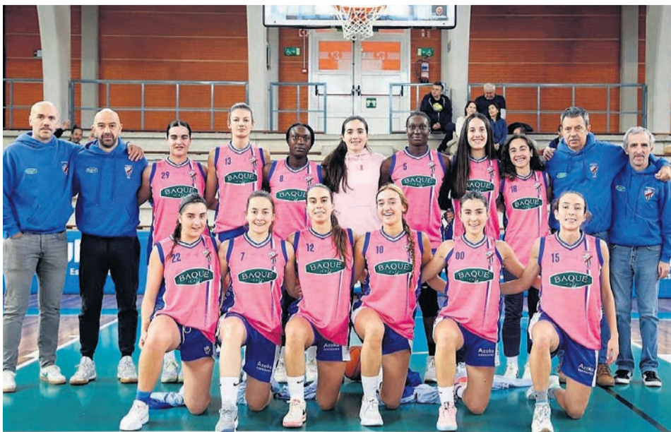
El equipo femenino, de rosa el pasado fin de semana contra el cáncer de mama.