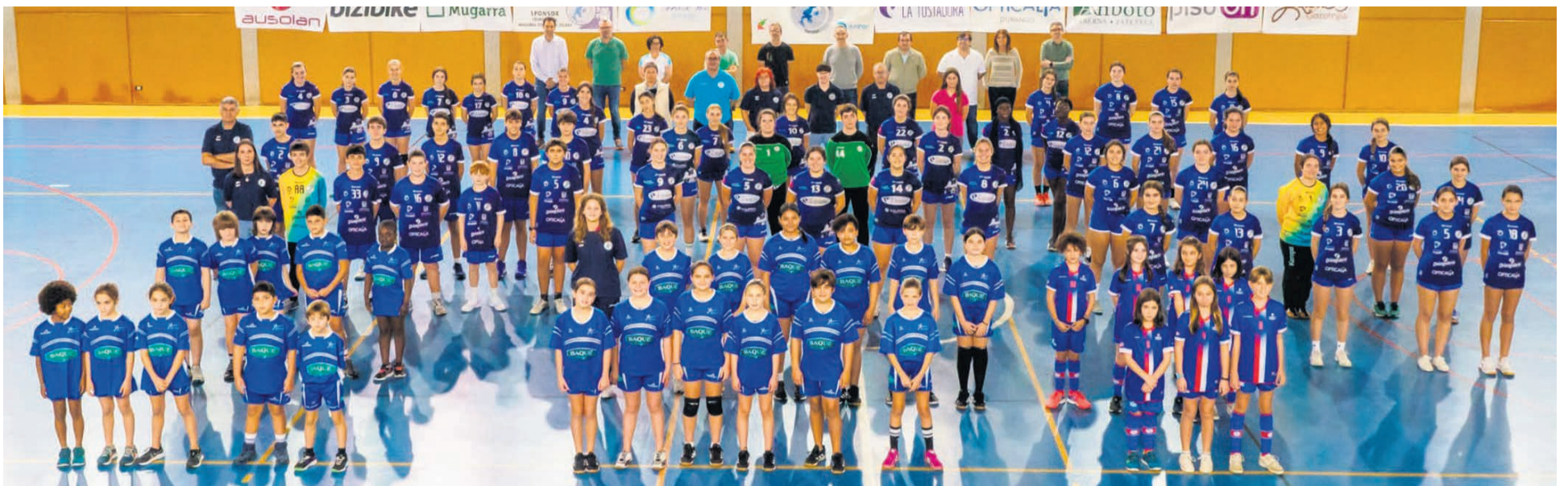
□ Foto de familia de la presentación de los equipos de esta temporada. .