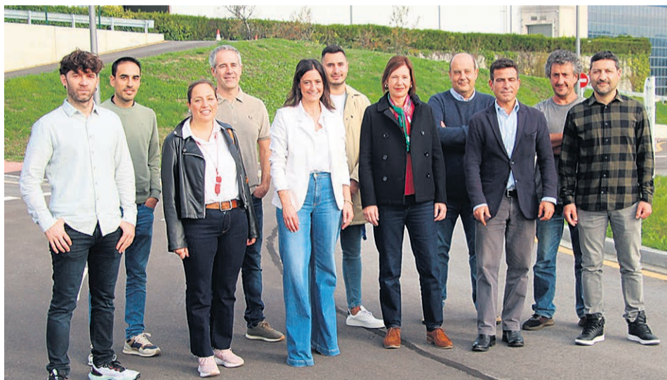
Responsables políticos y técnicos en la nueva carretera que une Tabira con Montorreta.