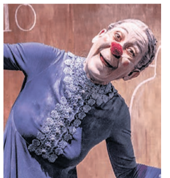
Obra de títeres “Estación Paraíso”.

“Lo único que verdaderamente quise toda la vida es ser delgada”, es el título del espectáculo de ButacaZero, el 23 de noviembre, a las 20.00, sobre la gordofobia. Y el 29, a las 20.00, hay teatro con Tentazioa y “Ez naiz inoiz Dublín en egon”, ácida comedia sobre la aceptación de vivencias y creencias ajenas.