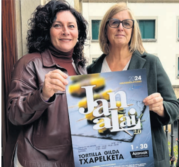
La alcaldesa Ainhoa Salterain y la concejala Amaia Aurrekoetxea presentaron la iniciativa.

Además, el público tendrá la oportunidad de votar depositando sus valoraciones en buzones situados en los bares participantes. Aquellas personas que participen optarán a 500 euros mediante un sorteo. Los establecimientos con