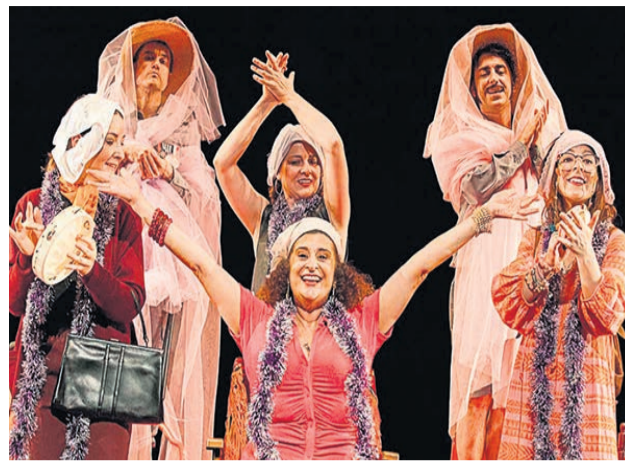
□ Un momento de "Las bingueras de Eurípides".

productos de protección y resina, así como el saneamiento de la superficie actual. Además, se procederá a la instalación de una membrana impermeabilizante mejorada, la colocación de cazoletas y remates en los lucernarios, y la instalación de una línea de vida con columna de anclaje para la seguridad en futuras intervenciones. También se realizará la retirada de los tubos de fibrocemento de ventilación y su sustitución por codos de PVC anclados a la cubierta.