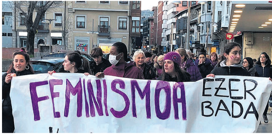
Una manifestación feminista a su paso por Ezkurti, en Durango.

Para el 25, a las 13:00, hay declaración institucional y ofrenda floral en el Espacio para el recuerdo a las mujeres asesinadas de la plaza Ambrosio Meabe. Y a las 19:00, movilización con el llamamiento de Durangoko Autodefensa Feminista Asanbladak. El 27, a las 10:30, el cine Zugaza proyecta “How to have sex”, de Molly Manning Walker, guiada por Sortzen Kontsulotoriak y