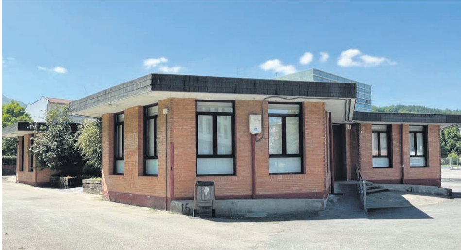
□ Imagen exterior del edificio.