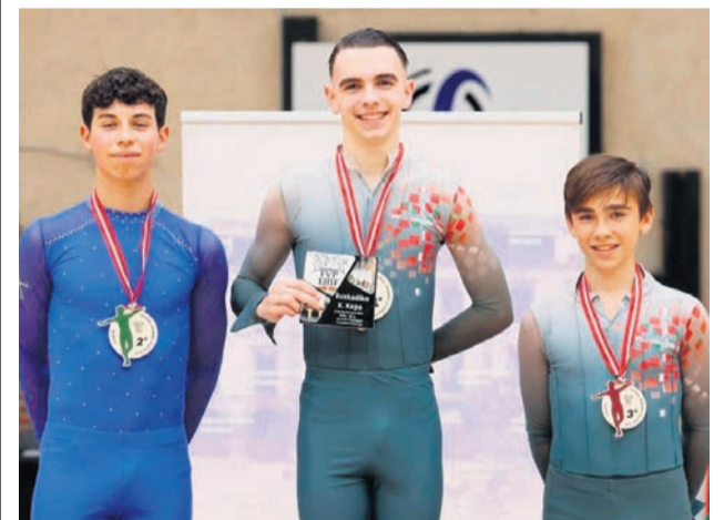
□ El patinador zornotzarra de categoría cadete en el centro del podio tras proclamarse campeón de Euskadi.

Este domingo volverán a Urritxe, donde se medirán al filial del Barça, que es 15º en la tabla, a partir de las 12.00 horas. Después deberán desplazarse al feudo de la Ponferradina (13º) y el 30 de noviembre afrontarán un derbi bizkaino en casa ante el Sestao River (17º).