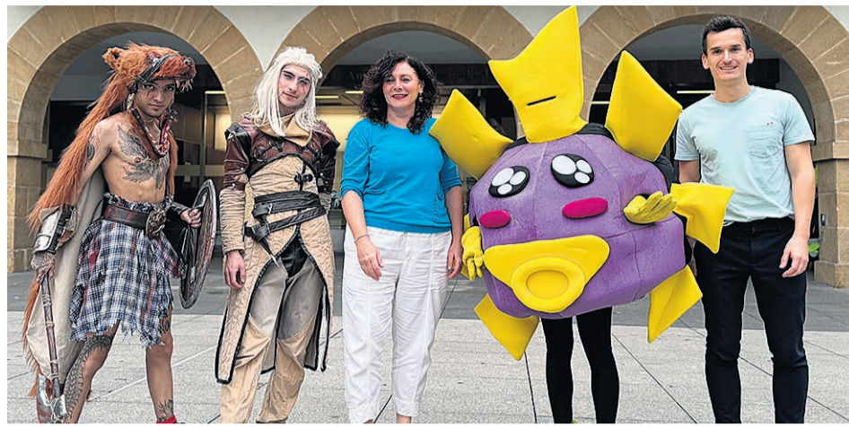
Imagen de la presentación de la 18ª edición del festival Mangamore.