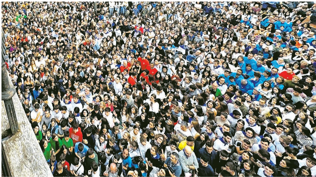
La plaza del ayuntamiento se llenará para dar la bienvenida a las fiestas el día 11.