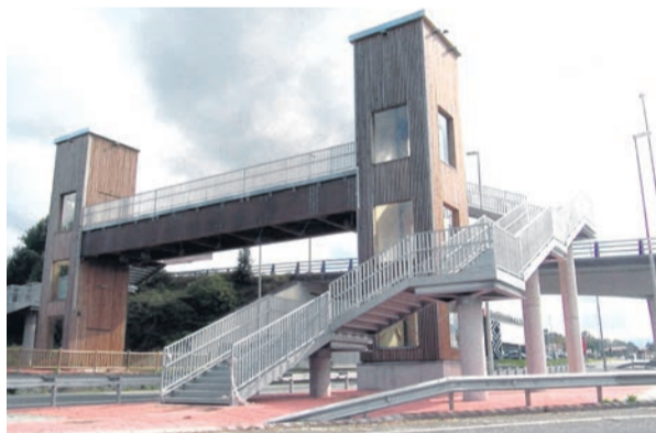
□ La nueva pasarela peatonal une los dos márgenes de la N-634.

Por otro lado, el funcionamiento del ascen-