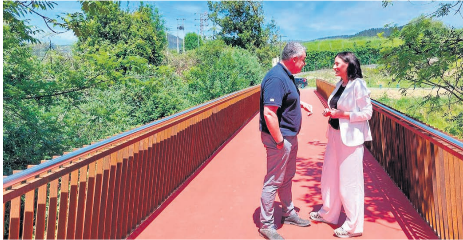
□ Oskar Koka, alcalde de Iurreta, y Mireia Elkoroiribe, alcaldesa de Durango, en el puente.

Tras un proceso participativo que ha involucrado a la ciudadanía de Durango e Iurreta, el nombre 'Atxutxietako Zubia' es el nuevo para el puente que conecta ambas localidades sobre el Ibaizabal. Reemplaza al histórico 'Puente del Diablo' y se ha buscado un nombre que resalte identidad local y lazos entre municipios.