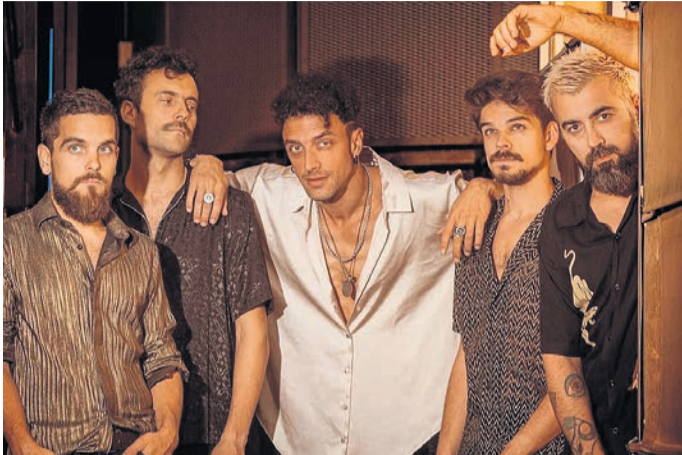
□ Integrantes de Shinova, grupo local que está triunfando a nivel nacional.

Dos de los platos fuertes serán los de Shinova, banda de rock alternativo