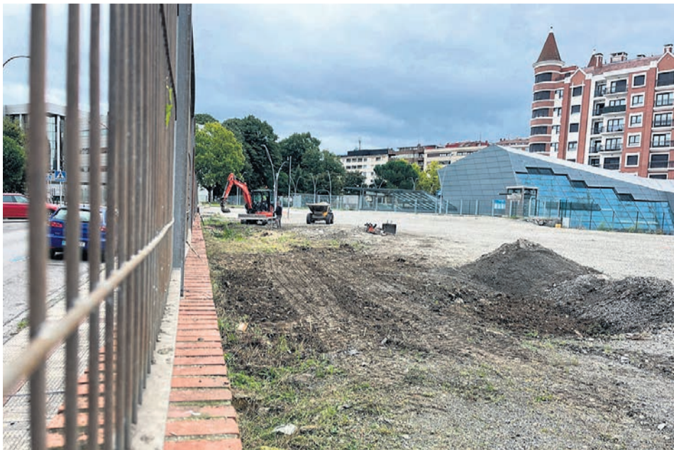
Los trabajos comenzaron el 9 de septiembre y concluirán a finales de mes.