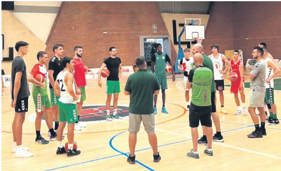
Imagen de un entrenamiento del equipo en Larrea.