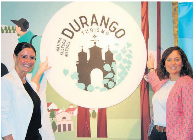
La alcaldesa, Mireia Elkoroiribe, y la teniente de alcalde, Jesica Ruíz, muestran la nueva imagen.