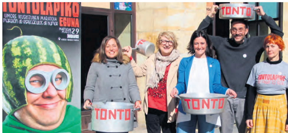
Imagen de la presentación de la nueva edición de Tontolapiko Eguna.