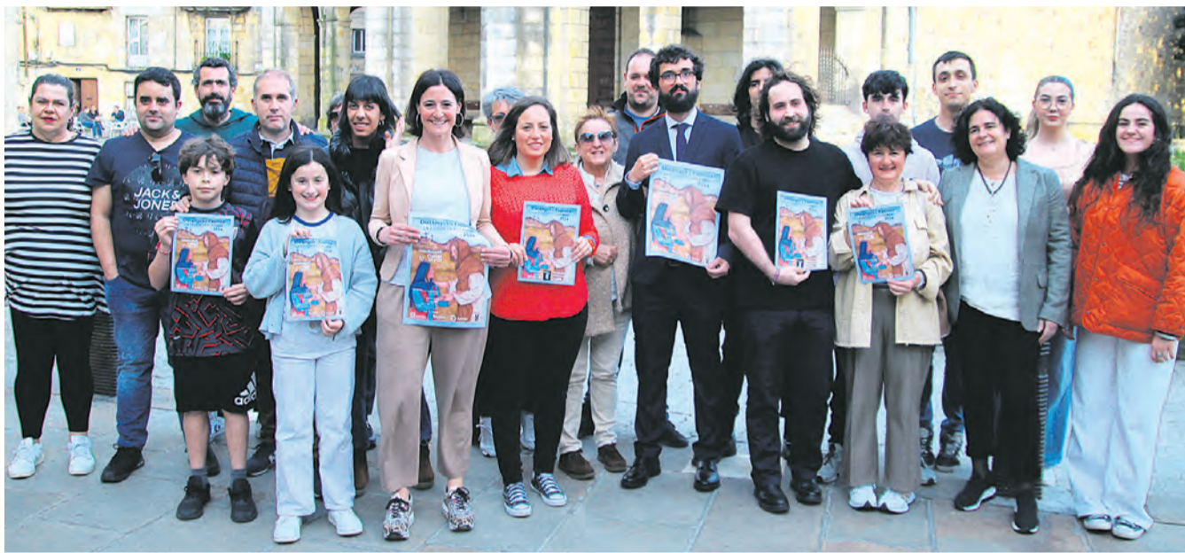
Asistentes a la presentación de la Pasión.