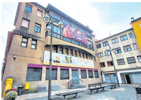
Antiguo edificio de Correos.

El Gobierno Municipal de Durango descarta el proyecto de convertir el antiguo edificio de Correos en Casa de Cultura, tras un exhaustivo análisis de viabilidad y consultas con las autoridades competentes. Heredado del anterior equipo de gobierno, logró una ayuda de 1,5 millones de euros del Gobierno de España. Sin embargo, los informes de entidades supramunicipales señalan que el edificio no es apto para llevarlo a cabo, dado su estado y la falta de consideración de la tramitación necesaria.