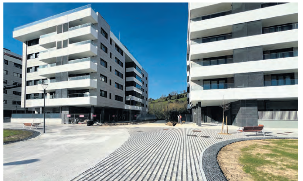
Aspecto que tendrían los nuevos edificios.

“La obra está programada para comenzar después de Semana Santa, con una fecha de inicio estimada para el 2 de abril de 2024. Se prevé que los trabajos tengan una duración aproximada de tres semanas, representando una inversión municipal de 26.000 euros”, agregaban.