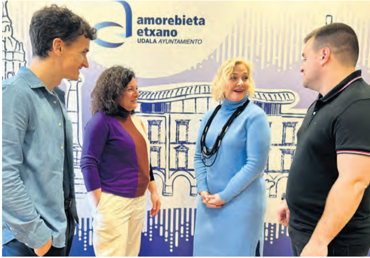
Presentación del encuentro.

Tras ella, se adentrará en diferentes dinámicas diseñadas para conseguir los objetivos y finalizará con actividad posterior a la comida. "En ella analizaremos cómo ayudarnos, cómo organizar conjuntamente las iniciativas, las necesidades de los colectivos culturales, los miedos, cada asociación, la plataforma abierta... Este será el punto de partida para definir la futura cultura popular que deseamos construir, como colectivos que forman parte de la red cultural zornotzarra", añade.