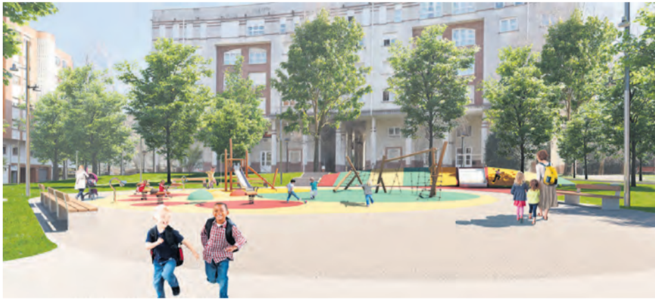
Las obras ya se han sacado a licitación.