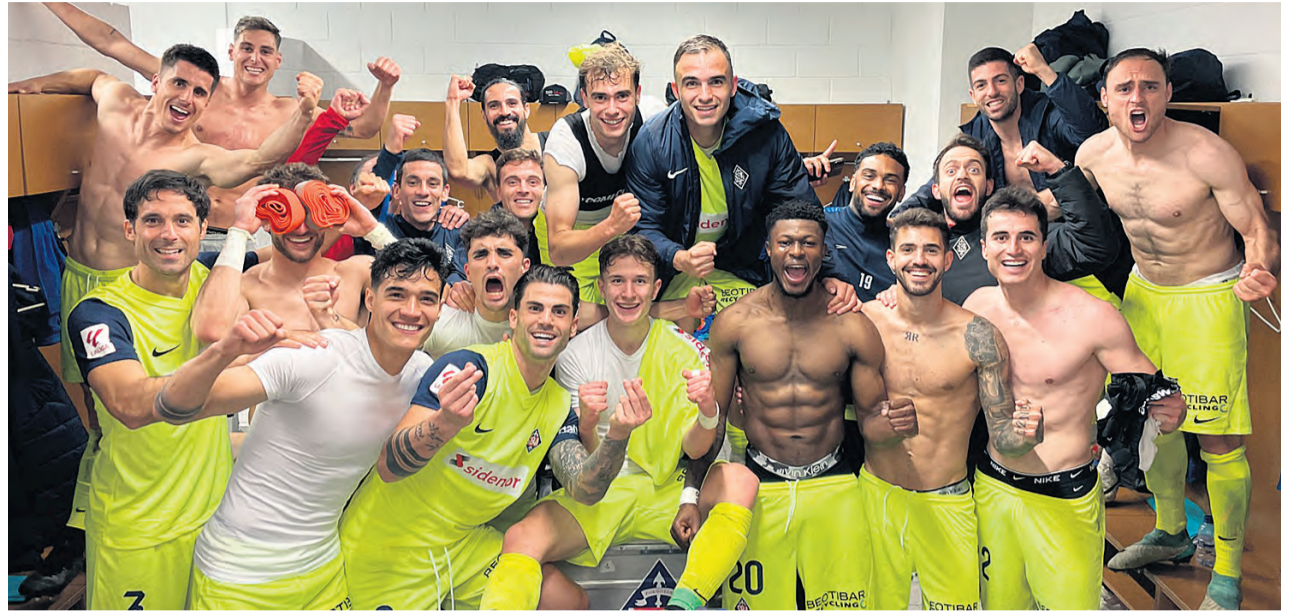
□ Alegría en el vestuario tras la victoria en Andorra el lunes 18 de marzo.