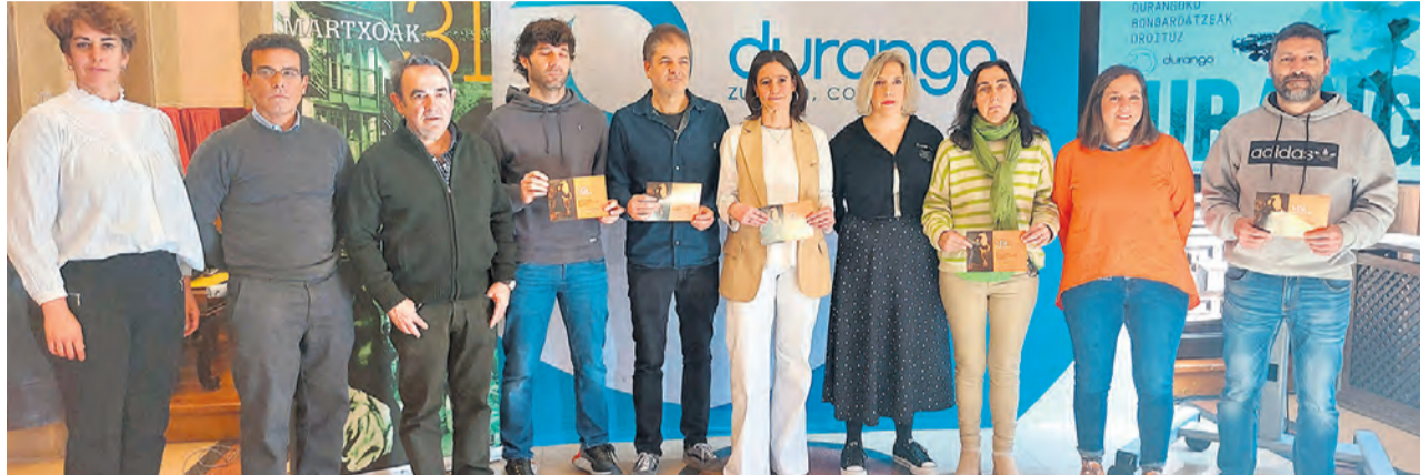
Presentación de los actos del bombardeo.