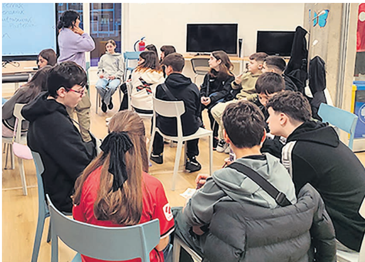
□ Una actividad en Zirt Zart.

Alrededor de 300 metros cuadrados suma el nuevo espacio que cuenta con dos plantas y patio. Ofrece atención directa e información a jóvenes y organiza programas y actividades culturales y lúdicas. Zirt Zart dispone de una Bazkide Txartela gratuita para jóvenes de entre 12 a 35 años empadronados con la que disfrutar, entre otras ventajas, de descuentos y prioridad en los