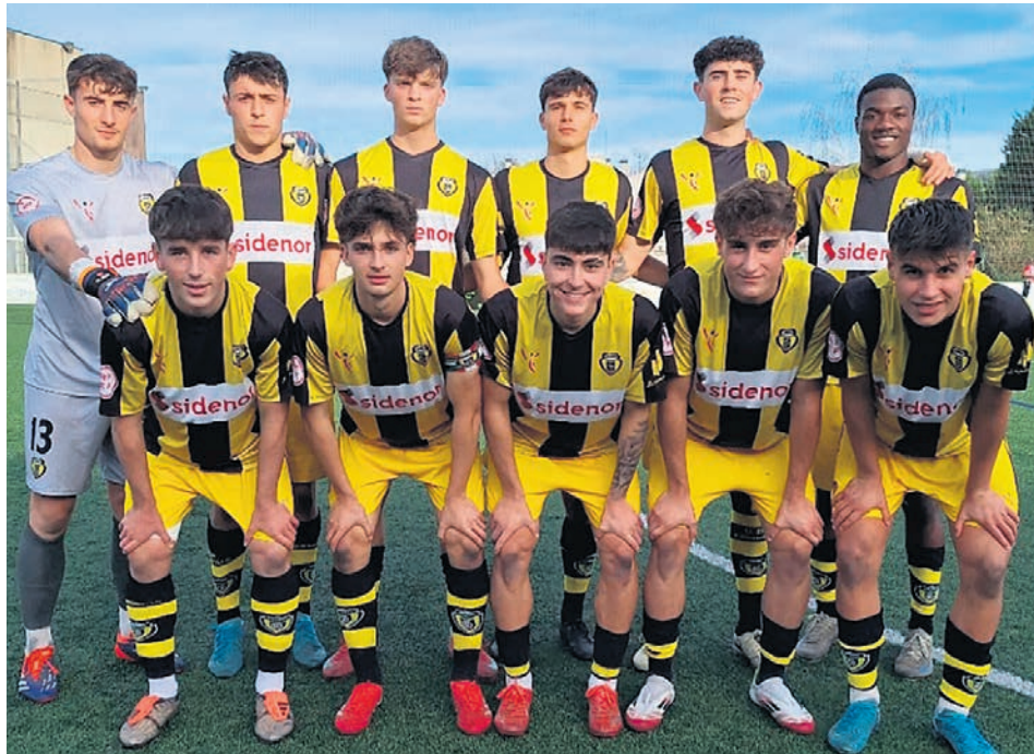
Los titulares del CD Basconia en su último partido frente al Padura.

Además de los puntos obtenidos, los registros goleadores del conjunto basauritarra en este mes