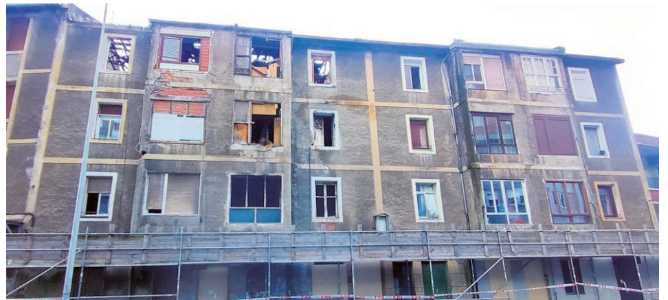
Estado actual del edificio incendiado.

Los responsables municipales han contratado a una empresa de gestión de crisis y acompañamiento social, cuyo personal atenderá miércoles por la mañana y jueves por la tarde en el ayuntamiento, "durante el plazo e intensidad necesaria para ayudarles a superar esta situación de urgencia", explicaban. Los primeros días han otorgado atención a las personas afectadas en el hotel en el que se alojan. La mayor parte se encuentra en el Ibis de Basurto, donde podrán permanecer hasta el 6 de marzo. El Consistorio está ofreciendo 2.600 euros a cada unidad familiar para ayudarles en el traslado a otros alojamientos, porque conceder pisos de alquiler so-