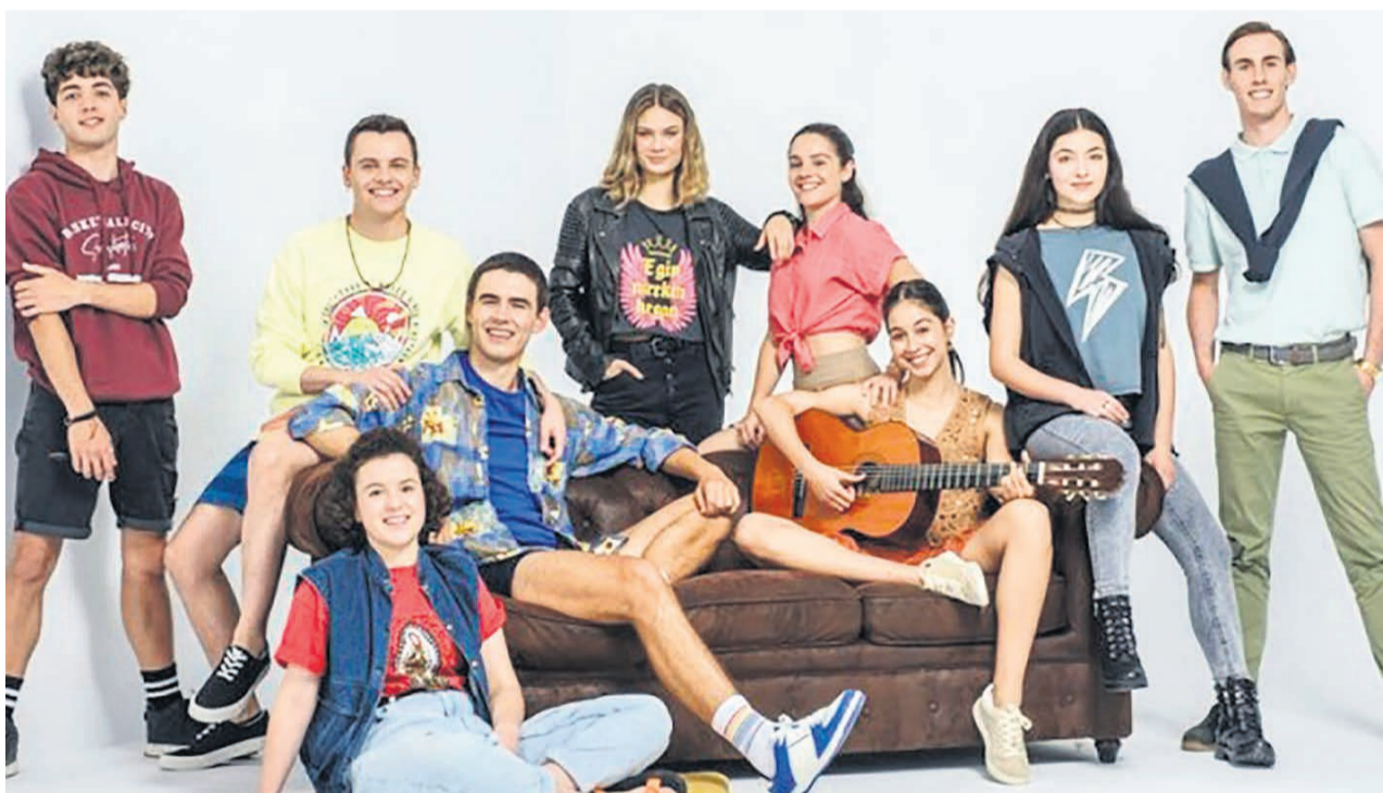
□ 'Go!azen 11' llega al Social Antzokia.