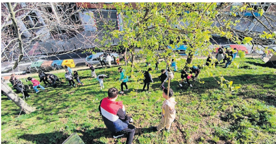
Un momento de la plantación.

Tirada de esta edición: 18.000 ejemplares (buzoneados en Basauri)