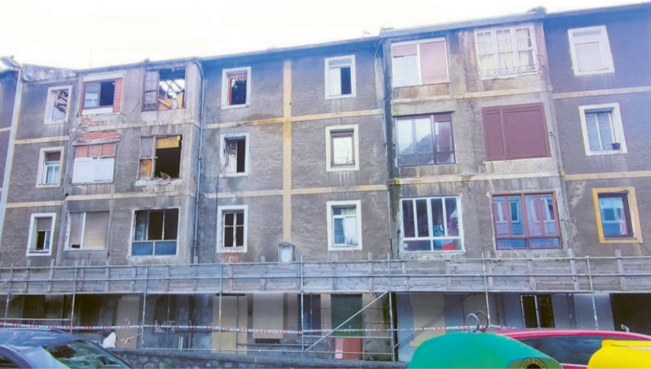
Estado del edificio incendiado.