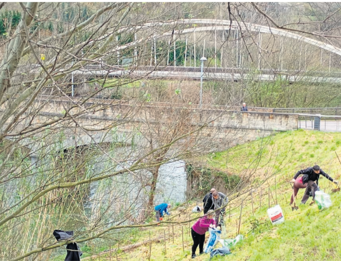
□ Un momento de la jornada a favor del medio ambiente.

El grupo el ecologista comentó que valoran la labor realizada respecto a la eliminación de las invasoras, en concreto de la ‘fallopia japónica’.