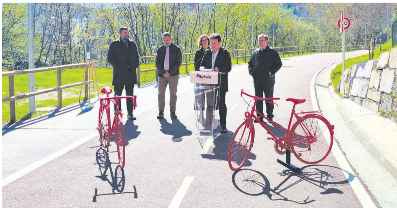
Presentación de la nueva bicipista.

En el caso del tramo Basauri-Bolueta, el estudio hace sus previsiones de tránsito sobre dos escenarios. El primero, a medio plazo, en 2029, fecha en la que prevé un arco máximo de ocupación diaria en días laborables de 2.100 ciclistas y peatones. El segundo, en 2035, con previsión en esa misma franja diaria hasta los 6.400 transitos.