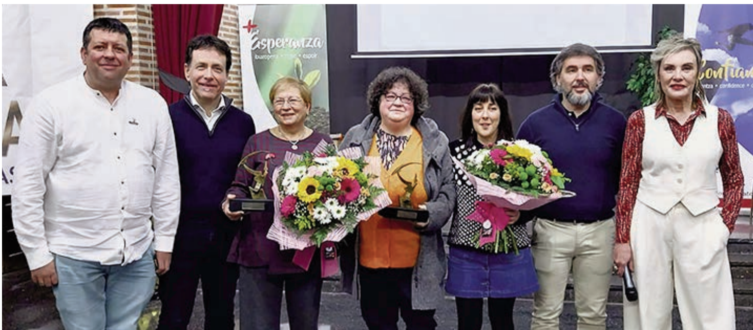
□ Premiadados, miembros de la Asociación de Antiguos Alumnos de San José y autoridades durante la entrega de los Premios Ixatxak.

La exposición ha tomado forma y este año 2025, en colaboración con el alumnado de Artes Gráficas del CIPEB, se han podido diseñar los soportes para las fotografías además del sosten narrativo de esta exposición. Todo ello es fruto de las reflexiones e ideas compartidas con el alumnado a través de una serie de talleres formativos en los que se ha profundizado en conceptos como los estereotipos, los rumores y los prejuicios como obstáculos para la convivencia intercultural.