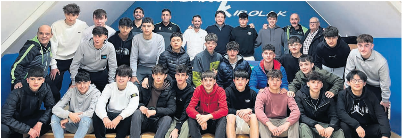
□ Presentación de la Selección Cadete de Basauri.