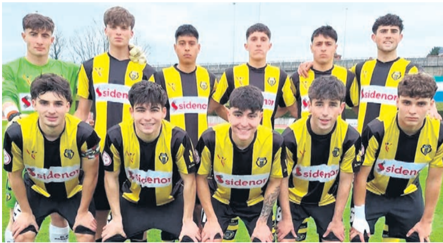
□ Alineación del Basconia en su partido contra el Santurtzi.

FÚTBOL. Está temporada 24-25 está siendo un sueño del que uno no quiere despertarse para los equipos regionales del Basconia. Y es que aunque ambos conjuntos hayan puesto final a sus largas rachas de victorias consecutivas tras empatar el pasado fin de semana, siguen líderes en sus respectivas categorías. El primer equipo que milita en Tercera Federación, tras 7 goleadas consecutivas parecía que seguiría haciendo lo propio, no obstante, el pasado 23 de marzo empató en Artunduaga contra un Santurtzi en racha que busca salir de la zona de descenso. Por su parte, el filial gualdinegro que milita en Preferente tampoco pasó del empate como local ante un Galea de la zona baja de la tabla, y ya son 3 semanas consecutivas en las que no logra vencer