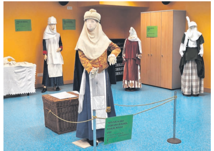
□ La muestra aguarda en Pozokoetxe.