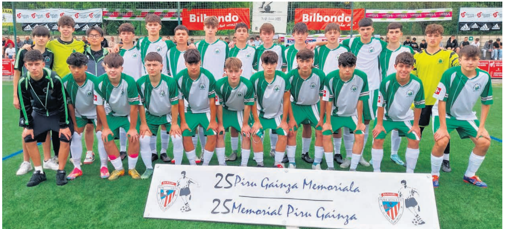
Los chavales de la Selección de Basauri.