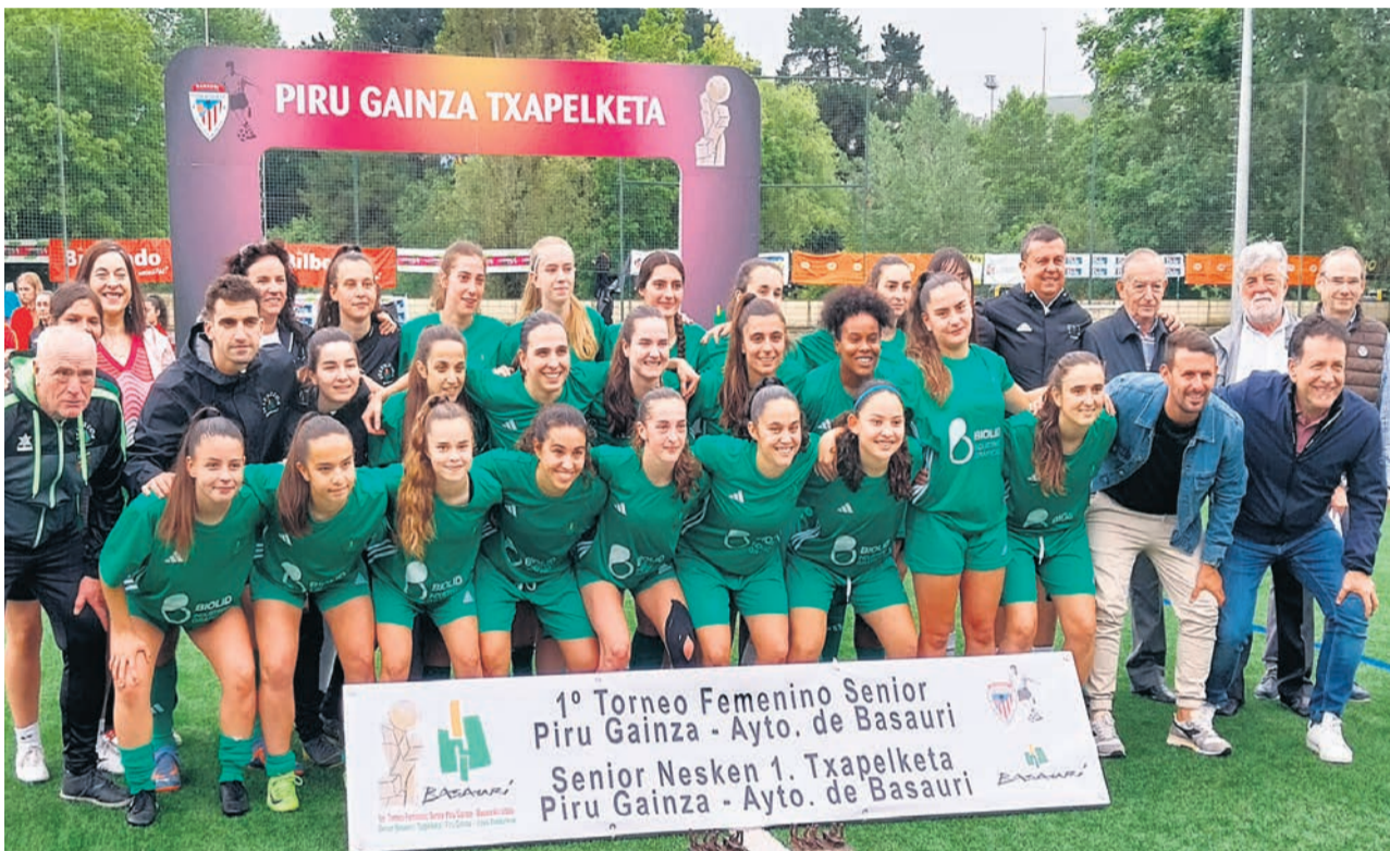
Las ganadoras de la Selección de Basauri posan tras el encuentro.