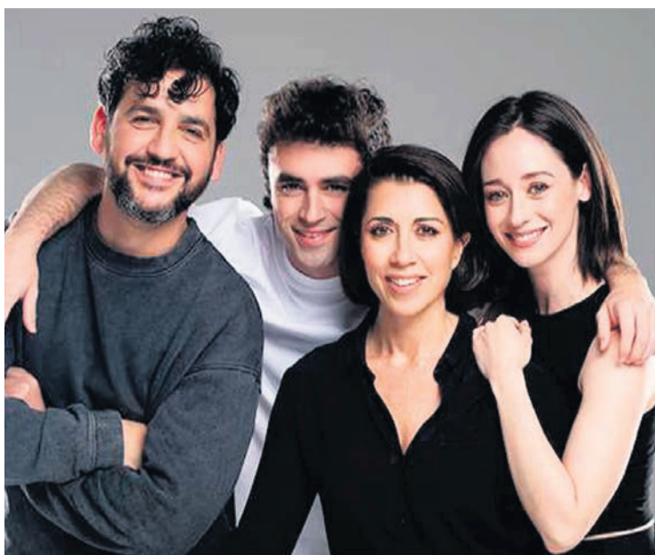
Los actores de "El efecto".

El Social acogerá conciertos en diferentes formatos. El 31 de octubre, llega "Halloween Gazte-Festa". El teatro se