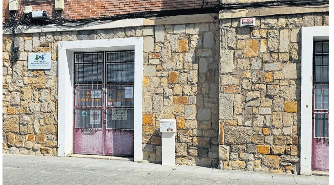
□ Buzón para votar en la plaza Hernán Cortés.

Tras la recogida de propuestas, el Ayuntamiento las valorará, concretará y ejecutará las actuaciones acordadas y, finalmente, buzoneará en los hogares un resumen con las acciones que se han llevado a cabo. En el proceso puede participar cualquier persona que tenga 16 años o más y esté empadronada en Basauri. Las propuestas se pueden presentar hasta el 22 de junio en los buzones instalados en los puntos identificados con el logotipo del proceso: Plaza Hernán Cortés, Ambulatorio, Finaga, parada de la lanzadera en Kebrantabarri y estación de Renfe. También podrán depositarse en las urnas ubica-