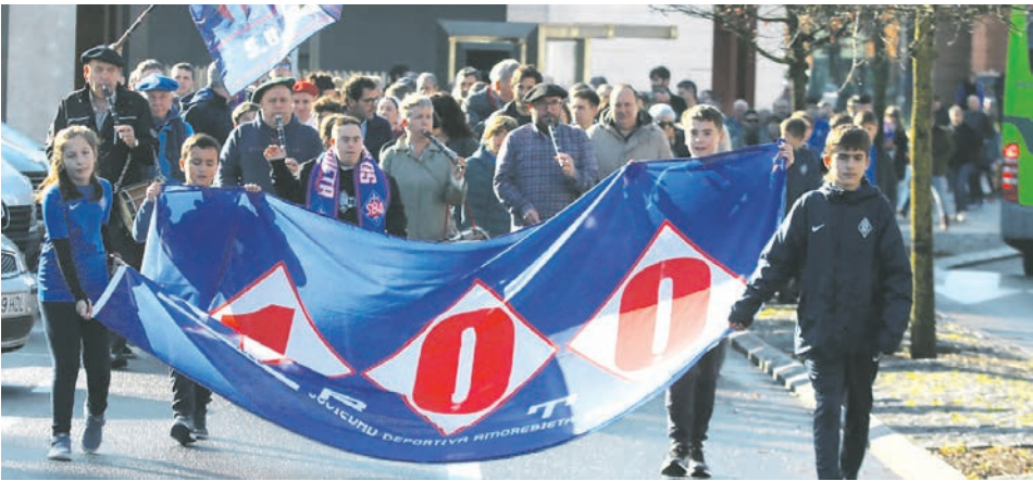
Kalejira que dio inicio a los actos del centenario azul en el mes de enero.