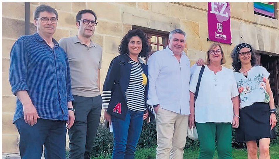
Integrantes del equipo de gobierno posan fuera del ayuntamiento.