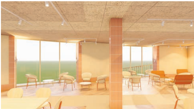
Infografía que muestra cómo quedará el espacio.