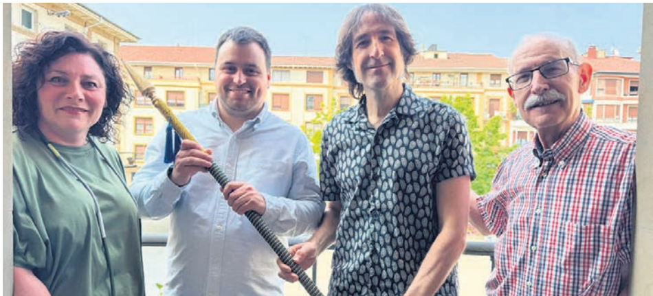
Momento del paso del testigo.