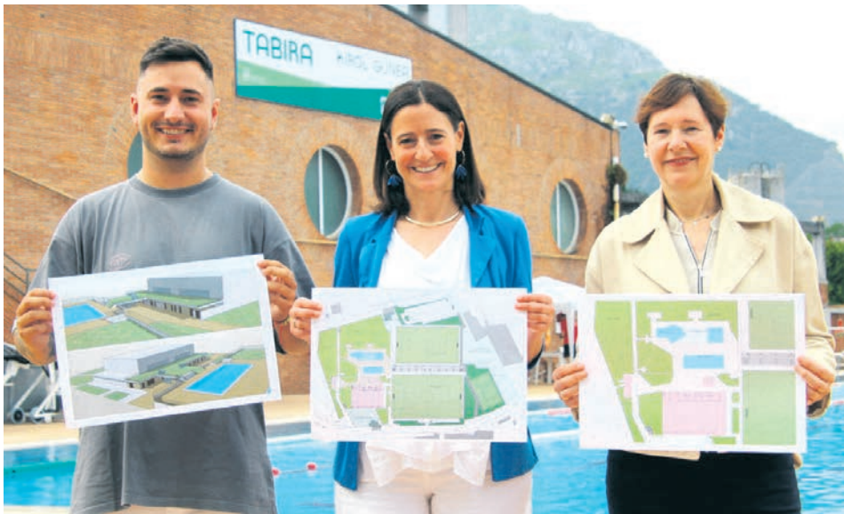
El proyecto Tabira Kirolgunea fue presentado en las piscinas.

Tirada de este número: 20.000 ejemplares buzzoneados en Durango, Iurreta, Abadiño y Amorebieta.