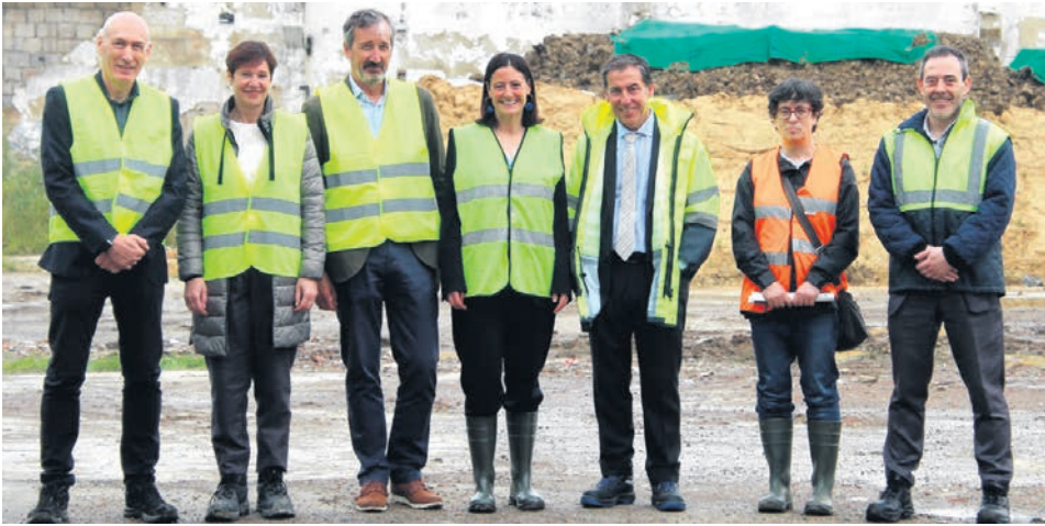
Representantes de las entidades implicadas en el proyecto en la visita a los trabajos.

Tras más de 15 años desde el cierre de la fundición, el municipio encara una nueva etapa transformadora. Lo que durante años fue un foco de degradación urbana, se está convirtiendo en un referente en descontaminación ambiental, gracias a la colaboración entre el Ayuntamiento de Durango y el Gobierno Vasco, con el apoyo de las entidades públicas Spilur e Ihobe. Representantes de de todas ellas visitaron hace unos