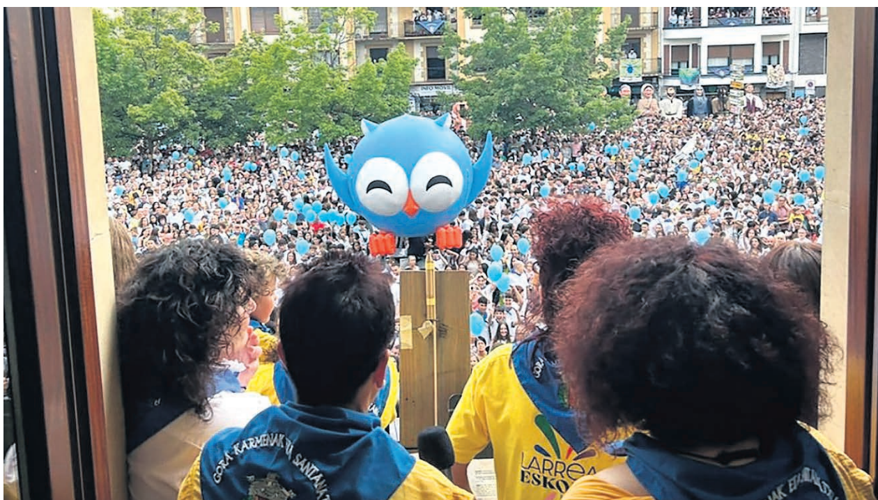
□ Imagen del txupinazo del pasado año.