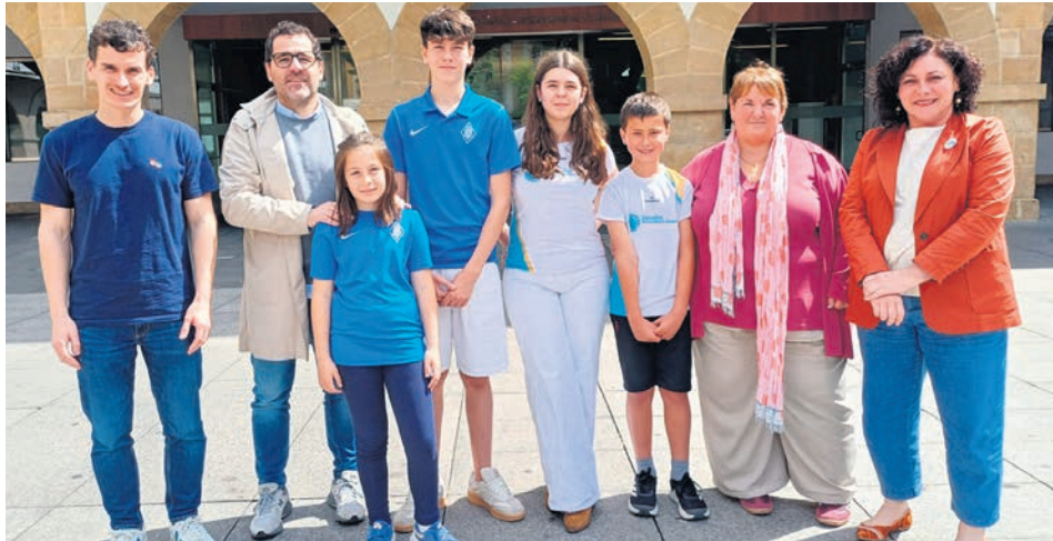
Representantes de ambas entidades y del Ayuntamiento posan en la plaza.

La decisión ha sido tomada por la Comisión de Fiestas como reconocimiento al papel fundamental que ambas entidades han tenido en la vida social y deportiva del municipio. El pregón servirá para homenajear la historia, el compromiso y la dedicación.