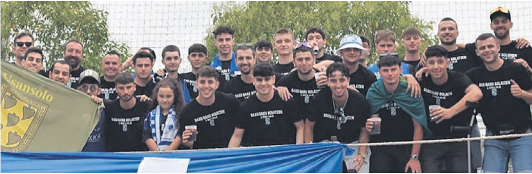
□ La plantilla del Umore Ona B celebra el ascenso.

Lo que podría haber sido un ascenso tranquilo al encabezar la tabla gran parte de la temporada, no lo fue para el filial del Umore Ona quien logró certificar el ascenso a Segunda Territorial, no