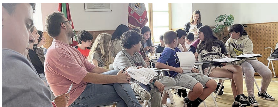
Un momento del encuentro.