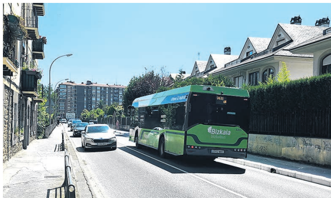
Imagen actual de la zona.

de noche. Además, se soterrará el cableado aéreo, mejorando la seguridad y contribuyendo a un paisaje más ordenado. Y renovarán tuberías de la red de agua.