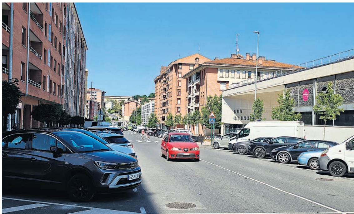
El aparcamiento es el problema que más preocupa a la ciudadanía.

La falta de aparcamiento es la principal problema de la localidad, con un