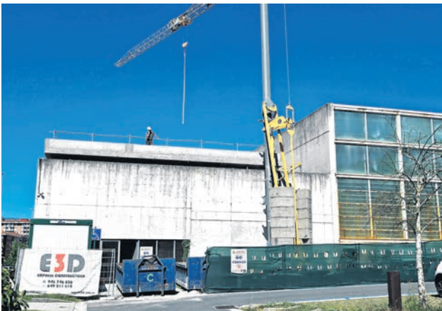
Obras en el polideportivo.

La ampliación y renovación del polideportivo de Urreta sigue. Se aprovechará el parón de verano para llevar a cabo labores de mantenimiento y limpieza, y avanzar en las actuaciones. La instalación cerrará hasta el 31 de agosto. En noviembre comenzó la segunda fase de las obras, con duración estimada de entre 12 y 18 meses. Los próximos dos meses se ampliará la zona del solárium con dos plantas nuevas, se renovará la zona de recepción al público, se hará una rampa de acceso para suprimir las barreras arquitectónicas y renovarán conexiones y cuadros eléctricos, entre otras actuaciones. “La intervención se está haciendo por fases, con el fin de minimizar la afección a las personas usuarias. La afluencia de público se reduce durante el periodo estival,