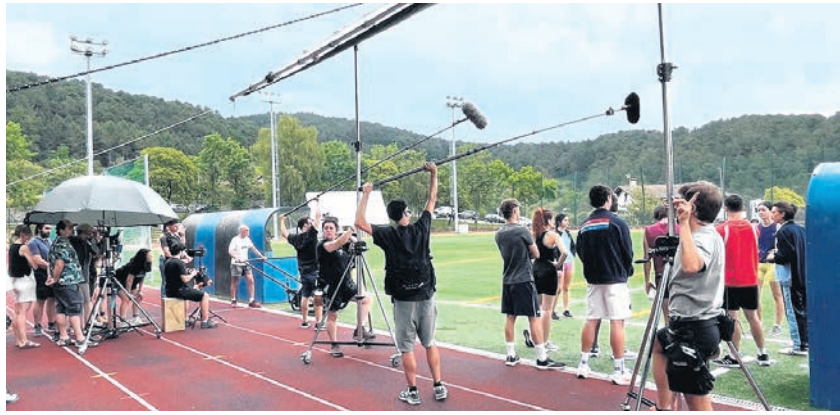
□ Un mometo del rodaje.