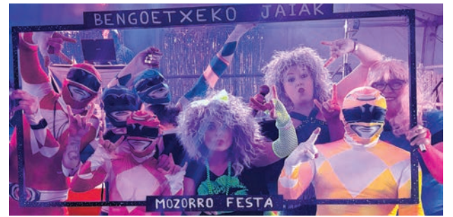
□ Disfraces durante unas fiestas pasadas.

una vorágine de acontecimientos inesperados. La historia refleja las relaciones entre los jóvenes, quienes se podrán sentir identificados e identificadas en las escenas de la serie.