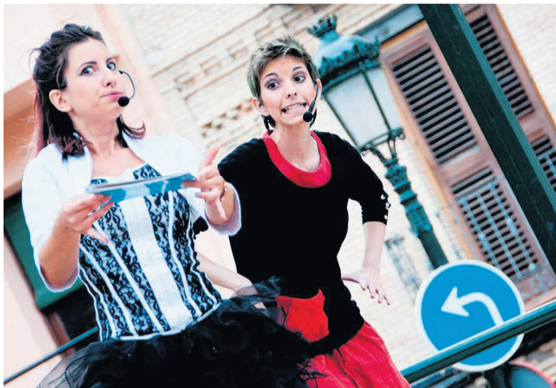
□ Actuación de Niñas del mago.

Gracias a estos descubrimos las sociedades mágicas, una de ellas ubicada en Barcelona, locales donde se reúnen los magos para charlar, con biblioteca de libros de ilusionismo avanzado y donde semanalmente se dan clases para mejorar. A partir de ahí, empezó nuestra formación asistiendo a congresos, festivales y conferencias... nos vamos empapando de cada uno, buscando lo que nos gustaba y lo que no, hasta encontrar nuestra forma de hacer.