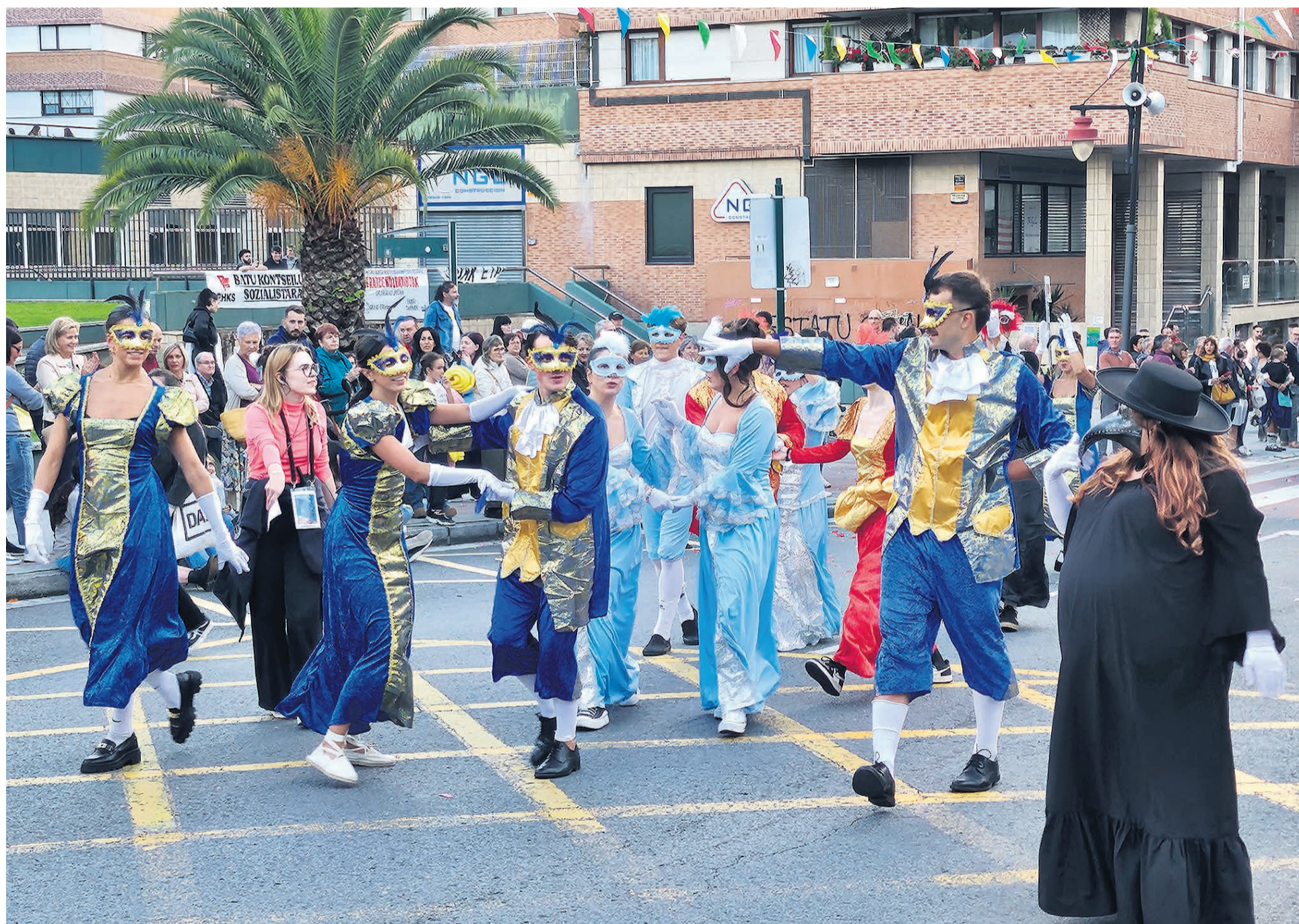
□ ¡Vuelven los Santakurtzak! Comienza la mascarada porque... ¡estamos de fiesta!