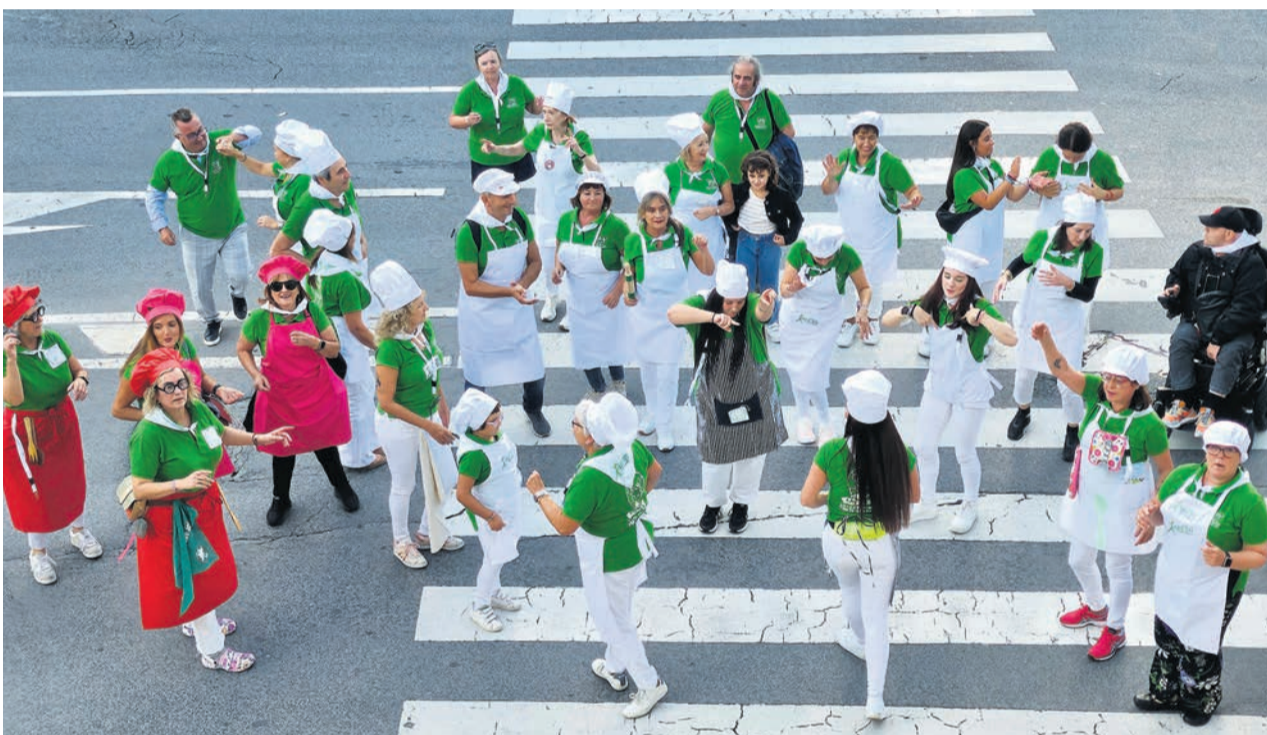
Ya se cocinan las fiestas de Santa Cruz.