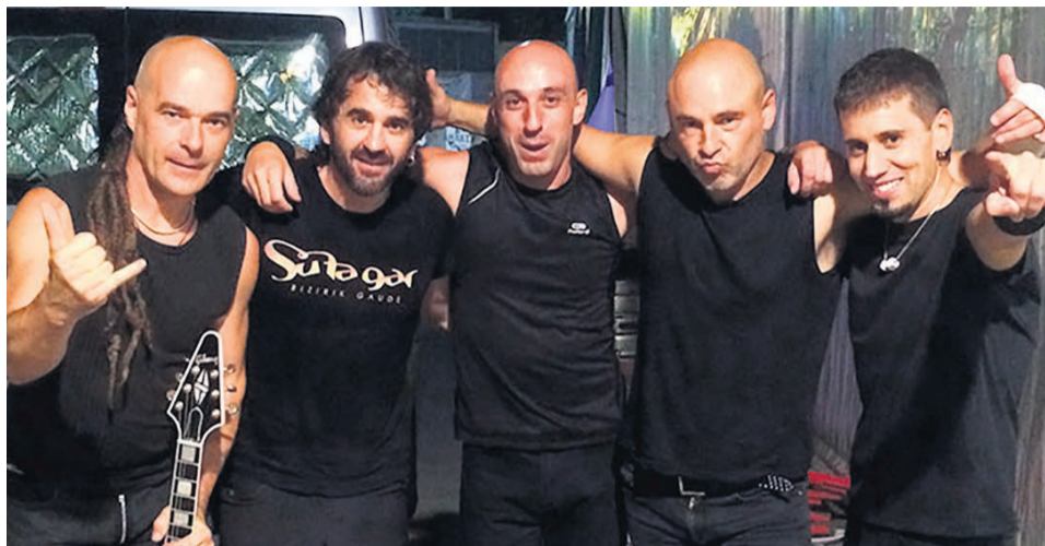
Integrandes de Su Ta Gar.