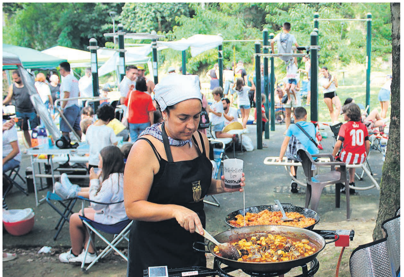
Los concursos gastronómicos son una apuesta segura.

GBGE, Galdakao Bizkaia Gizarte Elkartea, aportar'ca su grano de arena en fiestas. "Desarrollaremos todas las actividades en las txosnas de arriba", explicaban. Como cada año, colocarán la 'Txosna para todas', punto de encuentro con servicio de barra donde habrá barbacoa los jueves, viernes y sábados, con bocadillos de entrecot a la brasa preparados al momento, acompañados de pan calentito. Además, ofrecerá Taller infantil de txapas el martes 16, a las 17:00 horas en el mismo lugar, una actividad creativa dirigida a los peques de la casa para diseñar y llevarse su propia txapa. Y el miércoles 17, a las 17:00, habrá Taller de calcomanías, propuesta lúdica para niños y familias, con calcomanías seguras y temáticas festivas.