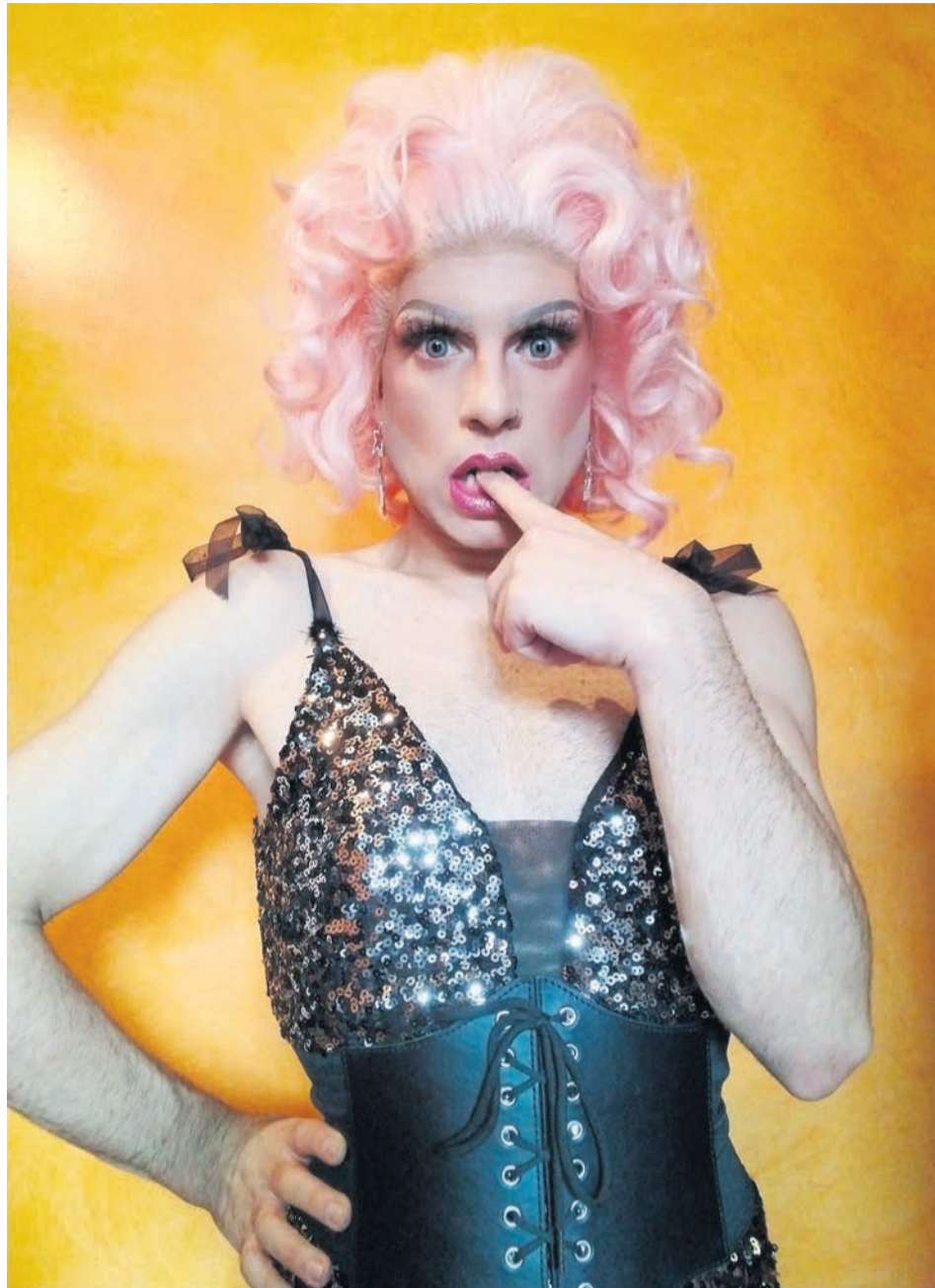
El Chico Diva.

Empecé muy suave. Una peluca por aquí, un poquito de pintalabios por allá... lo justo para salir con las amigas y que no me confundieran con una drag a medio cargar o un experimento de maquillaje de YouTube versión 2010. Poco a poco fui integrando cositas: delineas-