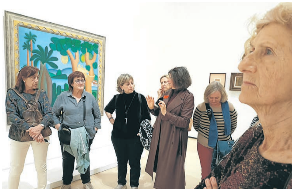
Visita cultural organizada por el curso de Arte.