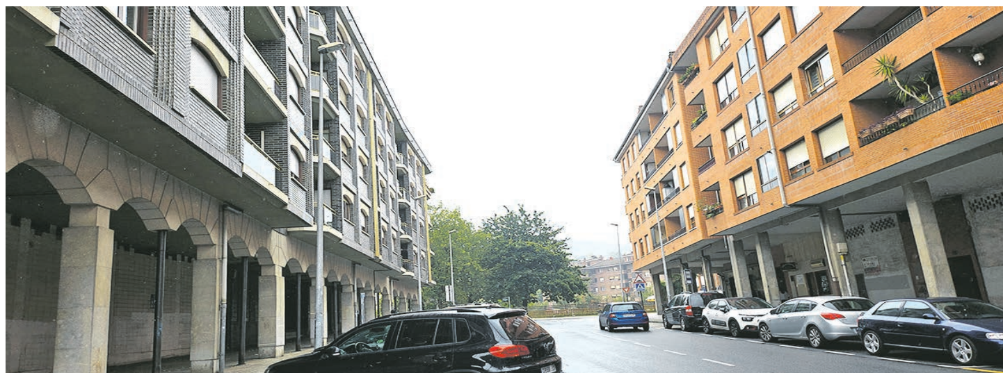
La oferta de alquiler no es sencilla en Galdakao.

También, ser titular del contrato de alquiler, ya sea de forma individual o como unidad convivencial. El contrato debe ser de una vivienda libre, tener una duración mínima de 12 meses, y el