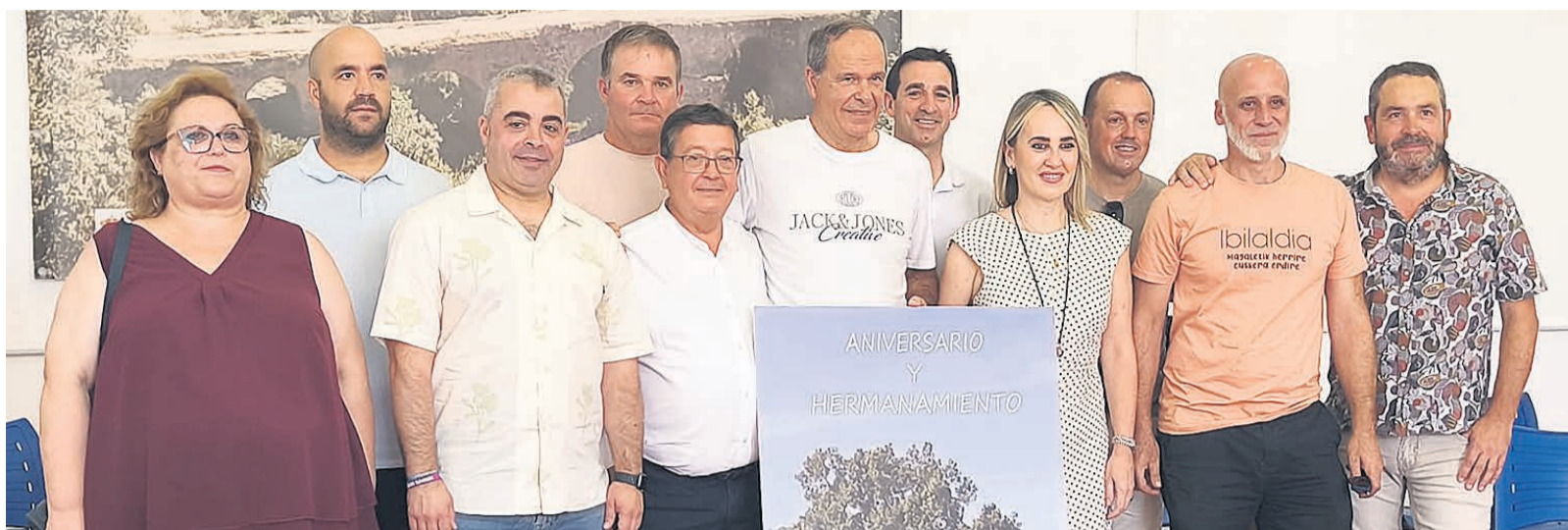
Representantes de Galdakao y Usansolo en Extremadura.

La visita respondía a la recepción institucional que tuvo lugar hace casi un año en Galdakao, con motivo del 25º aniversario del hermanamiento entre las dos localidades. Aquella ocasión sirvió para volver a recordar y poner en valor la estrecha relación cultural y social que nació hace más de 70 años, cuando cerca de un millar de personas migró desde Valencia de las Torres hacia Galdakao y Usansolo.