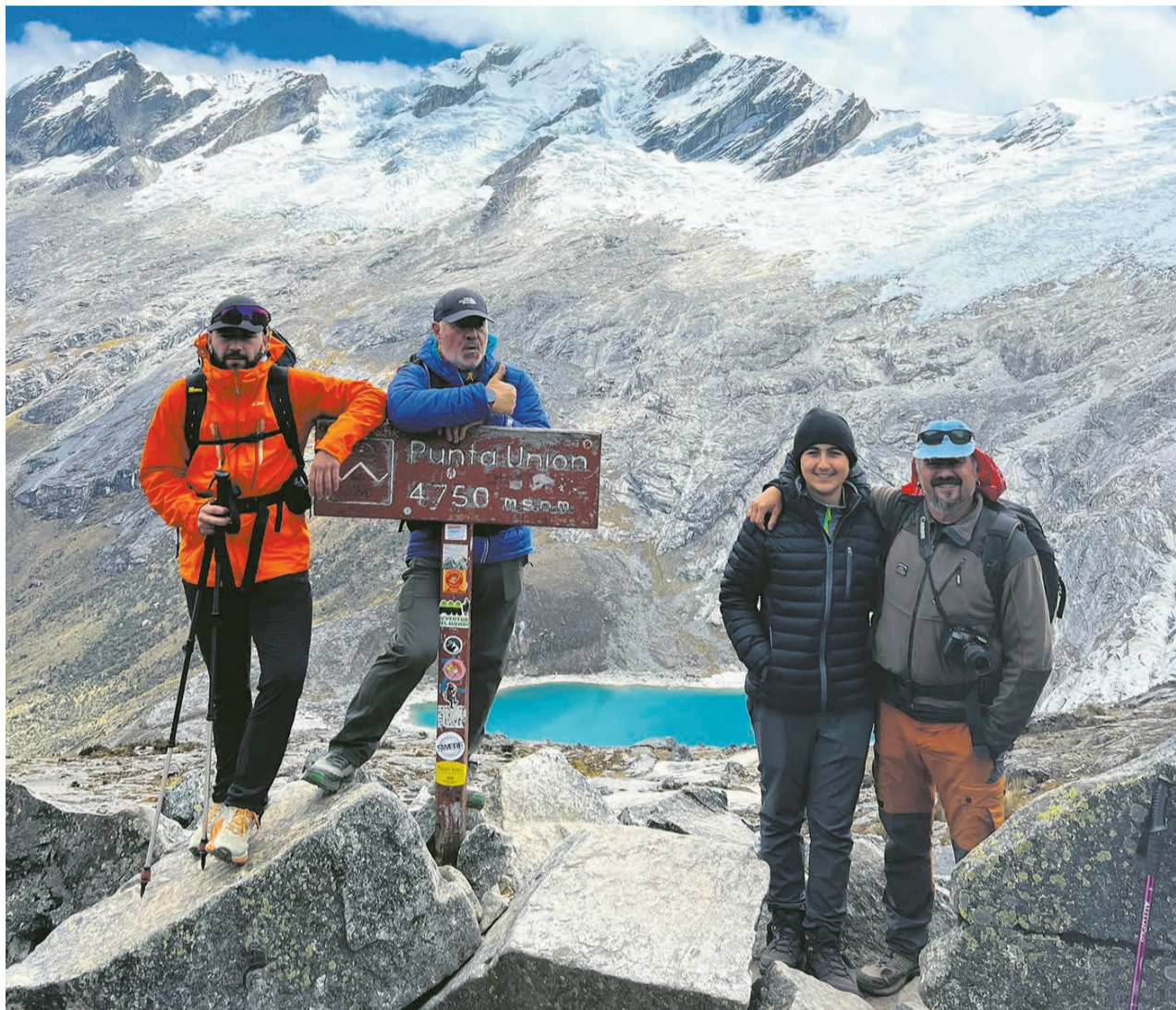
□ Los montañeros en Perú.