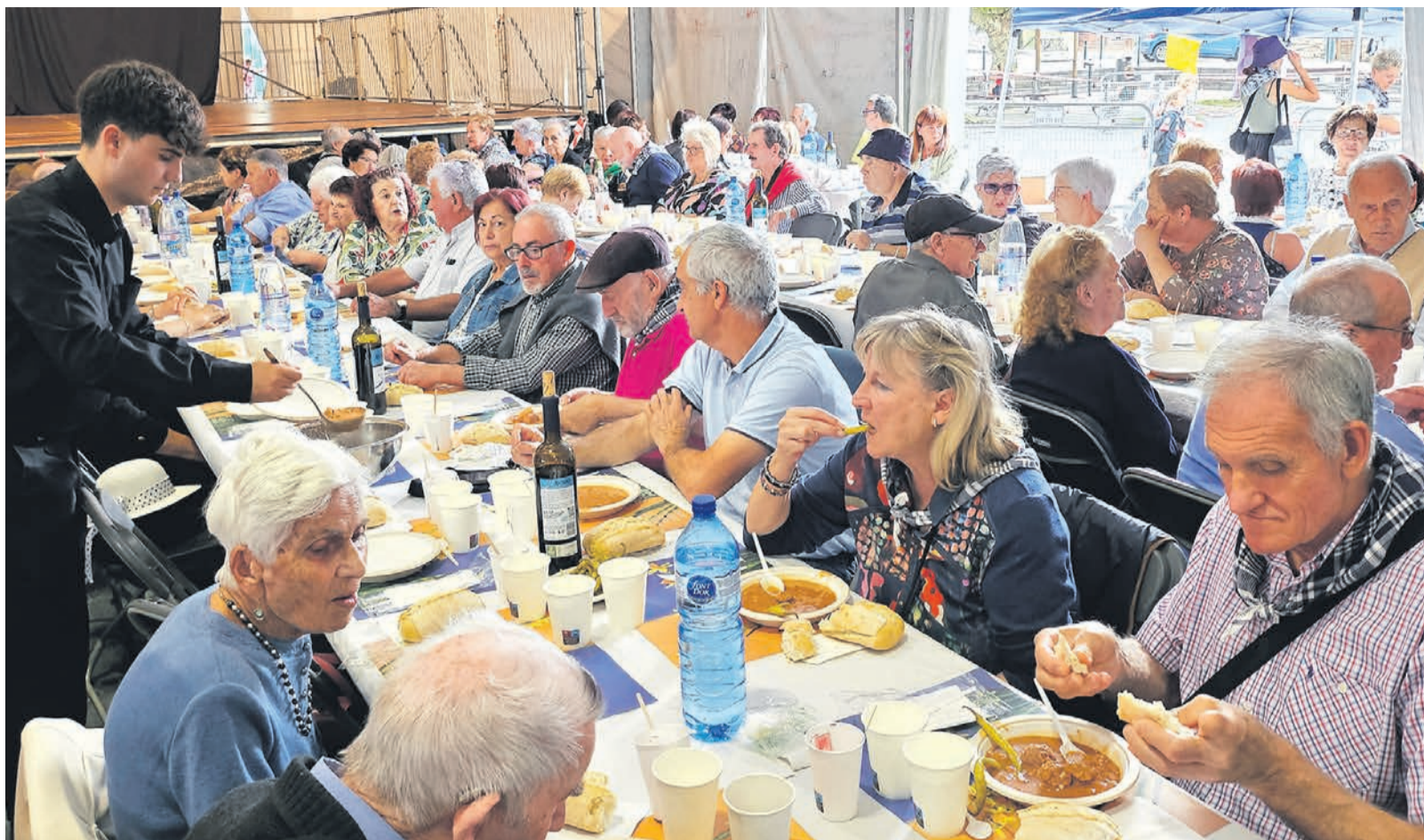
Una comida anterior para las personas mayores durante las fiestas.

Por otra parte, una jornada después, el miércoles día 17, en el mismo lugar, se preparará, para las 14:00 horas, la Comida Popular y Fiesta de las Personas Mayores, donde podrán disfru-