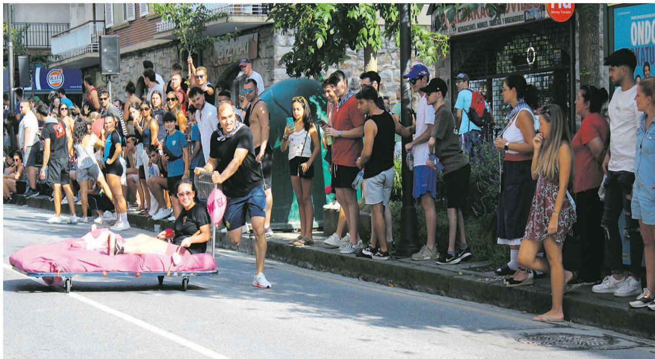
□ La carrera de camas siempre es divertida.