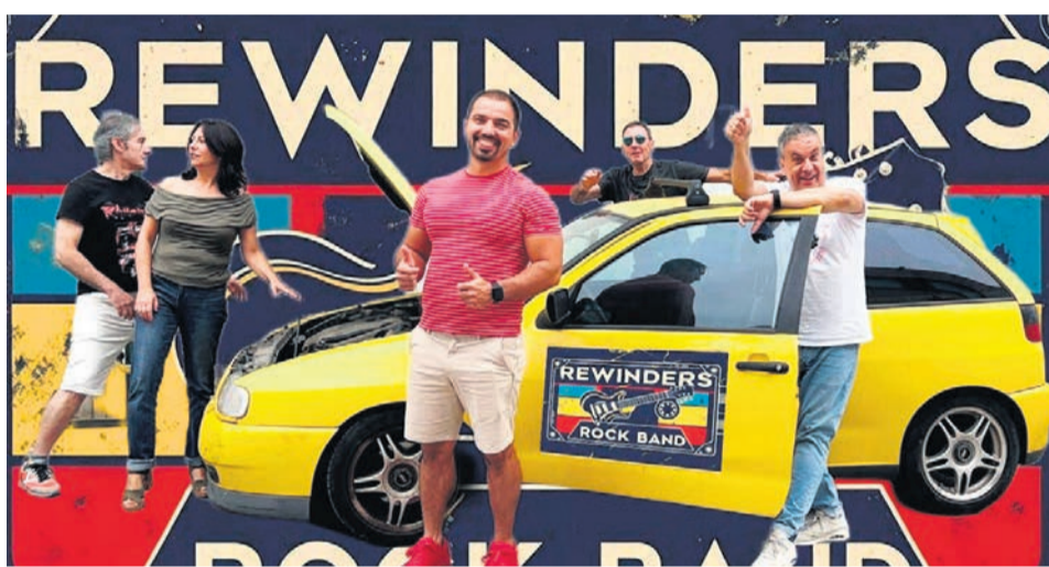
Rewinder Rock Band.