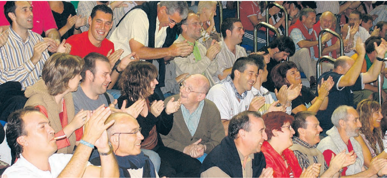
▣ Público en un partido de pelota hace años.