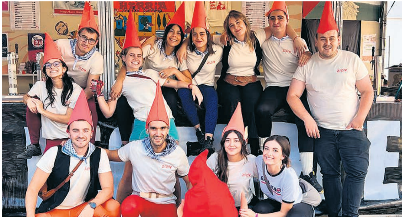
□ Miembros de la cuadrilla Zizpa.