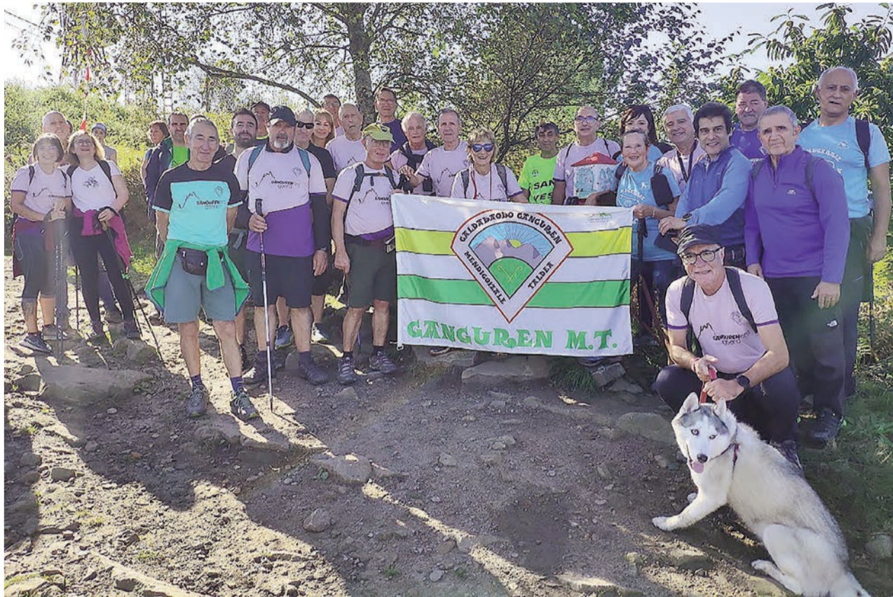
Algunos participantes el pasado año.