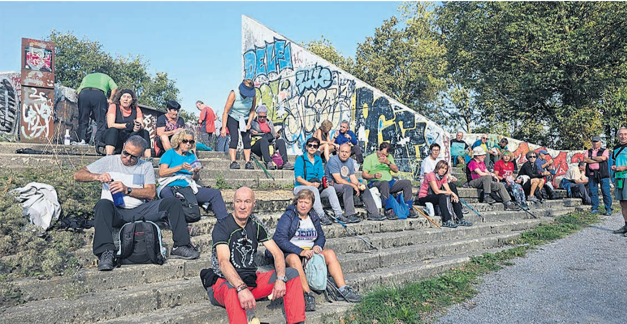
□ Momento de descanso durante una salida anterior.