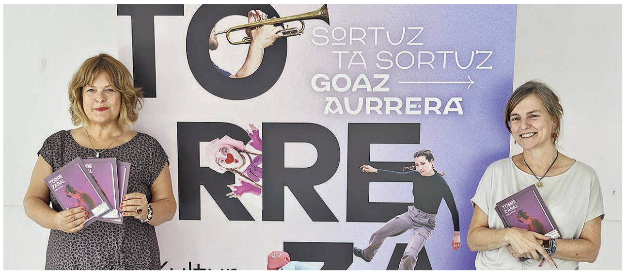
Presentación de la nueva programación de Torrezabal.

La convocatoria es permanente, por lo que las solicitudes podrán presentarse en cualquier momento a lo largo del año. Estas se irán resolviendo según el orden de presentación hasta agotar el presupuesto de 25.000 euros que se ha destinado al proyecto para este año.