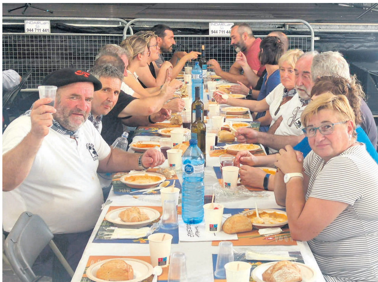
Los asistentes a la comida brindarán por el buen ambiente.