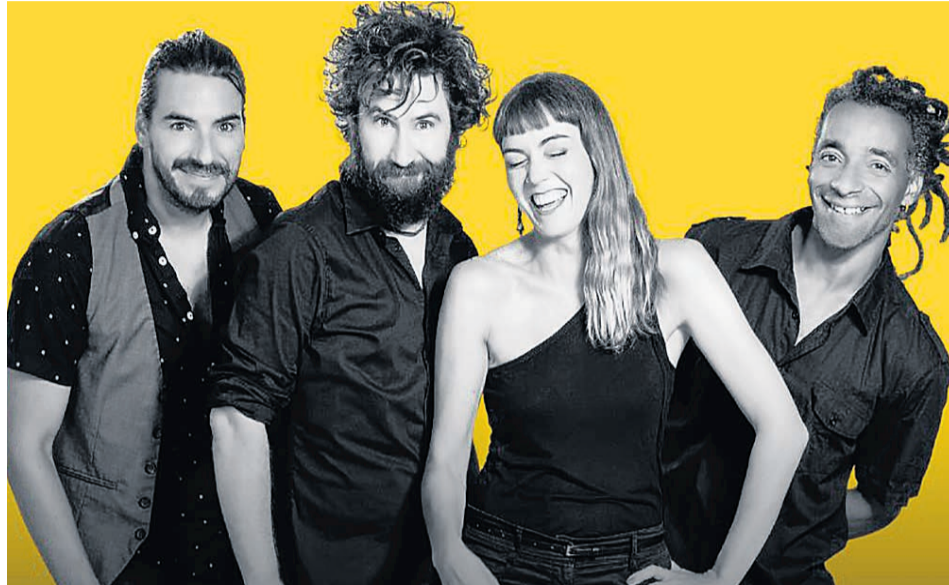
□ Los integrantes de Demode Quartet.

No tenemos, en general, ningún referente de ningún grupo a capela, porque nosotros no buscamos lo que normalmente se busca en ellos, que la canción suene como es y las voces hagan de “instrumentos” y hacerlo sonar lo más fiel. Lo que nos gusta es hacer versiones muy nuestras, y generalmente cambiarles el estilo musical,