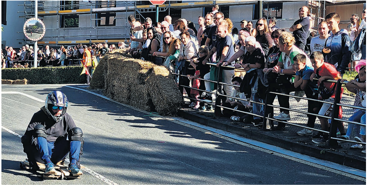
Carrea de goitibeheras durante las fiestas.

Los años trajeron la evolución, y aunque ahora los pequeños de la casa no juegan ya casi con la goitibehera, los adultos mantienen ese recuerdo del pasado gracias a estos campeonatos.