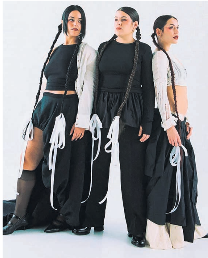
Las integrantes de Tanxugueiras.

Si hay fuerzas, nos tomaremos algo en fiestas. Siempre es bonito celebrar con la gente.