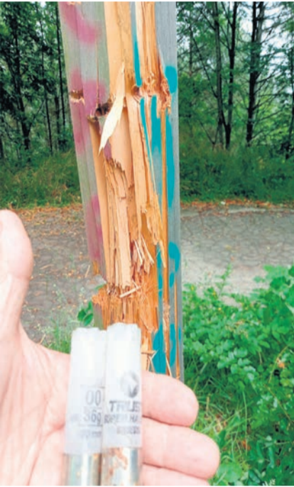
□ Estado en el que quedó una de las postas.

Desde Gaguren Mendi Taldea advierten del suceso "para que la gente sepa que si alguien se enorgullece de haberlo hecho, es una perso-