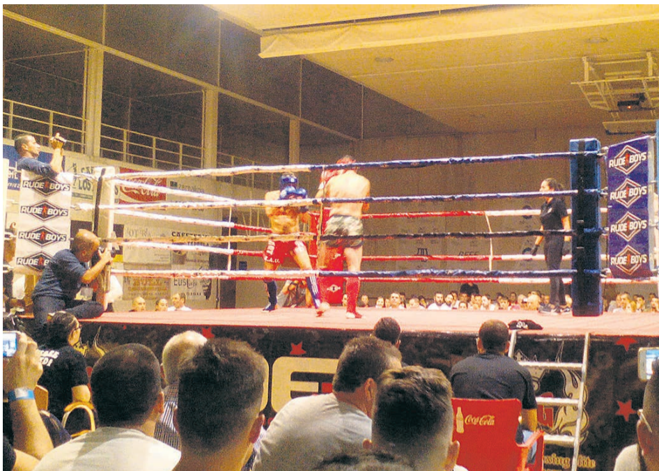
El deporte siempre aparece en el programa de fiestas.

Como cada año, el campeonato de cuadrillas irá por puntos, que se podrán obtener mediante la participación