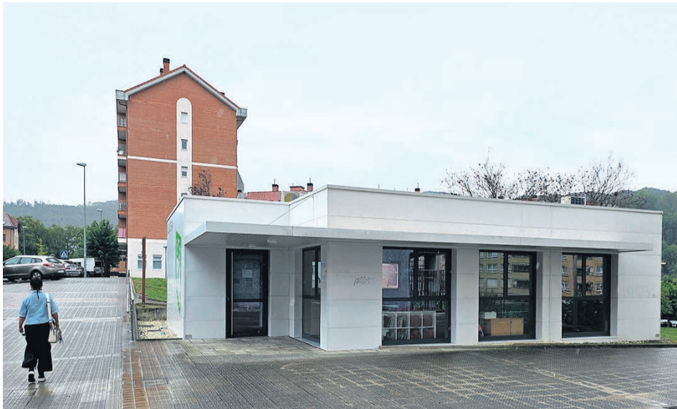
□ La ludoteca de Berezikotxe.