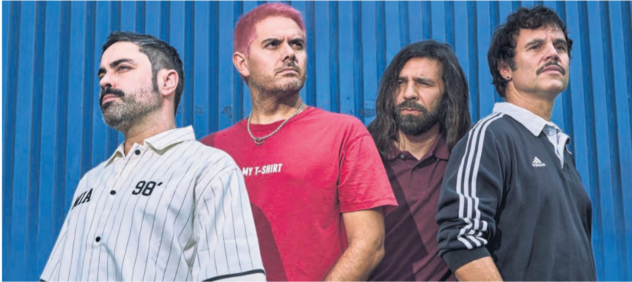
El grupo musical Despistaos actuará en Basauri.