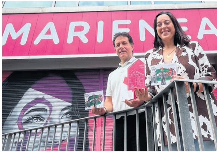
□ Presentación de la programación.

Habrà, además, taller para acompañar procesos de autoconocimiento a mujeres con discapacidad intelectual, los días 15 de enero, 19 de febrero y 19 de marzo, y una nueva sección denominada “Colectivizando saberes, aprendiendo juntas”, pensada para dar la oportunidad de presentar sus trabajos a mujeres, muchas jóvenes, aunque no solo, que realizan investigaciones interesantes desde