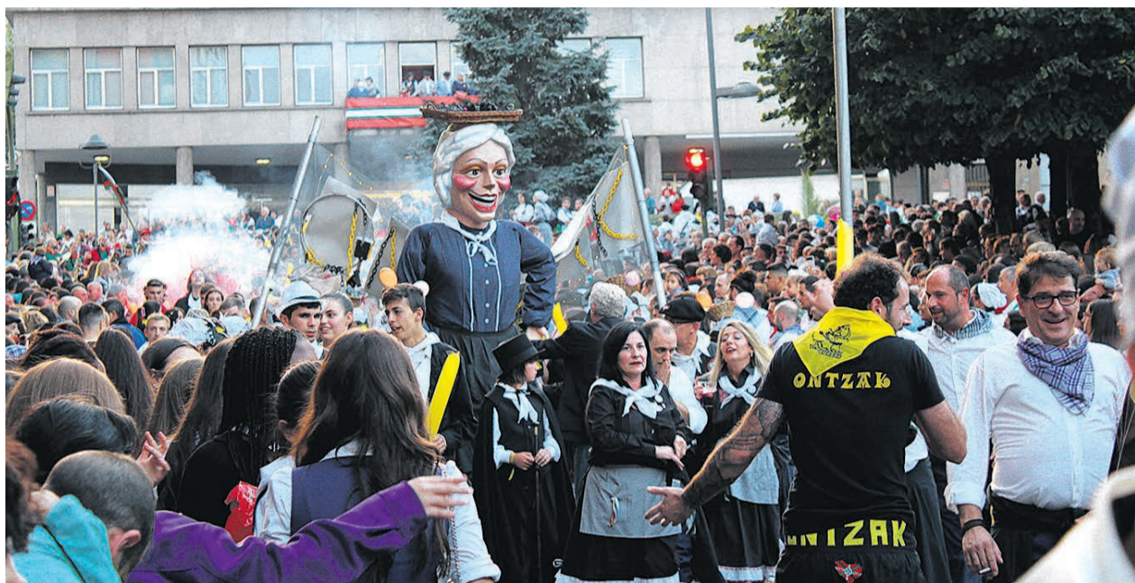
La bajada de cuadrillas con la Escarabillera marcará el primer día de fiestas.

Si no lograbas ver a la Escarabillera antes, a las 18:35 horas es su presentación. El saludo de alkates txikis, alcalde y Herriko Taldeak tendrá lugar a las 18:40, porque a las 18:55 sonará el pregón desde el consistorio. Público nervioso e impaciente aplaudirá el txupinazo de las 19:00 horas. “¡Aupa Basauri, viva San Fausto, que es nuestro