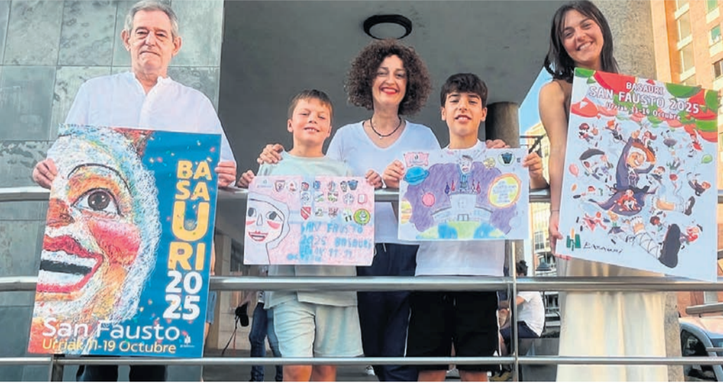
Los ganadores con sus carteles.

En cuando a categoría Txikiak, de 6 a 9 años, venció el alumno de Basozelai Gazte-