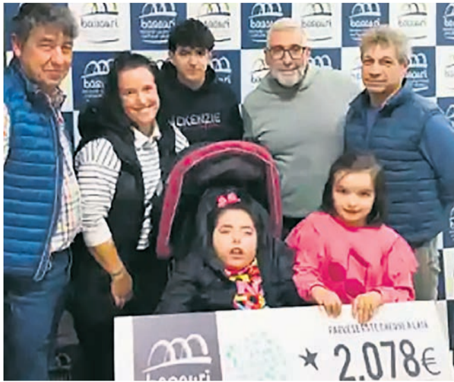
Entrega del cheque.