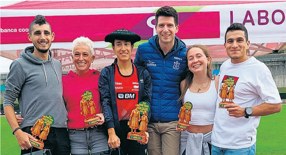
Podio de la Herri Krosa.

La entrega de premios corrió a cargo del alcalde, Asier Iragorri, y del concejal de Deportes, Jon Zugazagoitia, entre otras personalidades que se dieron cita en el encuentro de atletismo.