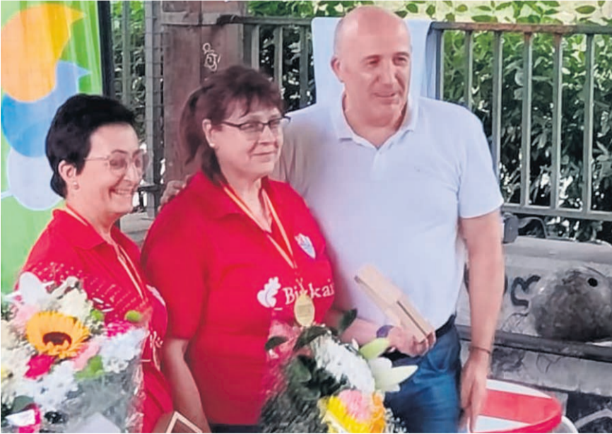
Las campeonas en el España por Parejas tras ganar.