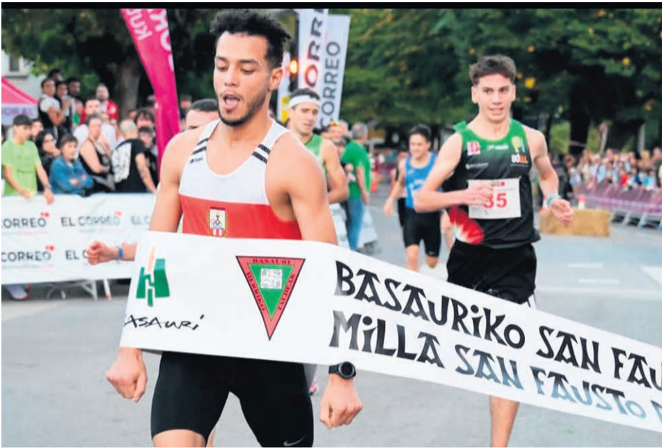
Un mometo de la prueba.