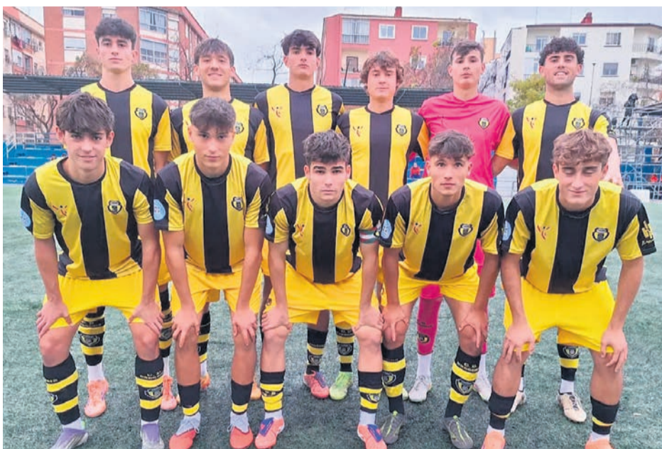
El once titular en el último partido del primer equipo del CD Basconia.

El balance de los resultados es elocuente. El filial rojiblanco ha cosechado una sola victoria, junto con 3 empates y 7 derrotas. Esta dinámica lo sitúa en posiciones de descenso, con la necesidad de revertir la tendencia. El estado de forma reciente