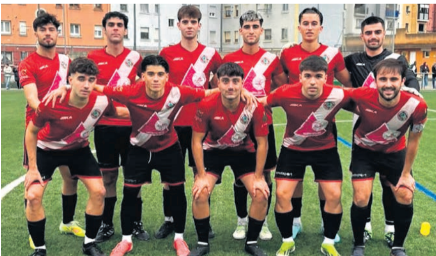
Equipo titular del Indartsu en su último encuentro.

Aún así, el fútbol, caprichoso y cíclico, les ofreció una oportunidad de reivindicación. El conjunto dirigido por Eñaut encadenó 3 triunfos consecutivos que no solo despejaron dudas, sino que les permitieron asomarse a la parte alta de la tabla. Fue entonces cuando la ilusión del