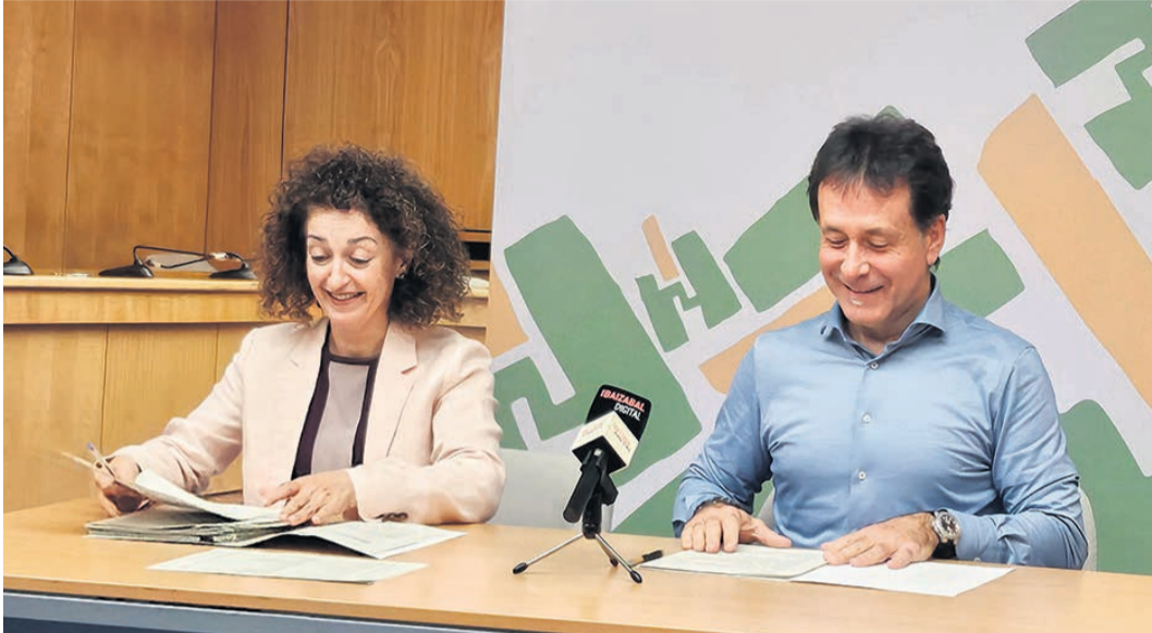
Presentación del proyecto de presupuestos.

El equipo de gobierno del Ayuntamiento de Basauri (EAJ-PNV y PSE) presentó el 5 de noviembre en comisión al resto de partidos políticos su propuesta de presupuesto para 2026, cuentas que se elevan un 4,6% respecto a las de 2025 hasta alcanzar los 68,8 millones de euros. El resto de fuerzas políticas tei-