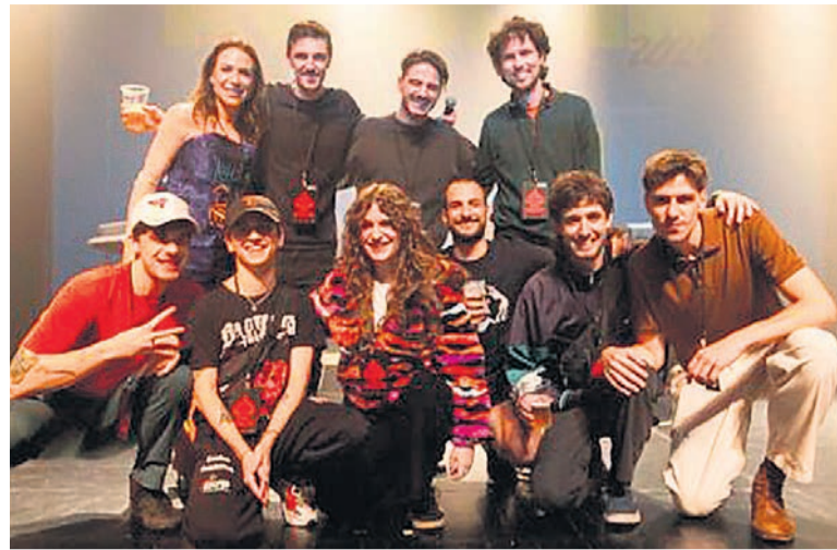
La banda Reeler ganó el Rockein.