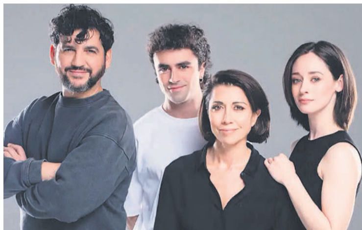
□ Protagonistas de 'El efecto'.