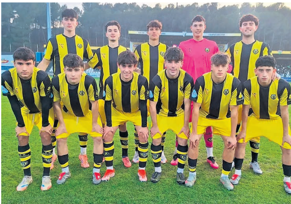
□ Alineación del CD Basconia en su último encuentro liguero frente al Tudelano.

Si bien hablábamos de que la dinámica del conjunto dirigido por Llopis era preocupante al no haber logrado vencer desde que lo hiciera el pasado 26 de octubre, la situación ha cambiado tras haber cosechado una importante e inesperada victoria a domicilio el pasado 14 de diciembre frente a uno de los equipos punteros de la categoría como el Tu-