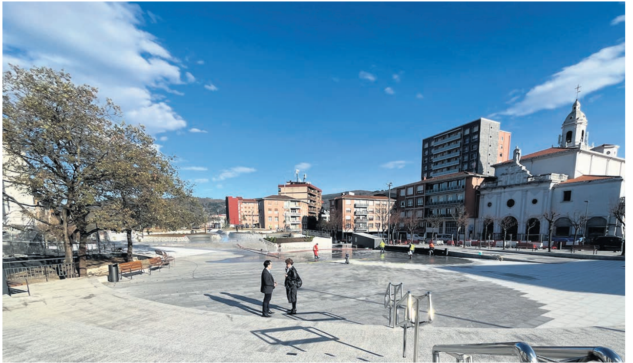
Los ganadores en la foto de familia.