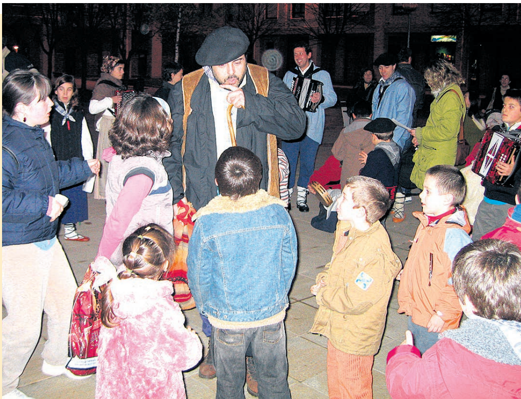
Olentzero nunca ha fallado a los niños de Basauri.

• Arizgoiti plaza. 11:00-13:00 h. 31 diciembre.