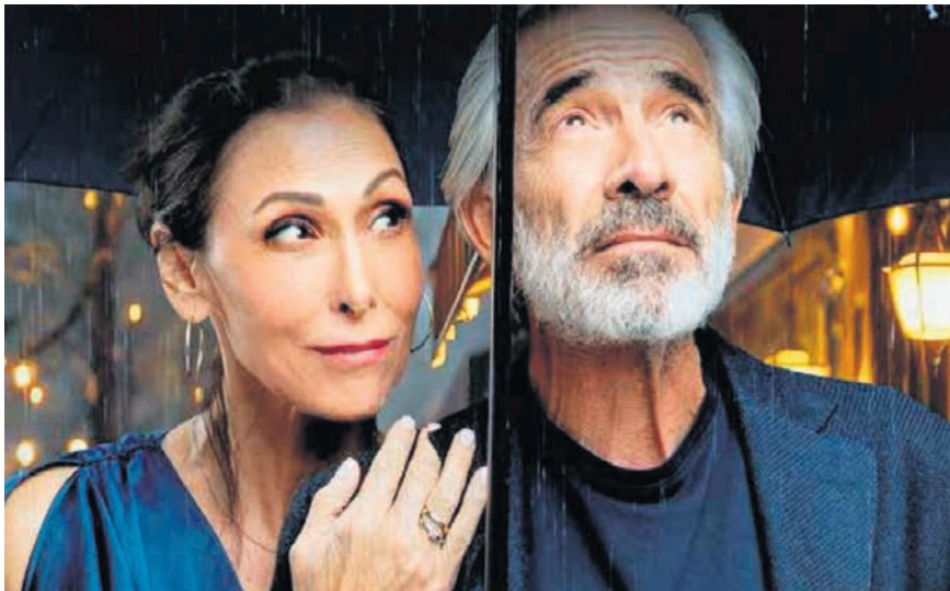
El Social contará con caras conocidas.

"Música para Hitler", el 21 febrero, con Kiti Manver y Carlos Hipólito, narra un hecho real: la invitación que recibió el violonchelista Pau Casals en 1943, exiliado en Francia bajo la ocupación nazi, para tocar ante Hitler, explorando el dilema moral entre dignidad artística y resistencia frente a la tiranía fascista. "Las bingueras de Eurípides", el 14 marzo, es una tragicomedia de la compañía Las Niñas de Cádiz que mezcla teatro clásico griego el ambiente contemporáneo en un bingo clandestino