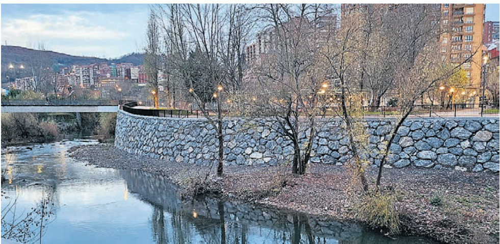
Estado del paseo antes de su apertura.

Ambos cuerpos policiales son conscientes de la efica- cia del patrullaje preventivo y predefinido para lograr la reducción de este tipo de incidencias y llevarán a cabo las vigilancias de forma co- ordinada.