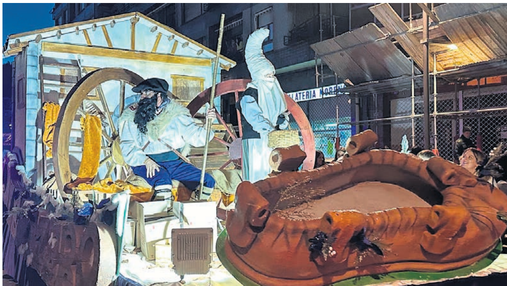
Olentzero y Mari Domingi a su paso por Amorebieta en una ocasión anterior.