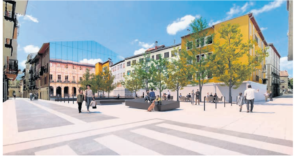
Infografía que muestra cómo quedaría la zona tras su transformación.

“Con este proyecto, no solo estamos ampliando la plaza, sino recuperando para la ciudadanía un lugar de encuentro que une modernidad, tradición y memoria. Queremos que esta nueva plaza sea un espacio inclusivo y multifuncional, que permita a las y los durangarras disfrutar de un entorno más accesible y cómodo, y, al mismo tiempo, sirva como un recordatorio de nuestra historia y todo lo que hemos superado como sociedad”, apunta la alcaldesa, Mireia Elkoroiribe.