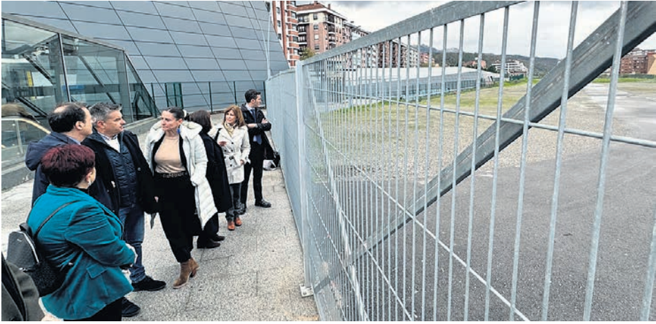
Visita a los terrenos en los que se prevé construir la nueva infraestructura.

Cerca de 300 profesionales de Osakidetza se trasladarán a esta nueva infraestructura que albergará atención primaria, especializada hospitalaria y atención sociosanitaria; además, ampliará la cartera de servicios, que incluirá Atención Primaria en consulta y a domicilio, procedimientos diagnósticos y terapéuticos, actividades de promoción y prevención, atención a infancia y adolescencia, a la mujer, atención a personas adultas y mayores, cirugía menor, gestión administrativa, área de Consultas Externas de especialidades, docencia, salud mental, Radiodiagnóstico, Punto de Atención Continuada (PAC) y espacio para personal de Emergencias y Vehículo de Intervención Rápida (VIR).