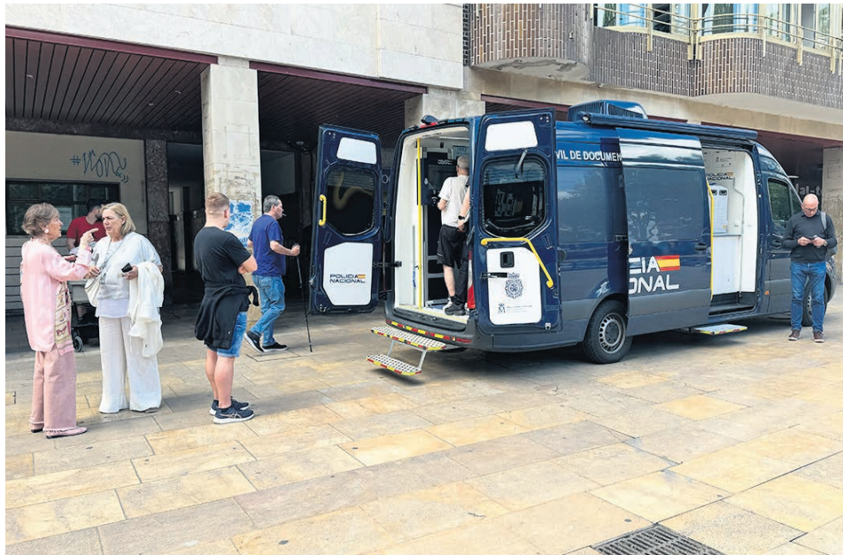
Vecinos esperan para entrar en la oficina móvil.