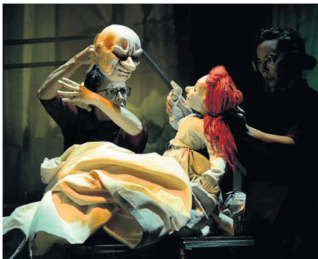
Los títeres serán protagonistas en Amorebieta.

El segundo será el turno para "Kotondarrak", inspirada en las luchas obreras de las mujeres en la industria textil. Y los días 2 y 3, "Andereño", que narra la historia de una maestra y su pequeña clase, una escuela construida desde el amor y el