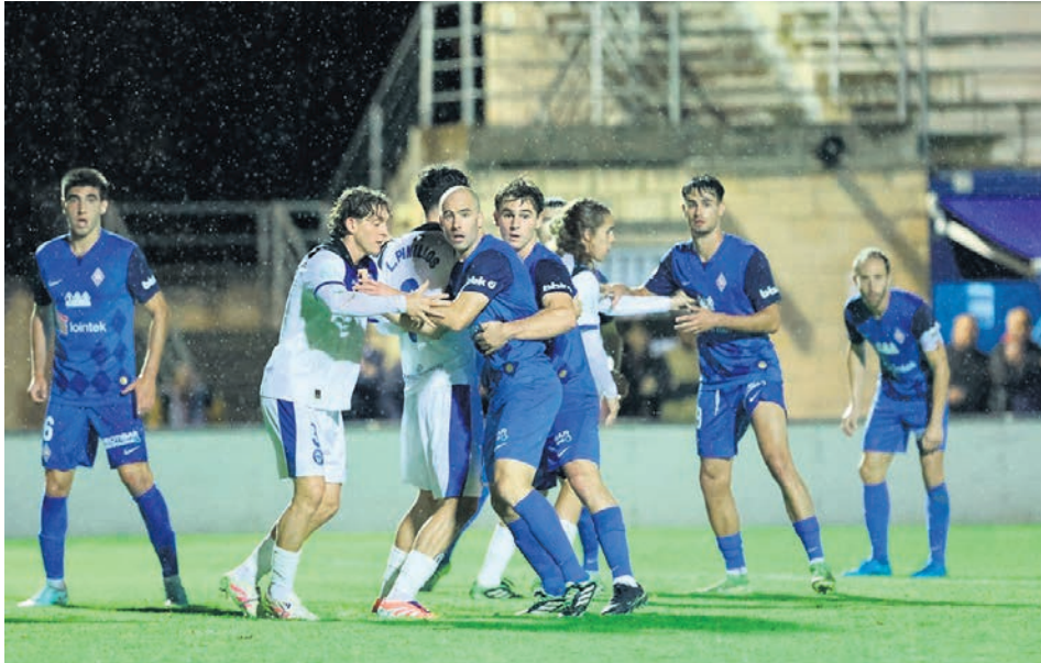
□ Un lance del duelo de los azules ante el Alavés B en Urritxe.

compromiso, que tendrá lugar el 13 de diciembre a las 19.00 horas en Areito contra el Eibar B, 11º en la tabla con 2 puntos menos que la SDA. Tras ello, despedirán 2025 en casa contra Mutilvera el día 20 a las 17.00 horas.