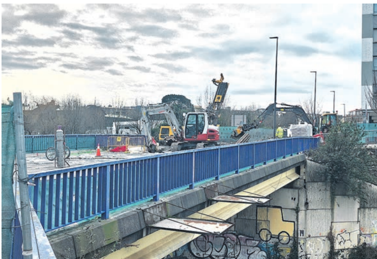
El Puente de Matxitxako será demolido.

El proyecto, financiado al cincuenta por ciento por el departamento de Movilidad