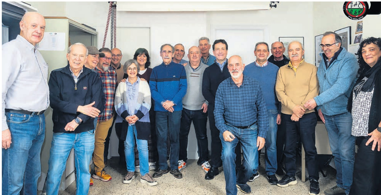
□ Un momento de la visita a la agrupación de fotos en su local.