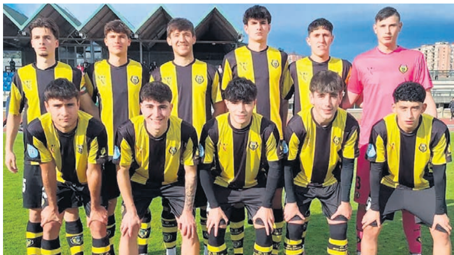
Once inicial del Basconia frente al Ebro.

La irregularidad de resultados, alternancia entre triunfos, empates y tropiezo, refleja un Basconia capaz de competir con los de su entorno, pero necesitado de mayor consistencia y capacidad de definición para escalar posiciones. Con el inicio de la segunda parte de la temporada, la agenda de los gualdinegros no se suaviza, afronta