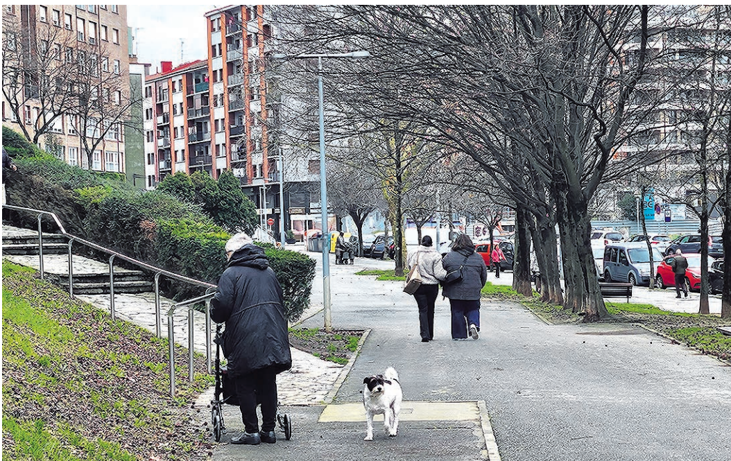
El municipio se preocupa por sus vecinos más vulnerables.

A partir de la información oficial del presupuesto liquidado en 2024, esta asociación califica a los Ayuntamientos como "excelentes" por realizar una inversión superior a 200 euros habitante/año y "pobres" si lo que invierten es menos de 63,89. Solo 27