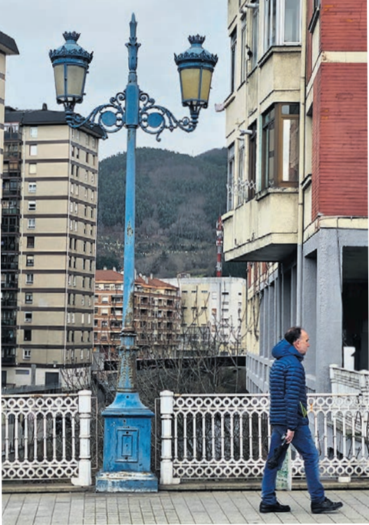
Pintarán las farolas del Puente de Ariz.

La zona baja de la calle Aguirre Lehendakari cuenta con una parte que actualmente tiene unas escaleras que conectan el puente de Ariz con el paseo del río y con