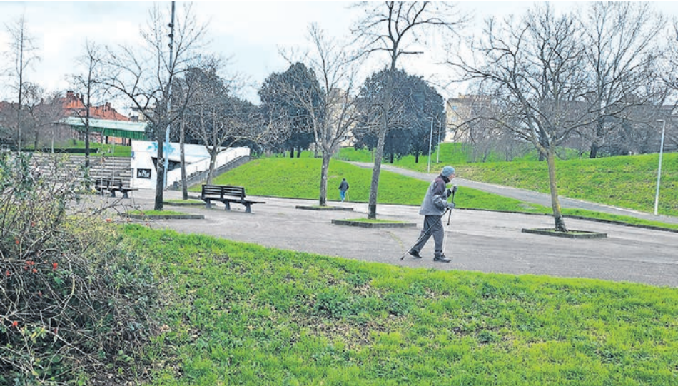
Basauri optimizará la zona baja del parque Bizkotxalde.