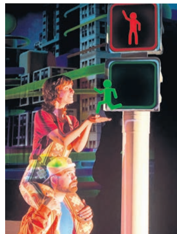
Imagen de "Semaforoa"

El día 8 de febrero, a las 18.00, hay obra familiar premiada: "Laika", de Xirriquiteula Teatro. En plena Guerra Fría, la perra Laika pasa a la historia como el primer ser vivo en orbitar alrededor de la Tierra. Las entradas valen 4 euros, 3 para socios.