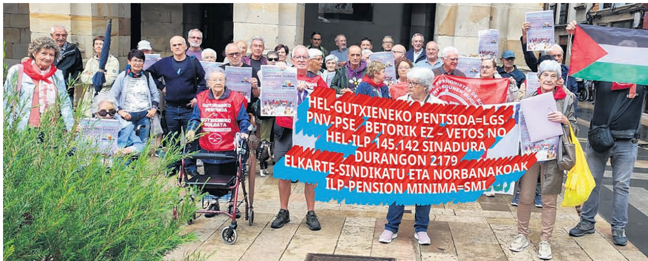
Imagen de una de las concentraciones en la plaza del ayuntamiento.