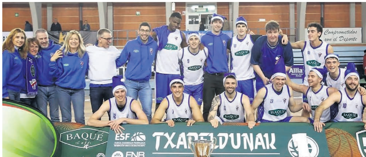
□ Equipo masculino del 'Tabi' que ganó la final de la Copa en su última cita de 2025.