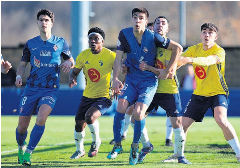
□ El Ebro supo sujetar al 'Amore' en su último partido como local.

En su último partido en Urritxe, los zornotzarras cayeron 1-2 ante el Ebro, que jugó más de una hora con uno más. Y el pasado fin de semana, en su desplazamiento a Las Gaunas para medirse a uno de los equipos más potentes de la categoría como es la Unión