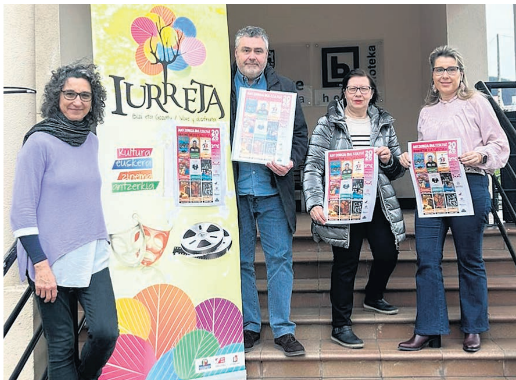
Presentación del festival que cumple su 12ª edición.

Después llegarán "Bizi, bizi zirkua" el 6 de marzo, "Descóseme las alas" el 13 de marzo, "Abduzioa, ke barbaridad" el 17 de abril, "Bizia" el 8 de mayo, "El encargo" el 22 de mayo y "Como la vida misma" el 5 de junio.