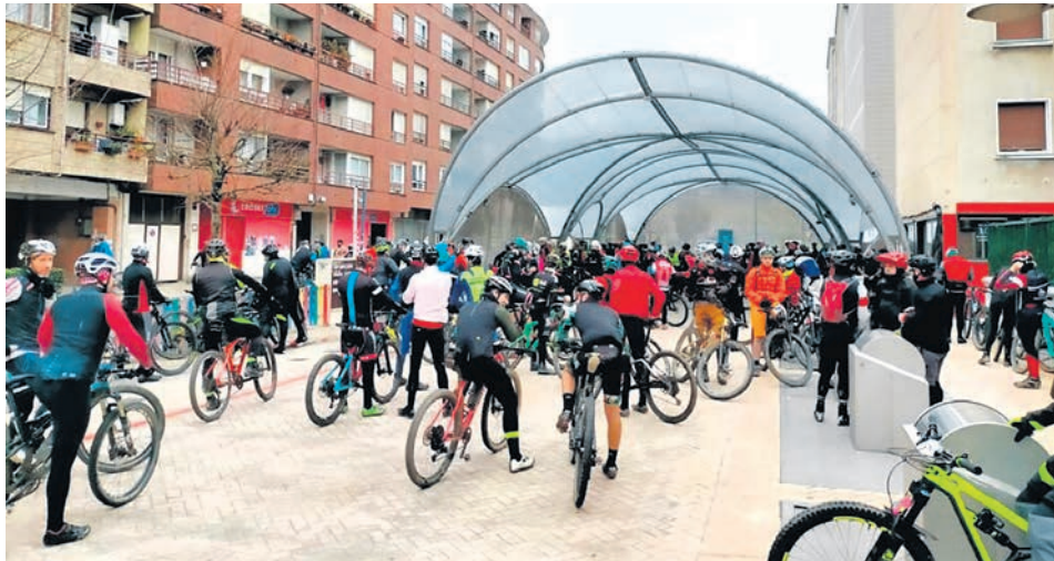
Basatzan mendi bizikleta martxa solidarioa hilaren 31n izango da.

Para ayudar a personas cuidadoras de la comarca, la Mancomunidad y el servicio Mobidurungaldea organizan un taller de actividad física para evitar molestias habituales que generan los cuidados y aprender ejercicios para mejorar la salud. El objetivo principal es cuidar la espalda, aliviar el dolor y trabajar fuerza, equilibrio y coordinación, incluyendo prevención de caídas. Habrá sesiones varios viernes de este primer trimestre en la casa de cultura Ibarretxe de Iurreta de 10.40 a 12.00 horas. Inscripciones: 94 620 05 46 y 680 425 764 o zaindu@dma.eus.