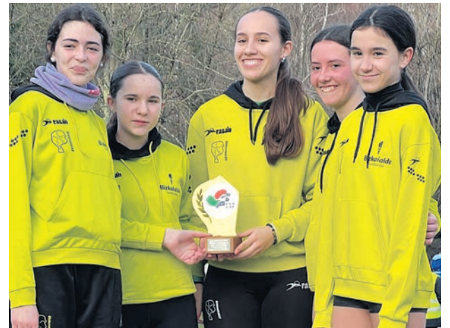
□ Integrantes del equipo sub 16 femenino que acabó campeón.

A nivel individual, los resultados más destacados los consiguieron la duranguesa Oihane Irusta, 2ª en absoluta femenina, y el iurretarra Iker Fidalgo, 2º en la prueba sub 20 masculina. Además, Uda-ne Barrondo acabó 3ª en categoría sub18 femenina.