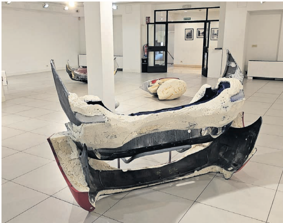
□ Aspecto de la muestra.

Tirada de esta edición: 18.000 ejemplares (buzoneados en Basauri)