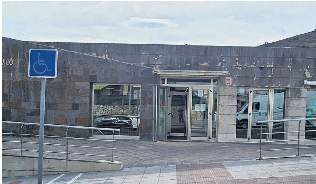
Las charlas serán en el Centro Cívico de Basazelia.