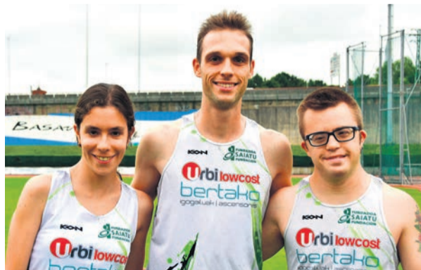
□ Tres de los atletas seleccionados.

“Muy buena noticia para el club con esta convocatoria, convirtiéndose en la entidad con mayor número de seleccionados y que, de esta manera, comienza las celebraciones del 30 aniversario de su fundación en 1996”, comentan.