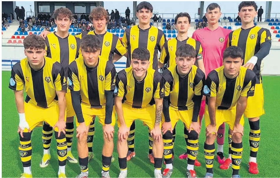
□ La alineación titular del CD Basconia en su partido a domicilio frente al Eibar.