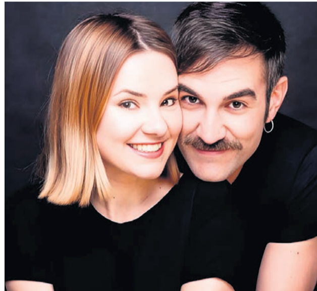
Los actores de 'Arizona'.