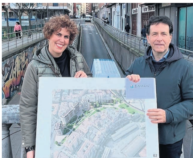
Presentación de los trabajos.

Según el diseño elegido por la ciudadanía, en la primera fase actuará en la calle Lehendakari Aguirre, en el tramo entre la calle Autonomía y la estación de tren y su entorno. Dicho tramo se rellenará hasta la cota de la acera existente, de cara a conseguir una permeabilidad visual y urbana con el nuevo parque, y, a la vez, permitir el acceso al garaje privado existente junto al edificio de estación (Lehendakari Aguirre 26), ya que a futuro se accederá por esta calle, no por Piru Gainza. Se suprimirá el paso rodado bajo las vías, que será exclusivamente peatonal y ocasionalmente se podrá utilizar para el paso de vehículos de la brigada o Policía Local. Con esta intervención, además, se redu-