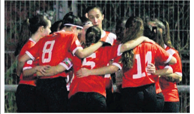
□ Las jugadoras del Indartsu femenino celebran uno de los recientes goles de su equipo.