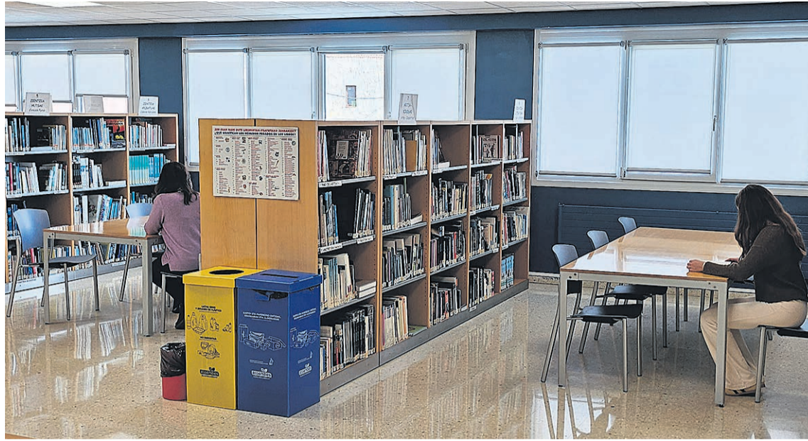
Los vecinos quieren dotar de más material a la biblioteca.

En la primera fase enviaron 616 propuestas que fueron analizadas en las áreas técnicas para valorar su viabilidad. Se priorizaron 18 de diferentes ámbitos de actuación. A la hora de valorarlas, se tuvo en cuenta que fueran económica y técnicamente viables, primaran el interés general, el equilibrio territorial del municipio y su alineación con los ODS (Objetivo de Desarrollo Sostenible). Una vez realizado dicho análisis, dispusieron varios