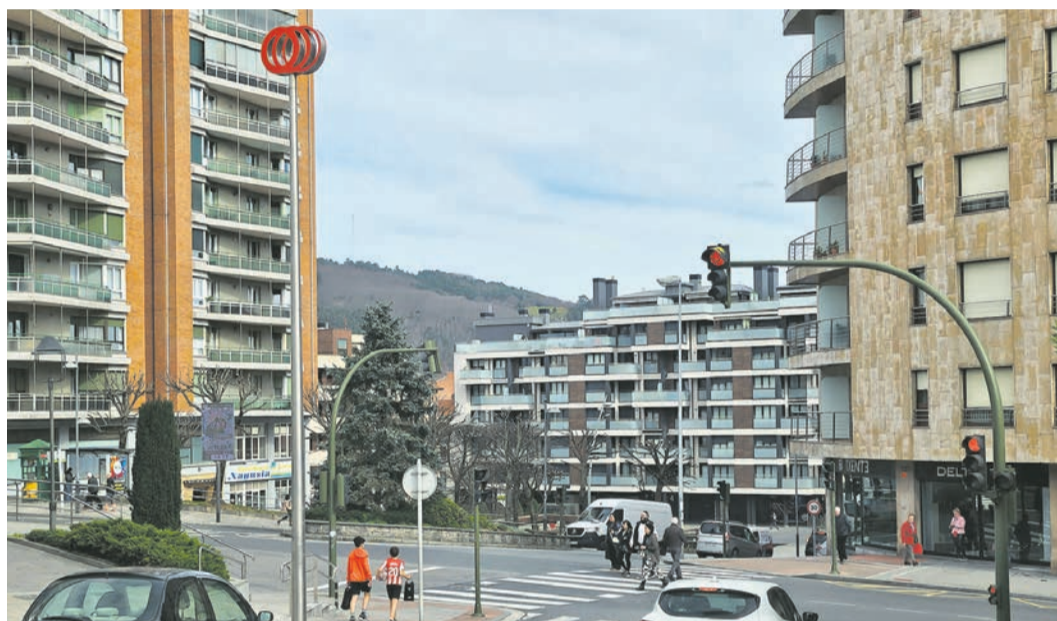
Basauri será declarada zona residencial tensionada.

El municipio cumple uno de los supuestos previstos por la ley para solicitarla. "Supera la cota del 30% del esfuerzo necesario para el pago de la vivienda en alquiler, dado que alcanza el 30,8%. Con el fin de contener los precios de alquiler y su incidencia sobre el excesivo esfuerzo económico para el pago de la vivienda, se considera imprescindible acogerse a los be-