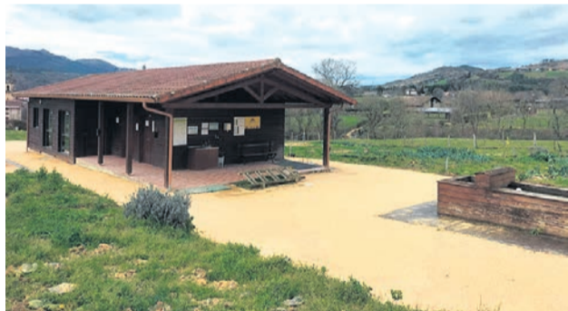
Huertos ecológicos de Iurreta.

Este proyecto se inició en 2011 y, desde entonces, ha ido consolidándose. Para el periodo 2026-2030 se han registrado 19 nuevas incorporaciones que quieren formar parte. En estos momentos, todas las parcelas ofer-