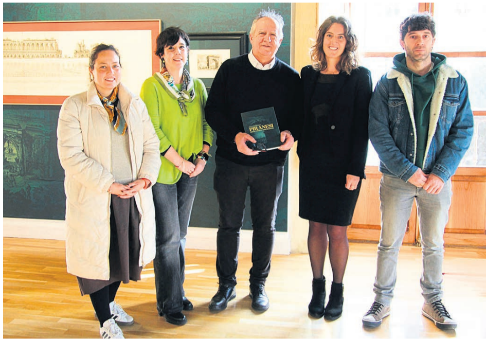
Presentación de la muestra dedicada a Piranesi.

Con aportación de 6 euros se pueden adquirir 1 kilo de arroz, 1 de legumbres, 1 de azúcar y un paquete de pasta. Con 9 euros, el lote incluye 1 de arroz, 1 de legumbres, una botella de aceite de oliva de 1 litro y 1 paquete de compresas. Y con una donación de 15, se financia un lote compuesto por 1 kilo de pasta, 1 de legumbres, 1 paquete de compresas, 1 botella de aceite de oliva de 1 litro, 3 latas de atún en aceite y 1 lata de sardinas.