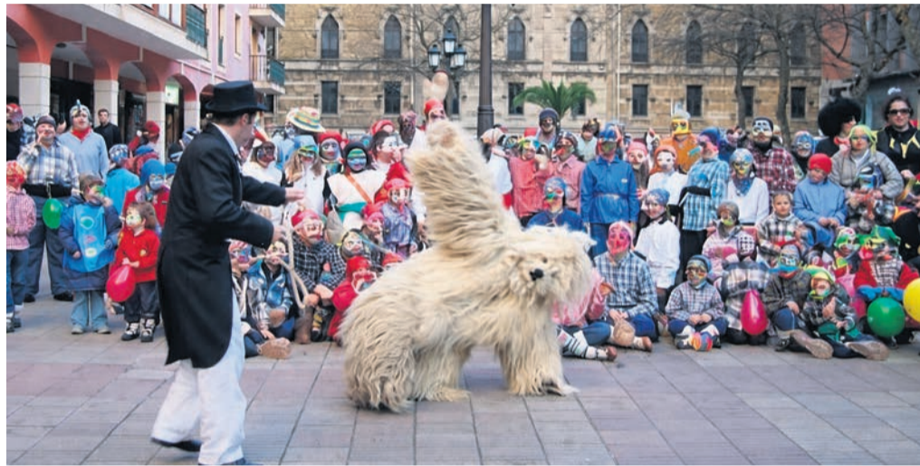
El Carnaval regresa para sorprender a mayores y niños.

En Amorebieta-Etxano, el día 13 a las 17.00 celebran Ta-