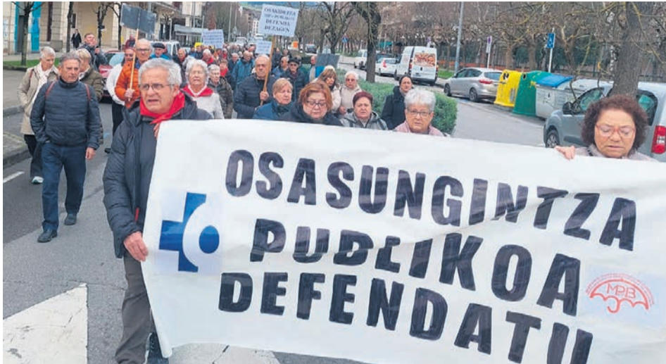
La protesta de los pensionistas.