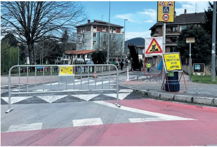
Una calle cortada por las obras.

Entre las zonas legidas están las calles Intxaurrenondo, laLaubideta y el polígono Aliendalde, donde se realizarán actuaciones para reducir la pendiente de pasos peatonales elevados, facilitando el tránsito de personas con movilidad reducida, carros o bicicletas. También asfaltarán tramos de Gallanda kalea, Landako-Fray Juan de Zumarraga, Kurutzia o San Rokebide, y otros puntos.