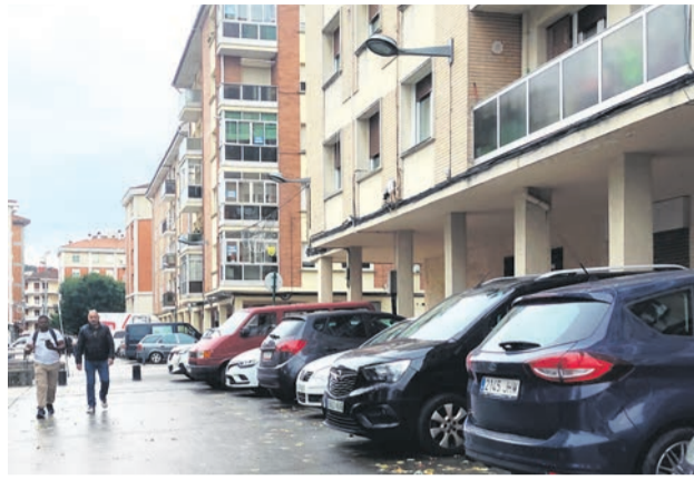
□ Pisos en Usansolo.

La iniciativa responde a la necesidad de dotar al municipio de un marco jurídico claro, estable y transparente