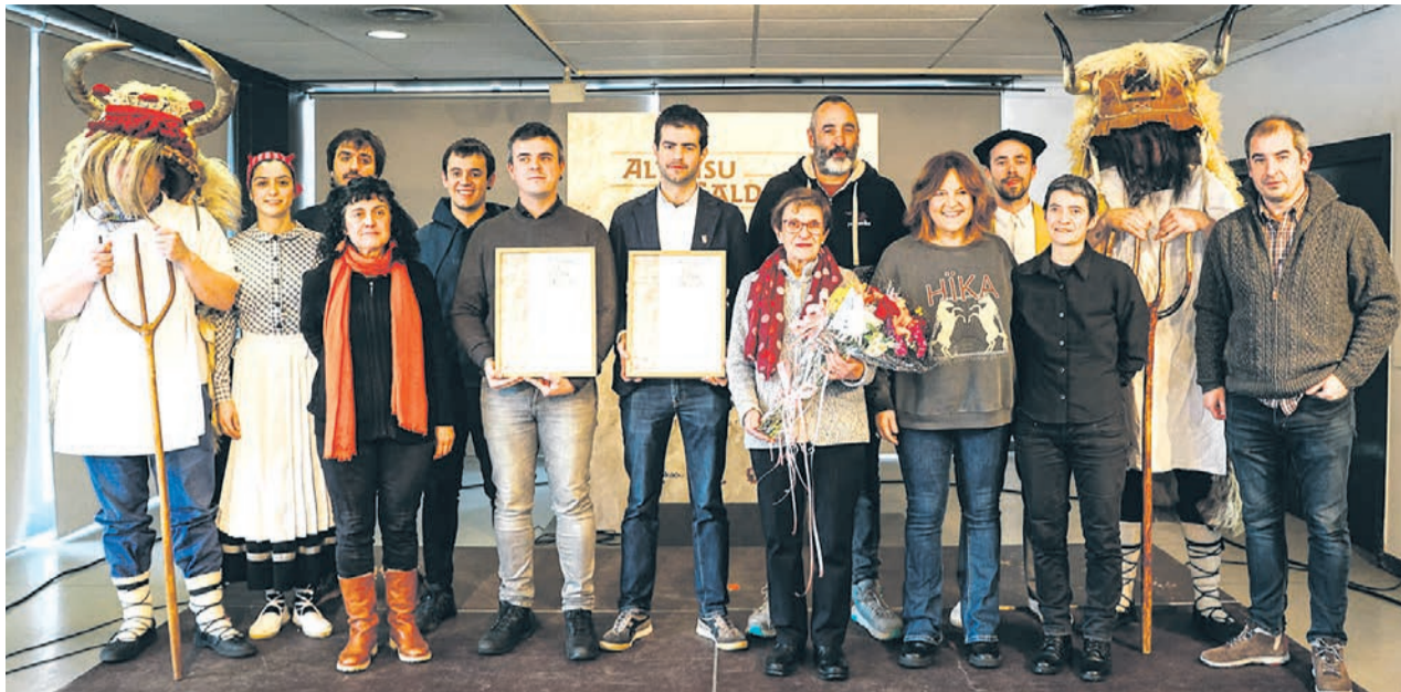
□ Galdakao se ha hermanado con Altsasu.

Con el objetivo de evitar la especulación, solo se beneficiarán de la modificación locales ya cerrados antes del 1 de enero de 2026. Esta limitación tiene por objeto evitar el cierre de los comercios por razones de especulación. Asimismo, se protegerán las zonas comerciales de la localidad y sus locales no podrán convertirse en viviendas. La medida fue aprobada por unanimidad.