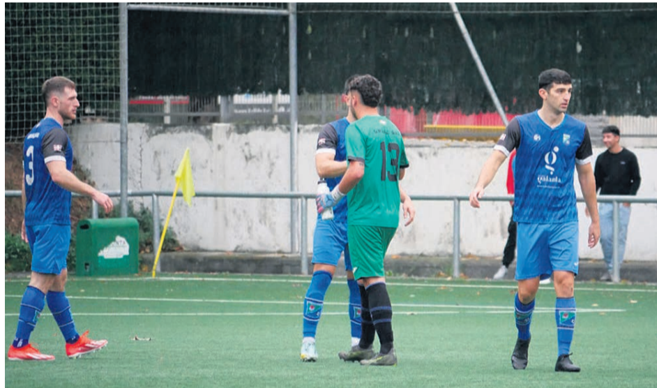
Los defensores y guardameta del Umore Ona durante uno de los partidos.

Los números no dejan lugar a interpretaciones. En sus tres últimos compromisos, el Umore Ona ha dejado la portería a cero en todos ellos, una estadística que resume a la perfección el momento del equipo. El 3-0 ante el San Miguel en Meatzeta sirvió para cerrar la primera vuelta con sensaciones inmejorables, en un partido completo tanto en ataque como en defensa. Después llegó un trabajado 1-0 frente al Iurretako, resuelto desde la pacien-