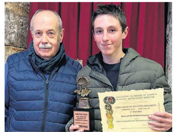
□ Oategi con su premio.

Oategi ha optado por tecnología 3D para hacer figuras, además de haber asistido al cursillo de iniciación que imparte la asociación.