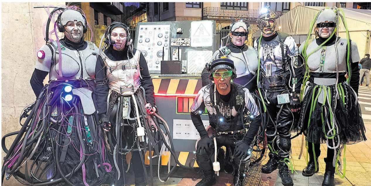
La originalidad viste los Carnavales de Galdakao.

• 17:30 | Frontón de Aperribai. Juegos, pintacaros y gincana. Organiza: Ludotecas y Topagunes.