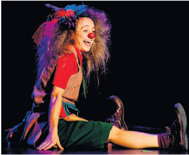
Imagen de 'Da Capo eta Martina'.