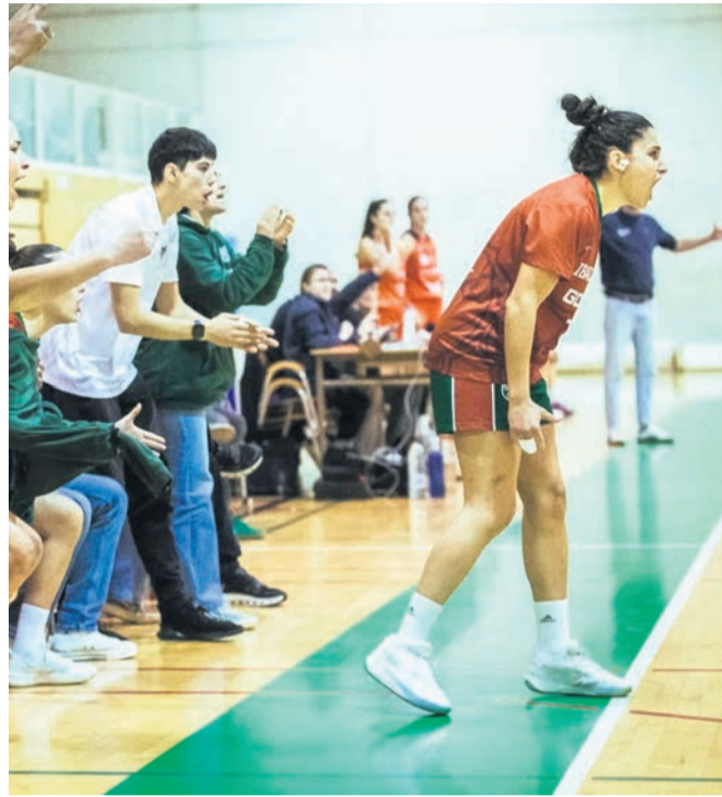
Las jugadoras del banquillo del Ibaizabal tratando de animar a las suyas en pleno partido.

Las dinamiteras afrontaban este tramo de la temporada instaladas en la zona más alta de la clasificación y con la confianza que da la regularidad mostrada durante meses. Sin embargo, en sus dos últimos compromisos ligeros el equipo no ha logrado mantener ese nivel competitivo que le había caracterizado, cediendo en encuentros especialmente duros tanto por el rival como por