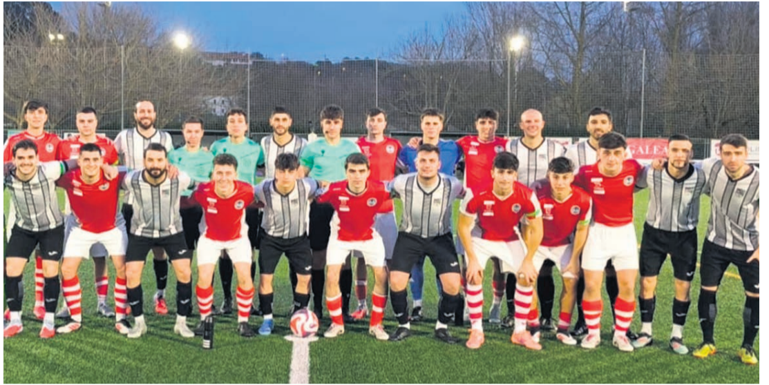
Los del CD Galdakao y el Galea se unieron para lucir brazalete de la lucha contra el cáncer.

FÚTBOL. Febrero ha servido para confirmar que lo ocurrido en enero fue poco más que un bache en el camino. El CD Galdakao ha recuperado la solidez, la confianza y, sobre todo, los resultados, disipando cualquier atisbo de duda sobre su candidatura al ascenso. Los dinamiteros han vuelto a marcar territorio y lo hacen además como claros líderes, con números que refuerzan su condición de gran favorito al título. La confirmación del regreso del mejor Galdakao llegó en el cierre de enero, el pasado día 31, con una victoria tan seria como convincente en el feudo del Galea por 0-2. Dicho triunfo, trabajado y maduro, sirvió para cortar de raíz cualquier posible deriva negativa y devolver al equipo la sensación de control que había perdido semanas atrás. No fue solo una victoria más, fue un gol-