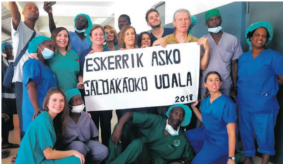
Participantes en uno de los proyectos solidarios.

La cronología de sus colaboraciones es amplia. Fue en 2004, con la ayuda íntegra del Consistorio de Galdakao, cuando se pudo construir en la India un módulo habitacional