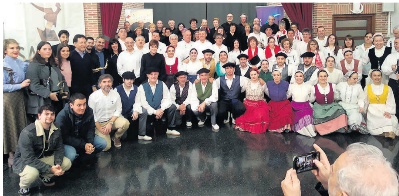
□ Foto de familia de premiados y asistentes.