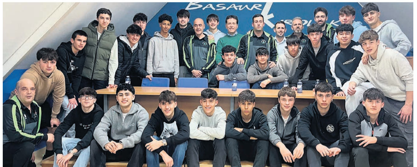
Componentes de la Selección de fútbol cadete.