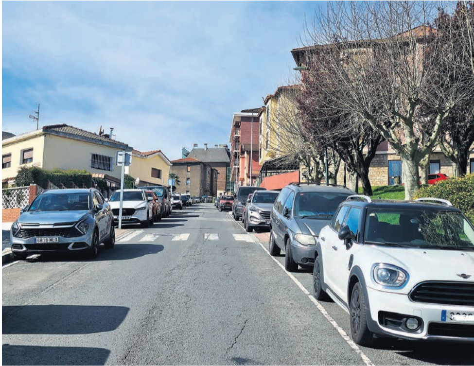
La ciudadanía insiste en la dificultad para aparcar en Basauri.

Respecto a la opinión sobre la calidad del transporte público de Basauri, recibe un 7.85 sobre 10 y la satisfacción con Basauri como lugar para vivir alcanza un 7.81. Según las personas encuestadas, la acción más positiva del Ayuntamiento son los paseos, zonas verdes y parques (14,3%) y los ascensores y escaleras mecánicas (8,7%). Para el 31,9% la falta de aparcamiento es el principal problema del municipio,