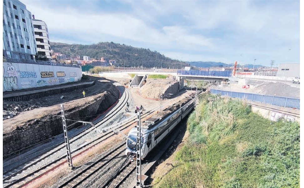
Tren a su paso por Basauri.