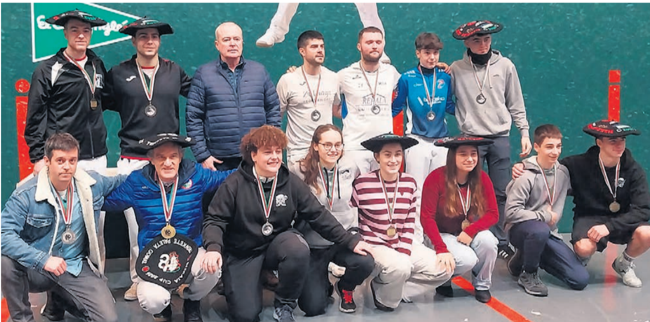
Campeones y subcampeones en Abadiño.