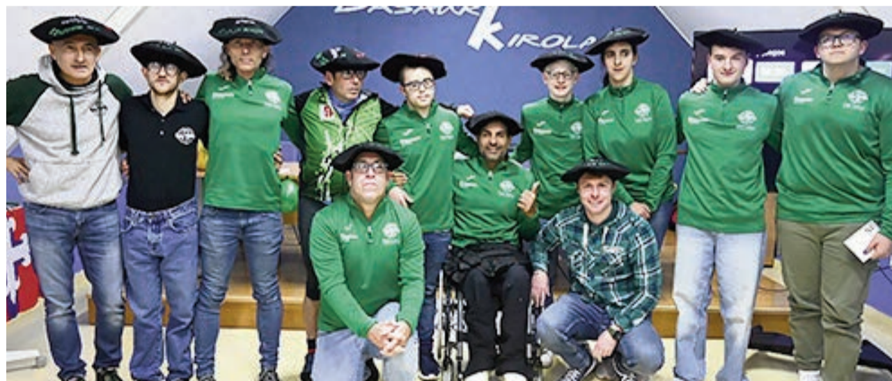
Asistentes al acto inaugural del aniversario con las txapelas concedidas.