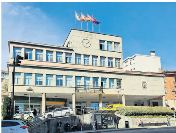
El edificio consistorial.

Después de descontar de la liquidación presupuestaria las cantidades destinadas a gastos comprometidos para el actual ejercicio y posteriores, incorporaciones obligatorias, el Ayuntamiento de Basauri cerró el ejercicio 2025 con un remanente de tesorería de 28.101.462 euros, cifra a la que habrá que restar las incorporaciones voluntarias a las cuentas de 2026, que podrían alcanzar los 14.163.111 euros, "por lo que el montante finalmente disponible rondaría los 14 millones de euros, aunque la