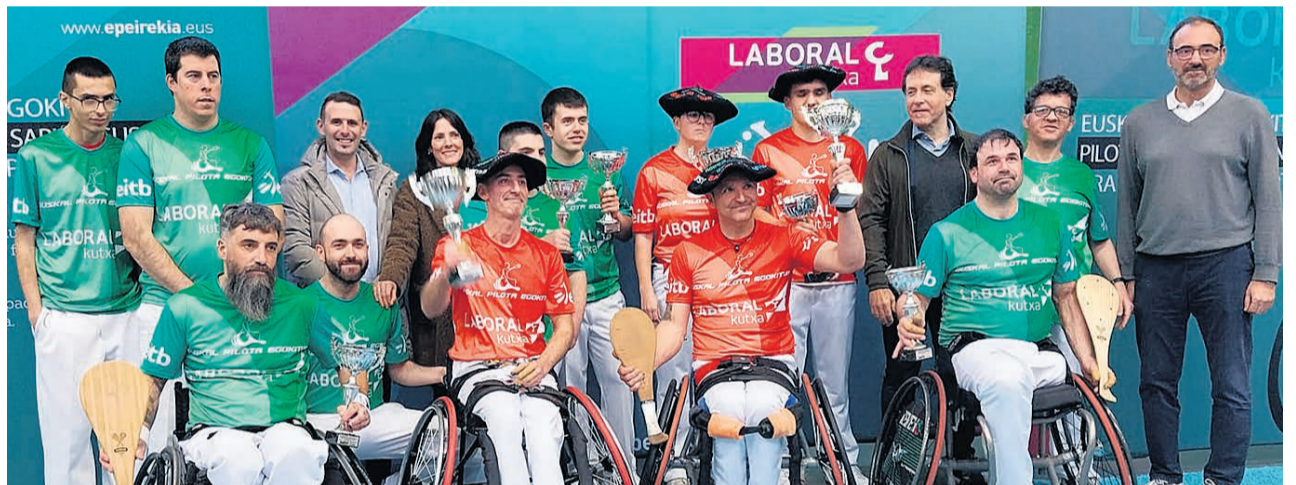
Participantes en el circuito junto a autoridades.