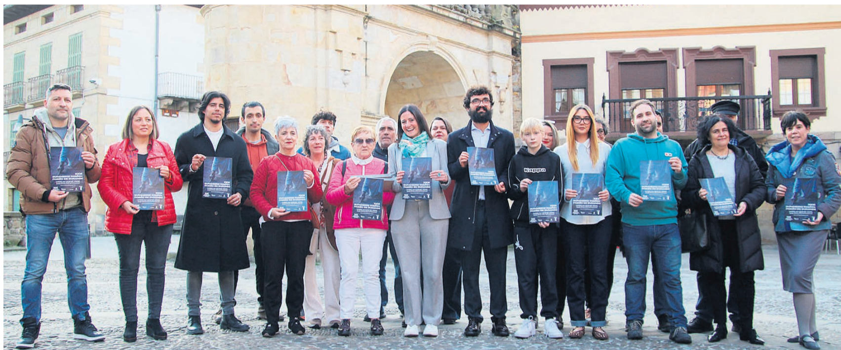
Presentación de La Pasión de Durango.