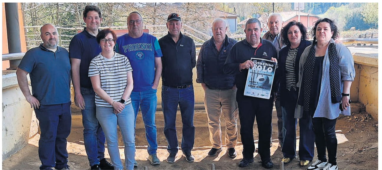
Presentación del campeonato.