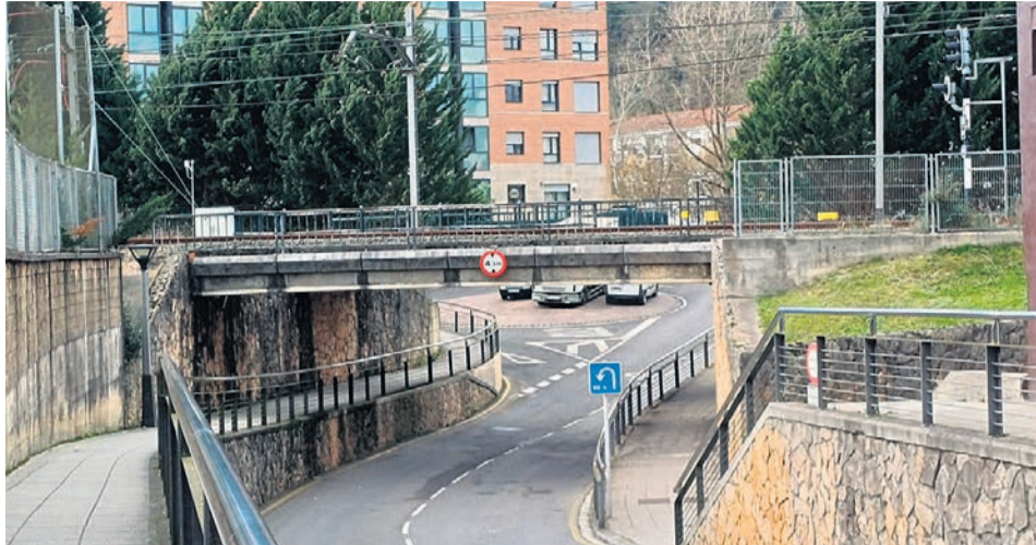
El paso subterráneo.