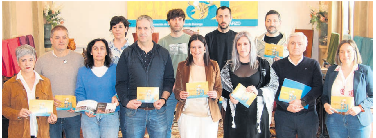
□ Representantes del Ayuntamiento y de las asociaciones que han participado en la elaboración del programa.

Durango reforzará la seguridad y visibilidad de varios pasos de cebra del municipio, dando respuesta a una demanda trasladada por la ciudadanía. Los trabajos se centrarán en 11 pasos de cebra desde la rotonda de Madalena hasta la que une Frai Juan Zumarraga con Alluitz. Asimismo, se actuará en un paso de cebra en Ollería y en otros dos ubicados en la de Alluitz con Sasikoa. El presupuesto asciende a 150.936 euros. En diciembre se llevó a cabo una actuación de prueba en el paso de cebra de Astxiki, donde instalaron balizas luminosas en el suelo. Esta intervención piloto permitirá evaluar su durabilidad y, en caso de ofrecer buenos resultados, estudiar extender el sistema a otras zonas.