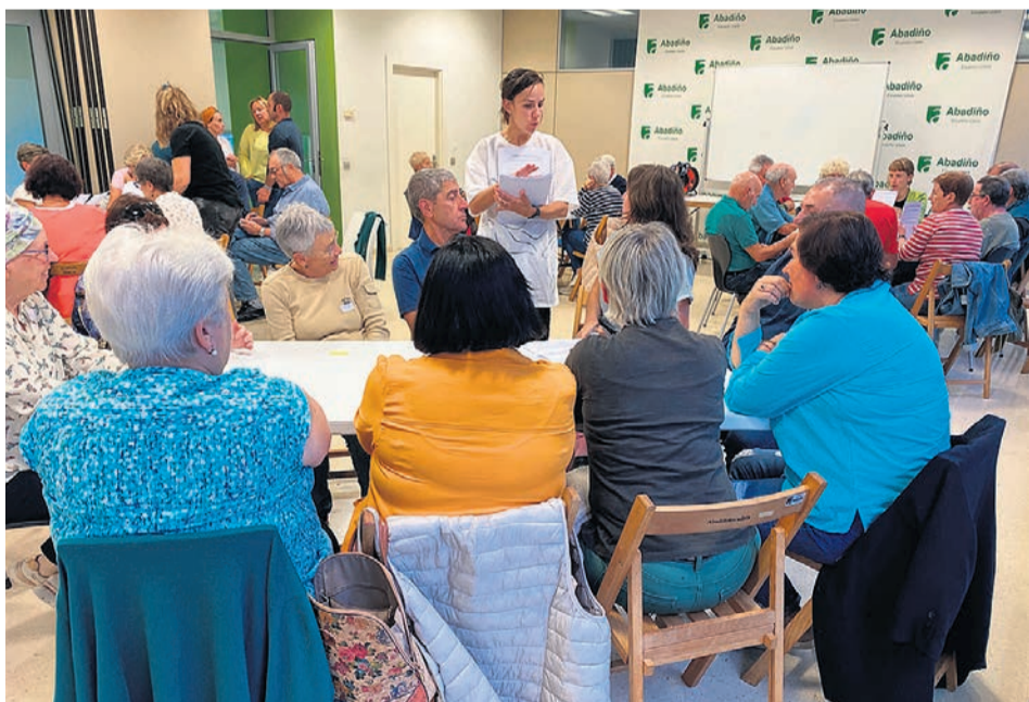
Aurreko topaketa baten irudia.