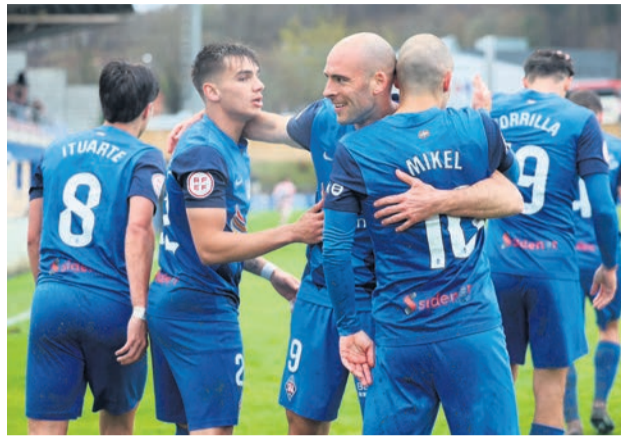
Los jugadores celebran un gol en Urritxe.

Los entrenados por Aitor Zulaika se desplazaron la se-