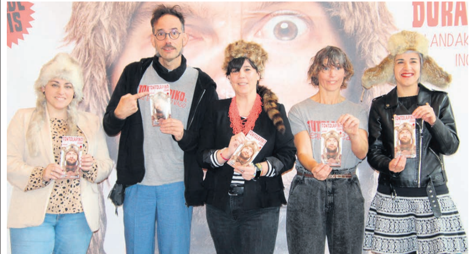
□ Representantes del Ayuntamiento y de la compañía Ganso &amp; Cia presentaron la nueva edición de TontoLapiko Eguna.