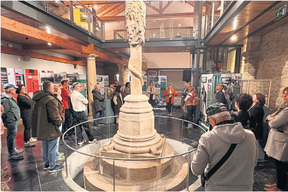
□ El Museo Kuruzesatu.