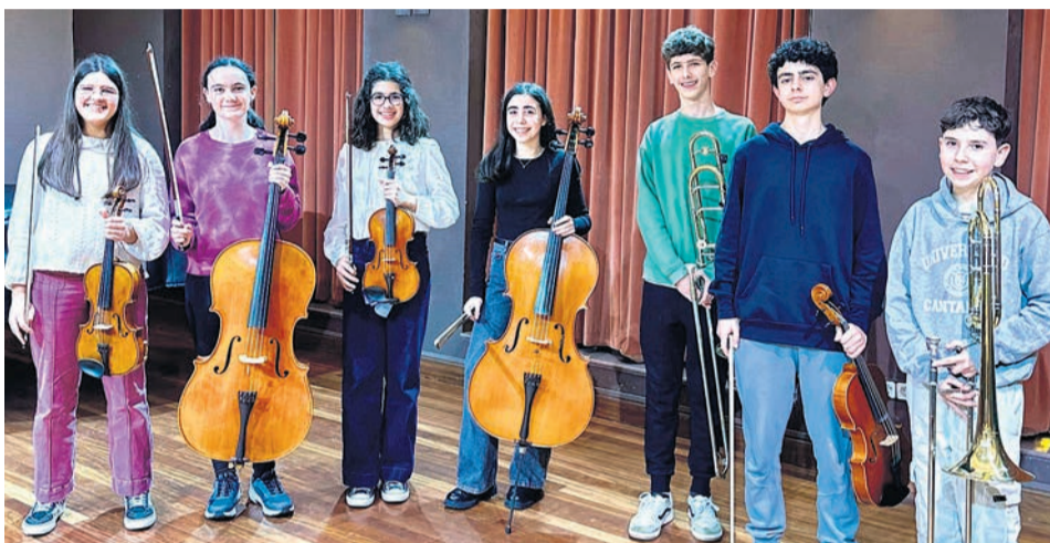
Los siete jóvenes seleccionados posan con sus instrumentos.

De este modo, estos jóvenes músicos, con edades comprendidas entre los 9 y