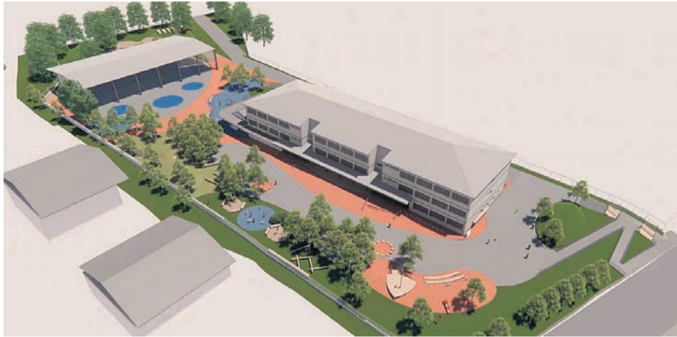
Infograf a del proyecto.