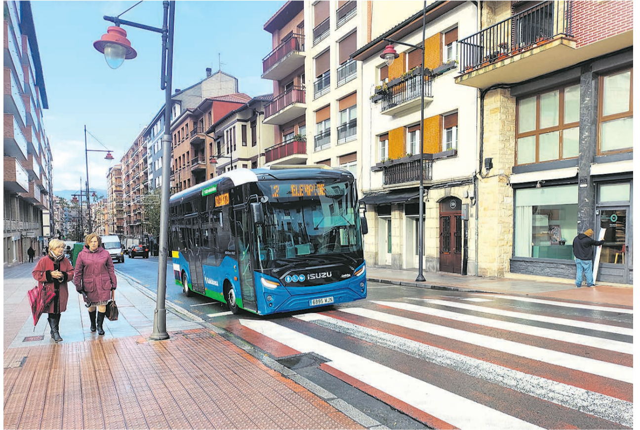
El Galdabusa pasa por Juan Bautista Uriarte.