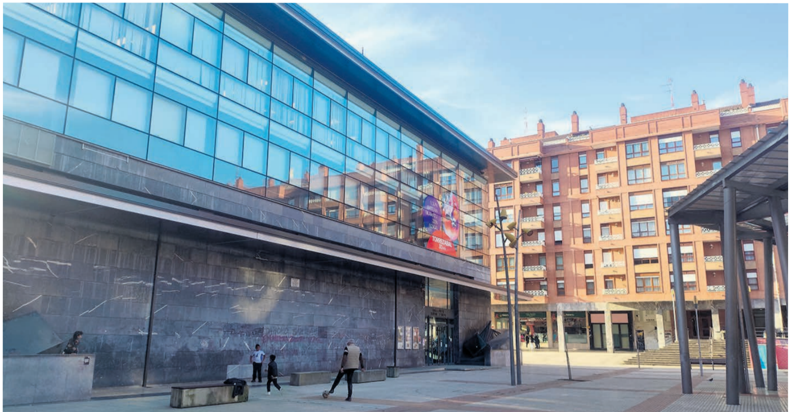
□ Imagen actual de Torre Zabal Kultur Etxea.

Cabe recordar que, con el fin de revitalizar el pequeño comercio local y tejer una fuerte red comercial en Galdakao, está vigente la segunda convocatoria de ayudas Biziberri. El plazo para solicitarlas abre hasta el 28 de marzo.