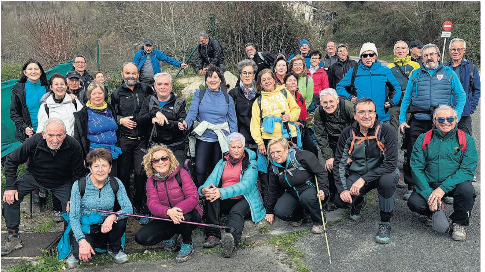
□ Una de las salidas de Izarra.

Durante 1,7 kilómetros más sube, los primeros por escaleras de madera, unas 250, para salvar un tramo bastante complicado del antiguo Camino de Santiago. El resto es