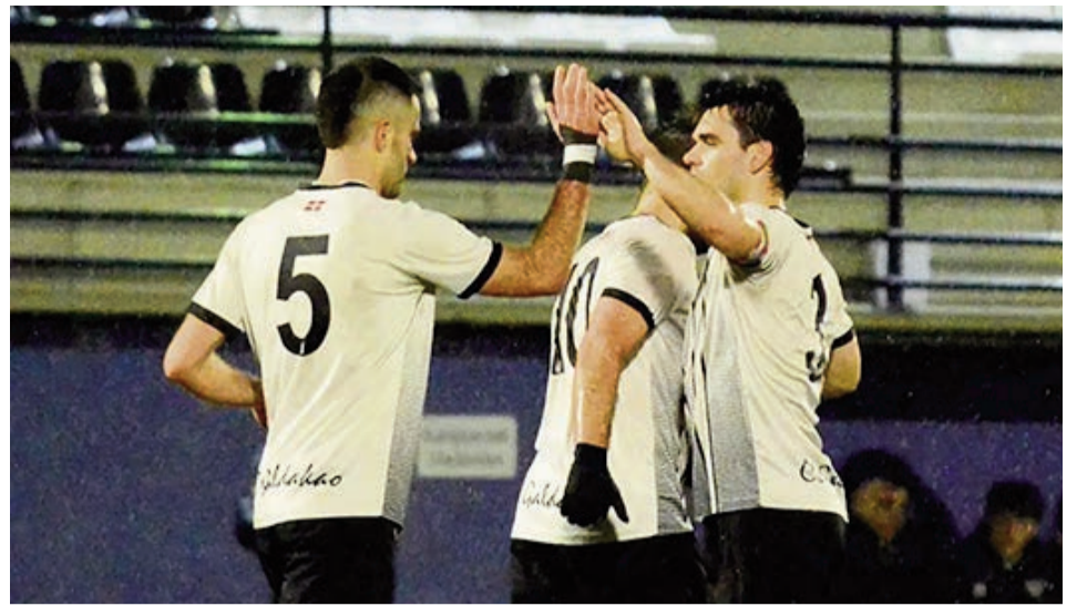
Los jugadores del CD Galdakao celebran un gol en el último partido.

El filial usansolotarra, al igual que el primer equipo, firmó un inicio de campaña muy prometedor, pero ya han pasado varios meses desde que se estancaron y se empezaron a meter en problemas por la ausencia de victorias. No obstante, el pasado 28 de febrero, tras varios meses, se reencontraron con la senda de la victoria para coger algo de aire y alejarse de los puestos de descenso, algo impensable a principio de temporada teniendo en cuenta su inicio.