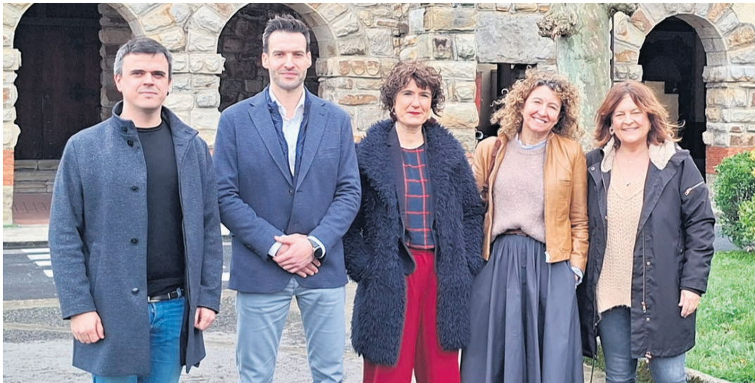
La Dinamita ya aparece en el fondo de fotos gracias a un acuerdo.