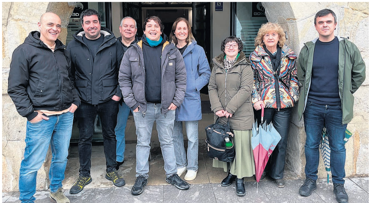
□ El acuerdo de mejora ya está hecho.

Una representación de empleados de las instalaciones deportivas ha mantenido un encuentro con el alcalde Iñigo Arriandiaga Hernando y el concejal de Deporte Asier Kortza Ibarra en el Ayuntamiento, a quienes han mostrado su agradecimiento.