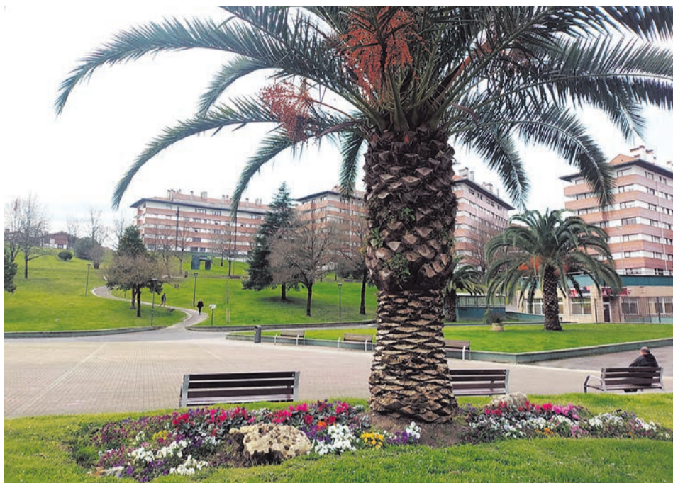
Los recorridos se llevan a cabo por los parques de Galdakao.

Azaroan, Galdakaoko Udalak, Agirre Lehendakaria Centerrekin (ALC) eta tokiko hainbat eragilerekin lankidetzan, Galdakao Zeugaz proiektua aurkeztu zuen, udalerriko Foro Soziosanitariotik sortutako ekimen komunitario aitzindaria. Proiektuak zainketak erdigunean jartzen ditu, ongizate-eredu berriak sustatuz eta herritarren parte-hartzea eta eragileen arteko lankidetzak sustatuz. Testu-guru horretan kokatzen da mendekotasun-egoeran dauden pertsonen zaintzaileei zuzendutako Zainduz programa. Egiten dituen jardueren artean, erizaintzako oinarritzako zaintzari buruzko tailerrak eta heriotzari buruzko hitzaldiak daude, besteak beste.