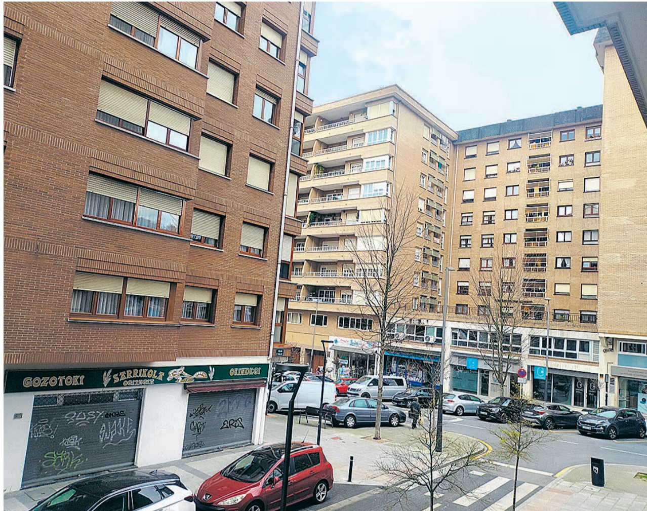
□ Viviendas en Galdakao.

Se trata de subvencionar actuaciones realizadas en viviendas o edificios durante el periodo comprendido entre el 30 de noviembre de 2025 y el 27 de noviembre