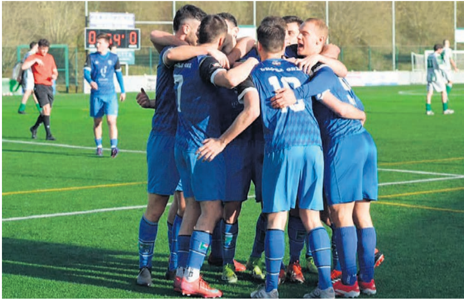
Los jugadores del Umore Ona se agrupan para celebrar uno de los goles en su visita a Zaldibar durante el último partido.