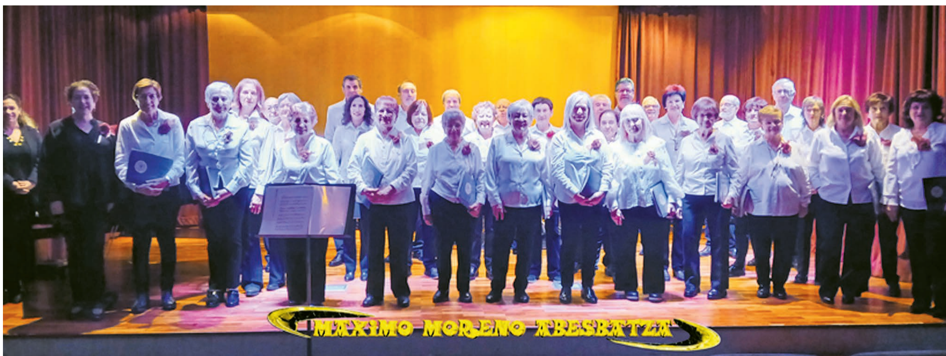
□ Los componentes del coro durante un concierto.