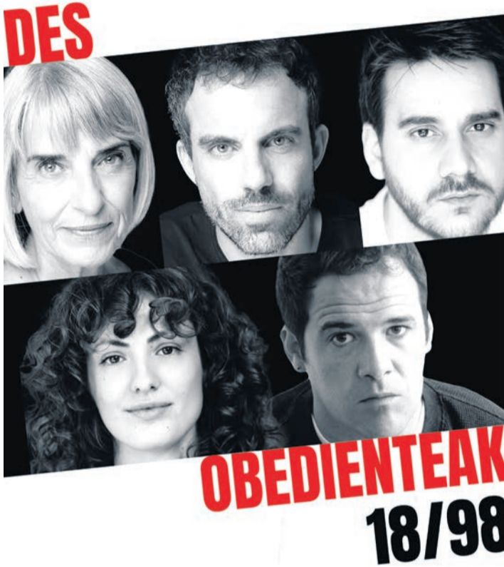
Los actores de 'Desobedienteak'.

Martxoaren 7an Torrezabal Kultur Etxeak "Kimu" euskarazko antzezlan hartuko du, 18:00etan. Marie de Jongh konpainiak irudimenez eta naturaz beteriko muntaia aurkezten du, aukera amaigabeak eskaintzen dituzten bi unibertso. Elikatu, zaindu eta erin egin behar ditugu. Oraindik iritsi ez den egun batean hasten da istorioa. O andreak multinazional batentzat egiten du lan. Diseinatu etxeak pertsona bakoitzak berea izan dezan. Bera bakarrik geratzen da lantegian.