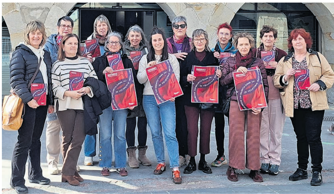
Presentación del programa del 8M.

Los días 9, 10, 12, 13, 16 y 17 de 11:30 a 13:30 y de 17:30