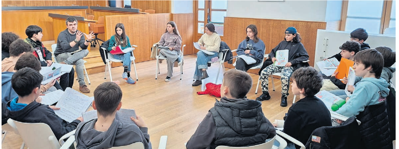
El alcalde habla a los estudiantes.