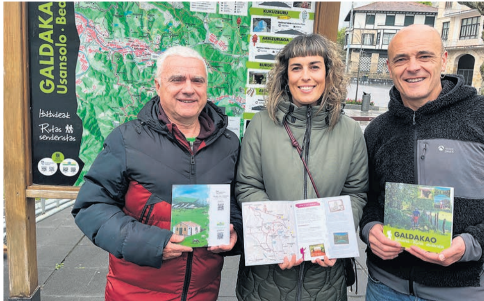
□ Presentación de la guía.

Incluye mapas de diferentes recorridos, como los de Ganguren, Arrizuriaga, Artetaganana o Kukuzburu, con información detallada sobre longitud, dificultad, desnivel, consejos, curiosidades y otros datos prácticos para las y los senderistas. Fue presentada en el Ayuntamiento de Galdakao, durante un pequeño encuentro en el que el presidente de Ganguren Mendi