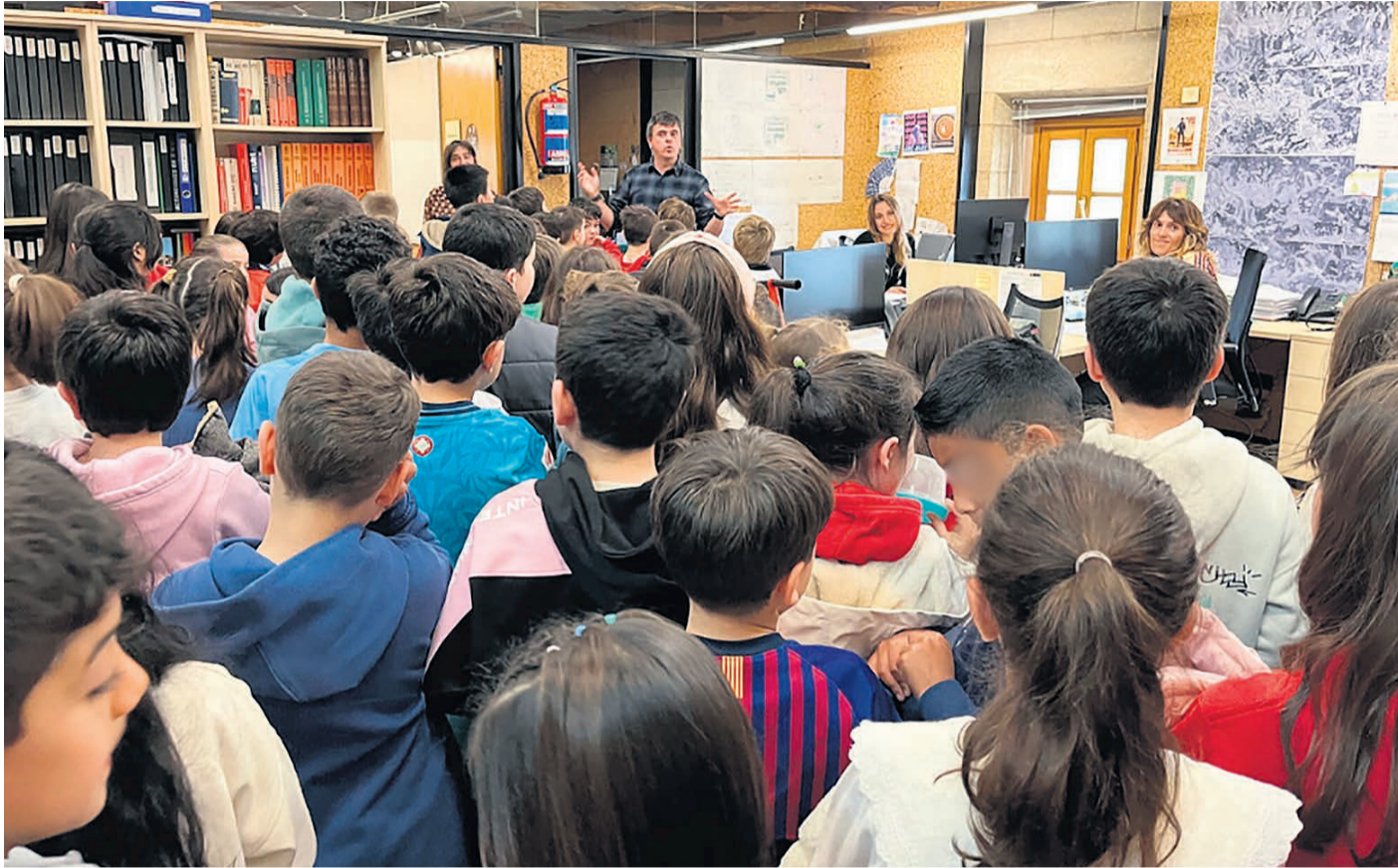
Los estudiantes durante su visita.