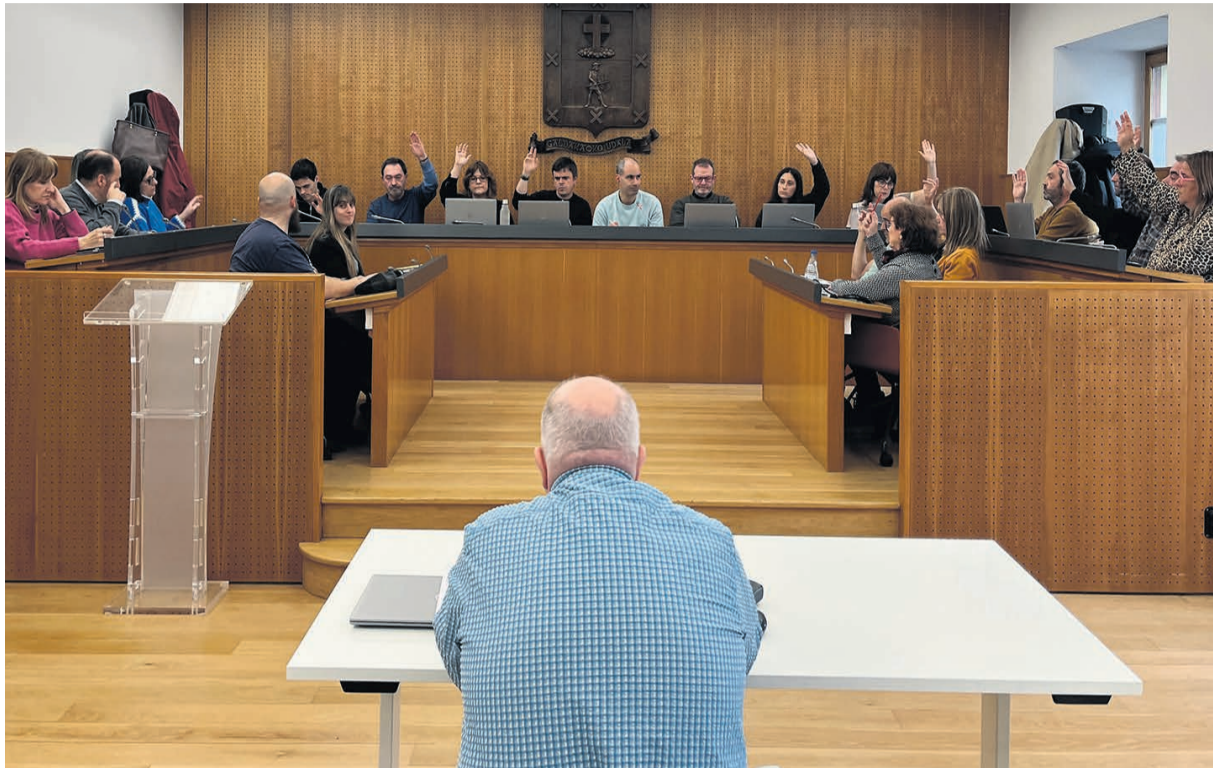
□ Imagen del Pleno de marzo en Galdakao.

Por otra parte, el Ayuntamiento de Galdakao ha aprobado la firma de un convenio de colaboración con el Ayuntamiento de Usansolo para seguir gestionando, por un