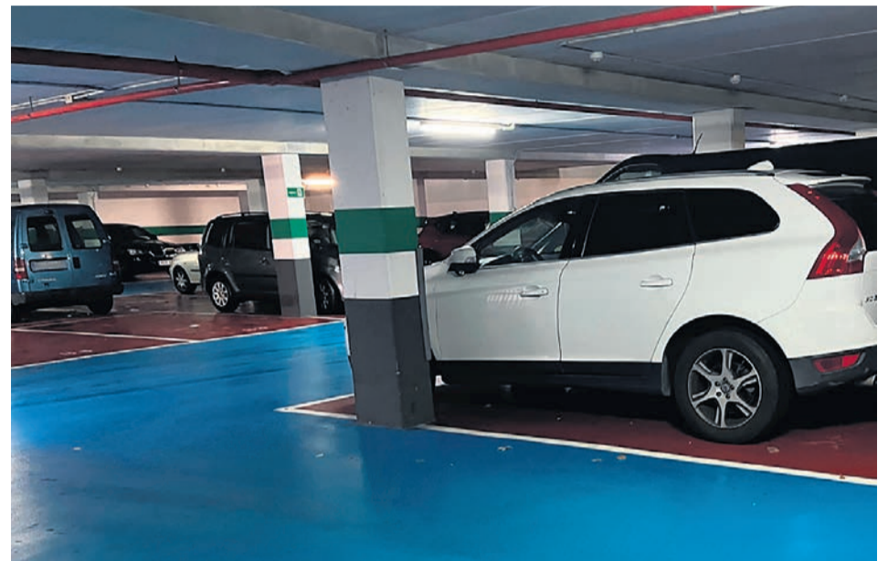
Imagen de una plaza de garaje.