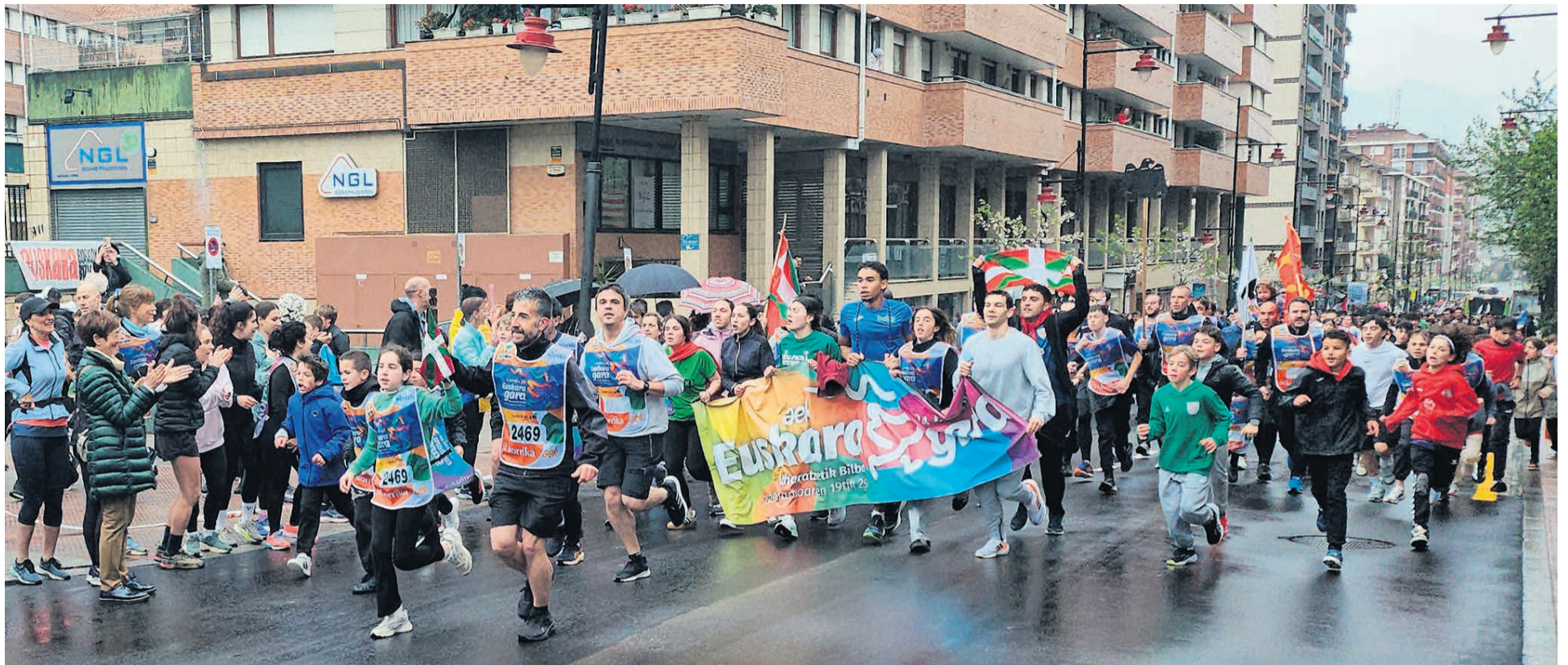
□ Un momento de la cita en Juan Bautista Uriarte.