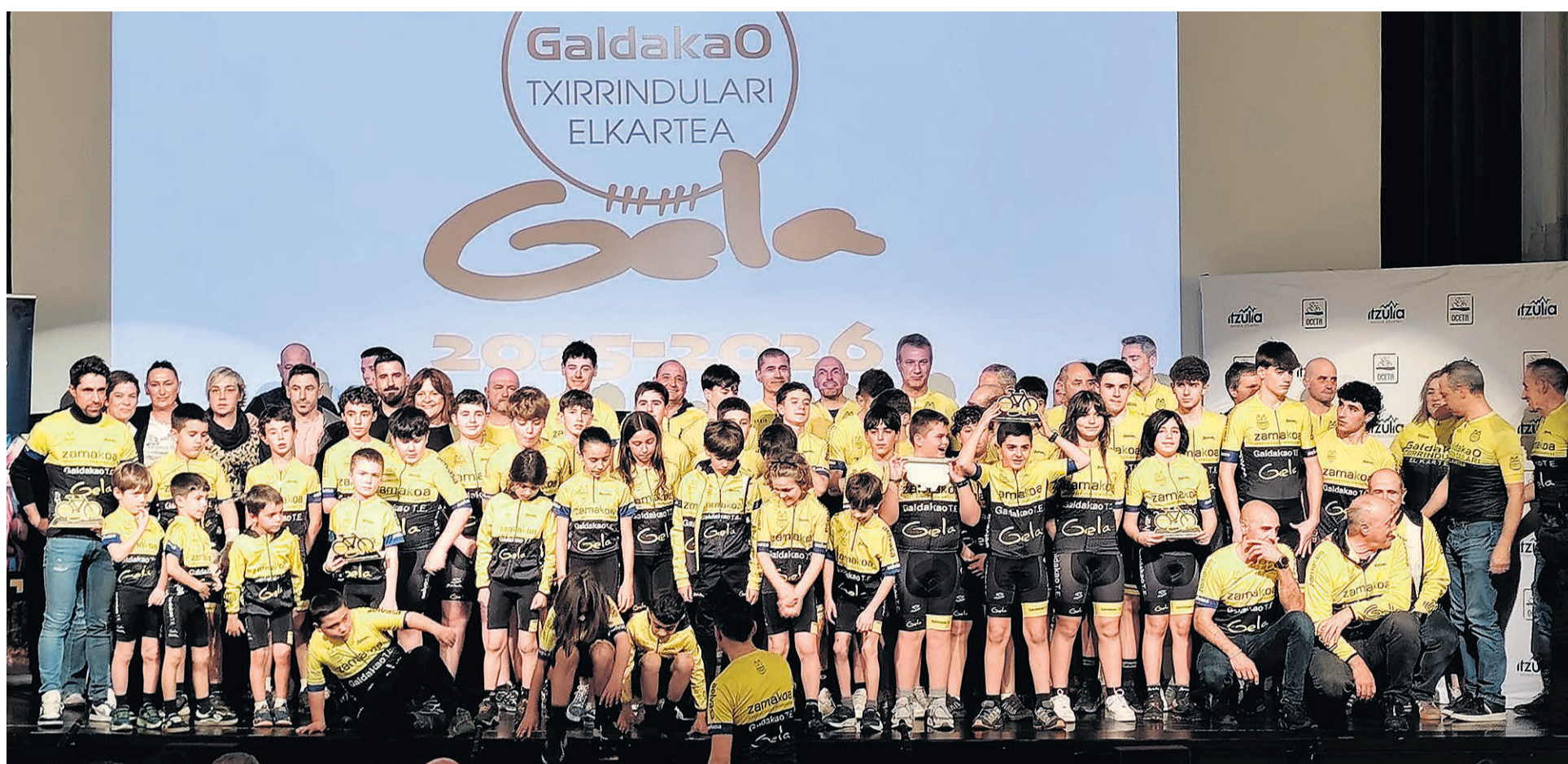
Los componentes del grupo de ciclismo durante la presentación.