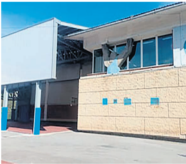
□ El Polideportivo Unkina.