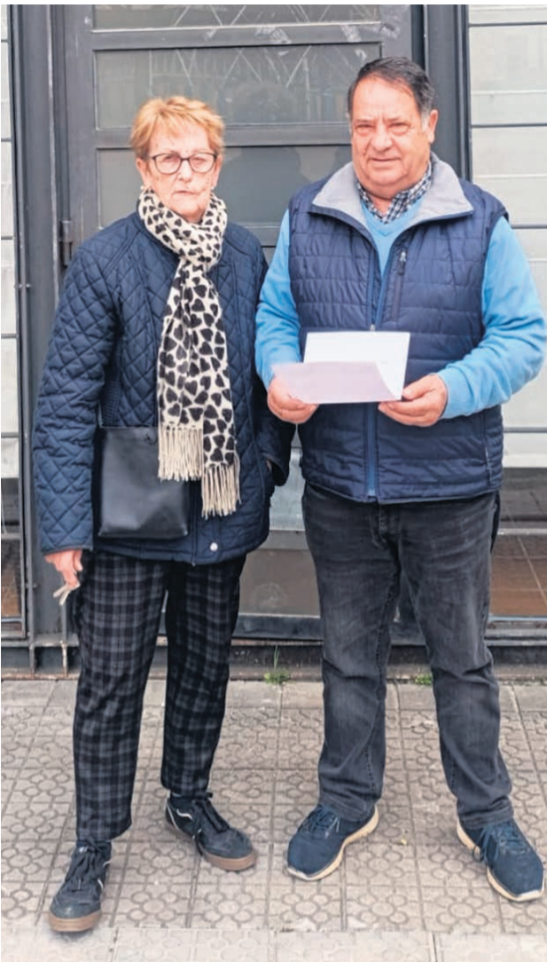
Momento de la entrega.