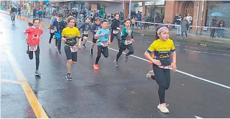
□ Participantes del Duetloi Txiki 2026 durante la carrera.