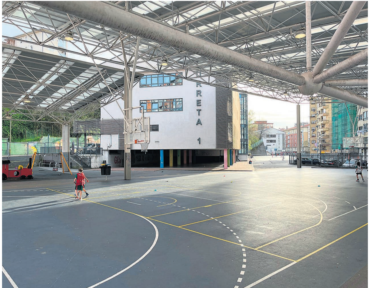
□ Patio de Urreta Eskola.

Toda la información relativa al proceso participativo, incluidas las próximas actividades y convocatorias, puede consultarse en la plataforma municipal de participación ciudadana del Ayuntamiento.