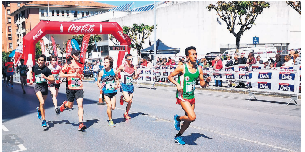
Imagen de una Herri Krosa anterior.

-Distancia Seniors – Veteranos/as: 7.708 metros. 4 vueltas al circuito C.