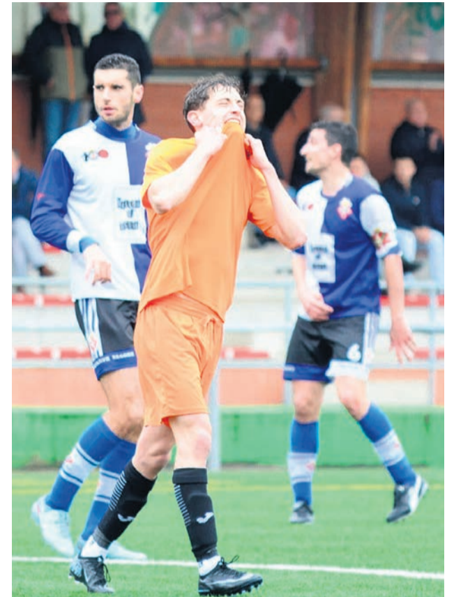
□ El jugador del CD Galdakao se lamenta en su última derrota de liga frente al Begoña.

Con solo 18 puntos en juego, el margen de error se reduce cada semana. Además, el calendario no concede respiro, los galdakoztarras deberán medirse en las próximas semanas a tres rivales directos en la pelea por el