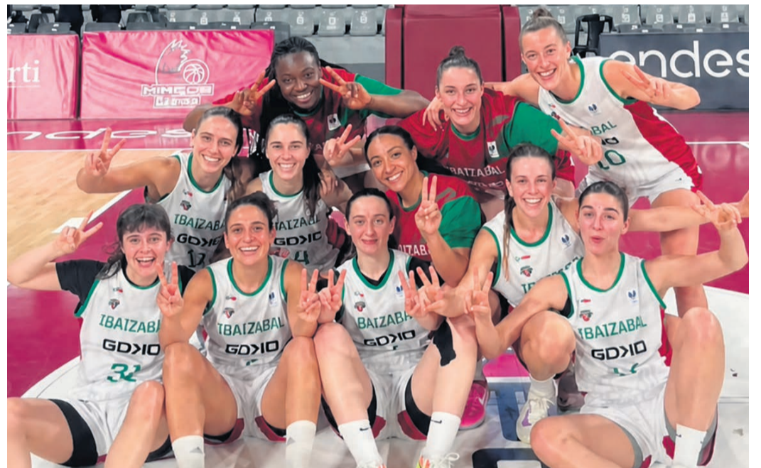
La plantilla celebra la victoria en la ida de cuartos de final.

Pese a la euforia, dentro del vestuario predomina la prudencia. Así lo ha expresado la jugadora