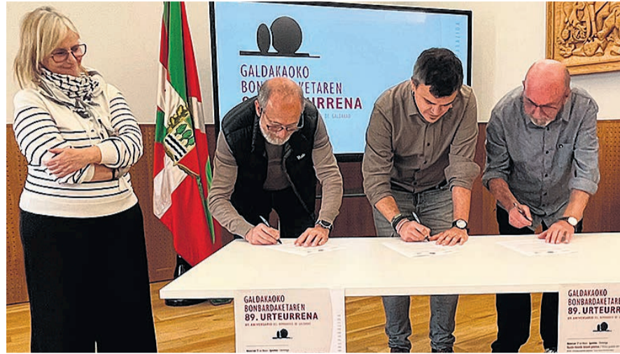
□ Firma del acuerdo.