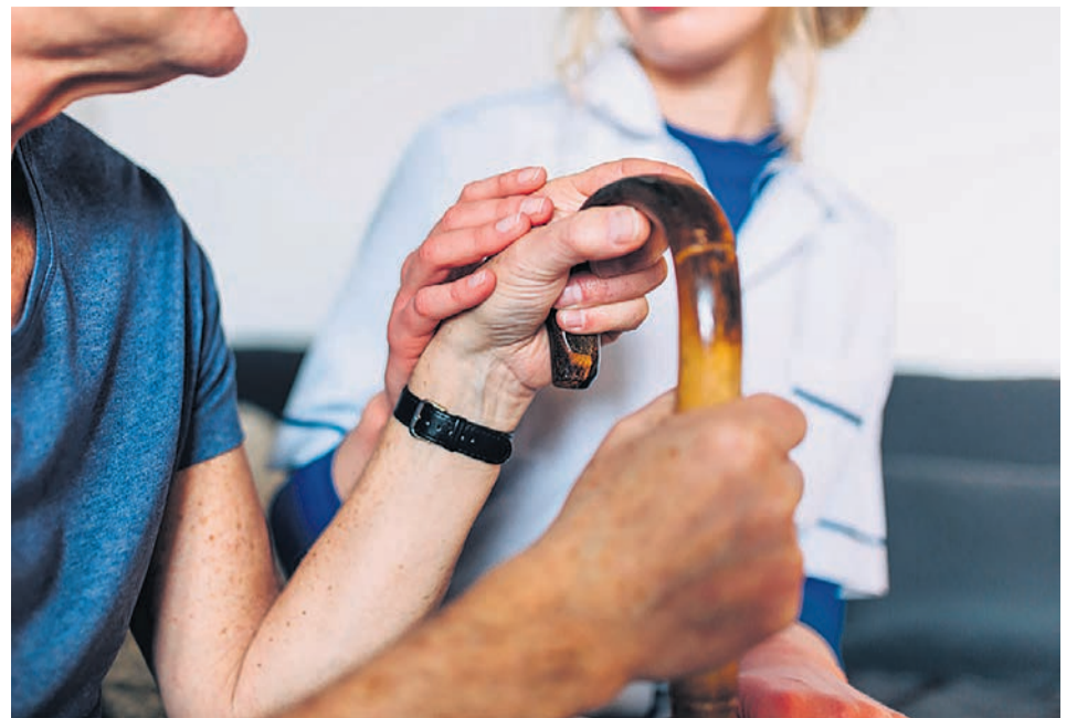
□ El objetivo es mejorar servicio.

"El Ayuntamiento reafirma su apuesta por un modelo de atención público, más cercano y adaptado a las necesidades reales de la población, poniendo el cuidado en el centro. Además, el proceso participativo abierto permite a las vecinas y los vecinos contribuir a definir cómo debe ser un servicio clave para la calidad de vida de muchas personas en el municipio", comentan.