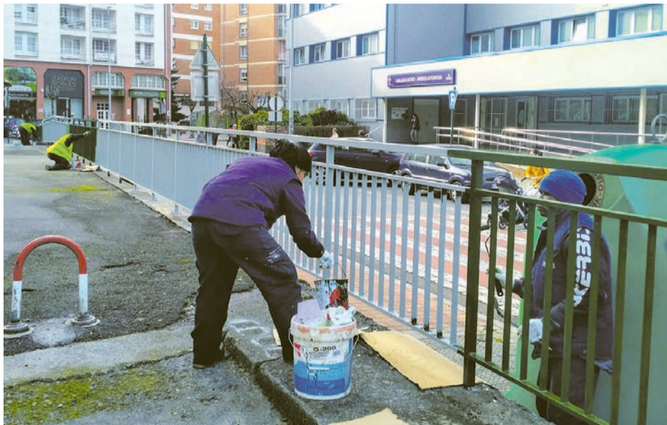
□ Parte del dinero pretende el fomento de empleo.

El Consistorio destinará 600.000 euros adicionales a los planes de empleo dirigidos a apoyar a las personas desempleadas de Galdakao. "Sumados a la cantidad ya aprobada, este año se destinarán 1.200.000 euros a estos programas. El objetivo es claro, facilitar, mediante contratos de seis meses, el