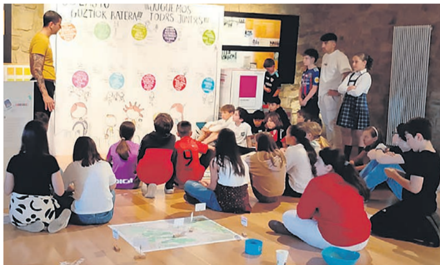
□ Reunión del Consejo de la Infancia en Leioa.