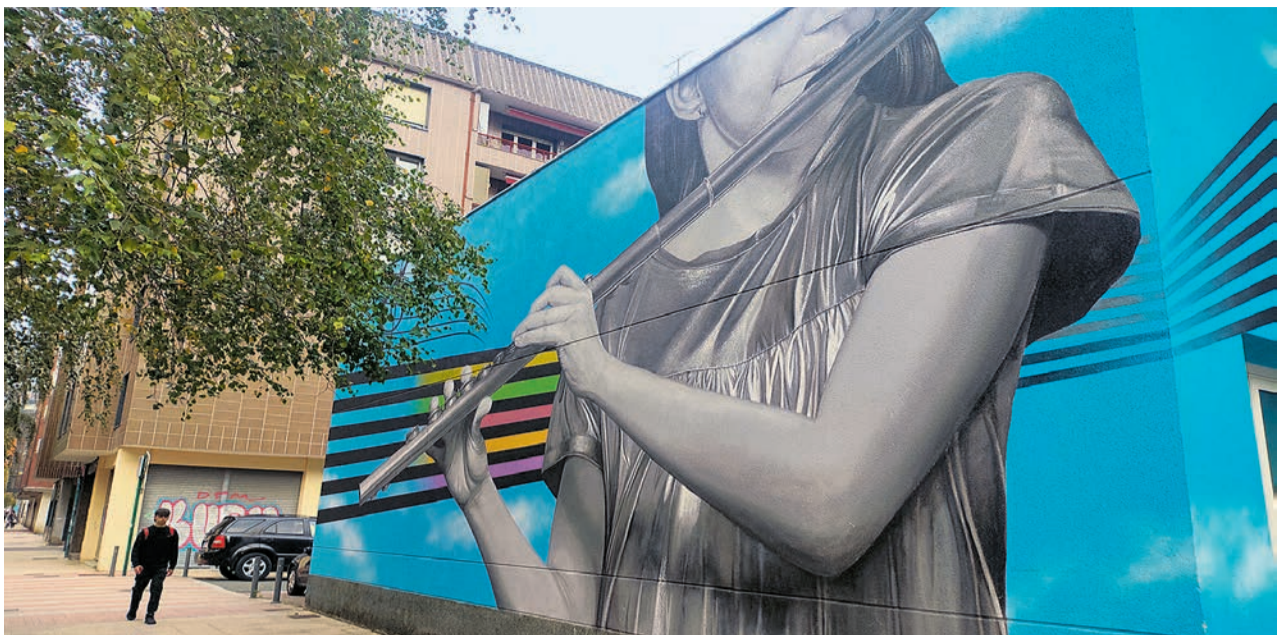
Pared de la Musika Eskola.

La futura ordenanza establecerá un marco normativo claro para regular aspectos como los límites de ruido, las condiciones de aislamiento, la capacidad de inspección municipal o el régimen sancionador, con el objetivo de garantizar una adecuada calidad medioambiental y una convivencia equilibrada. El Ayuntamiento considera necesaria la aprobación de esta ordenanza para unificar y facilitar la comprensión de la normativa sobre ruido, actualmente dispersa en distintos niveles: europeo, estatal y autonómico. Ello puede generar dificultades de interpretación para la ciudadanía y los distintos agentes sociales y económicos. Por tanto, apuesta por una regulación municipal propia que ordene de forma clara todos los aspectos relacionados con la emisión y reducción del ruido en el municipio.