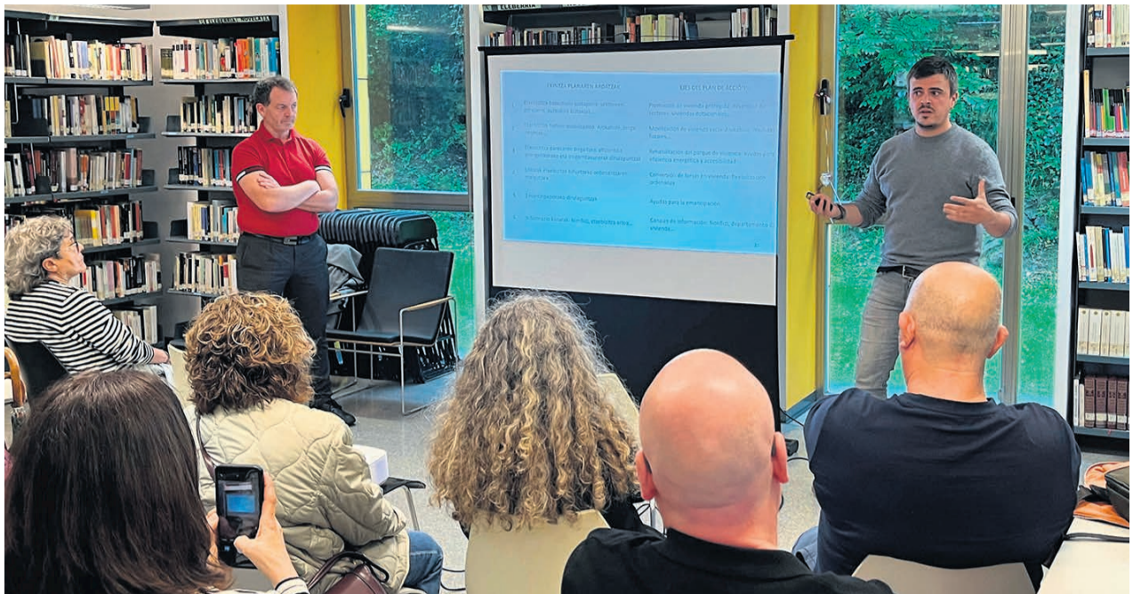
□ Reunión con los vecinos de Aperribai para explicar la medida.