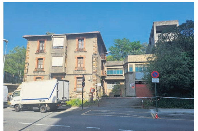
□ La casa que fue ocupada.

Por todo ello, EAJ-PNV pide al equipo de gobierno pasar a la acción. “Que presente un inventario de locales municipales y un plan de adjudicación transparente basado en la seguridad, escuche a los jóvenes y entidades para ofrecerles espacios que cumplan con la normativa, evitando que la ‘patada en la puerta’ sea la única salida ante la falta de gestión municipal”.