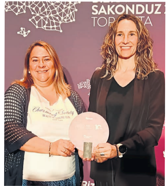
□ Entrega de la distinción.

El Consistorio asistió al encuentro para reforzar su papel como puente estratégico entre las empresas locales y las administraciones, facilitando el acceso a ayudas, programas y recursos externos que contribuyan al desarrollo económico local. “Esta labor resulta clave para impulsar la actividad empresarial en un municipio con un tejido productivo diversi-