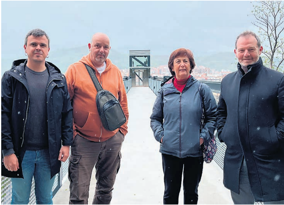
□ Presentación del nuevo ascensor.