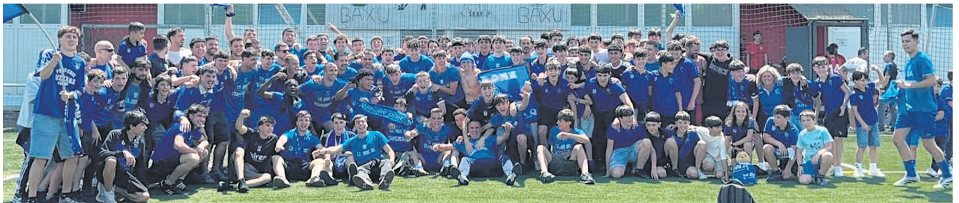
□ Jugadores y cuerpo técnico del Umore Ona celebrando el ascenso a Preferente.