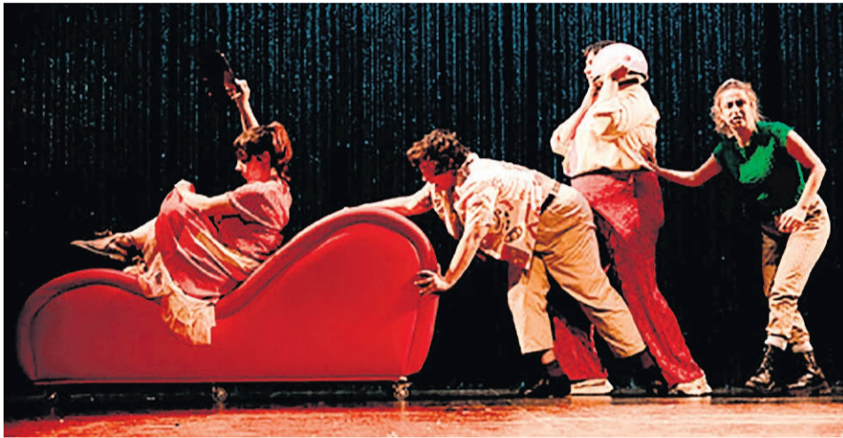
Un momento de 'Promesarik txikiena'.