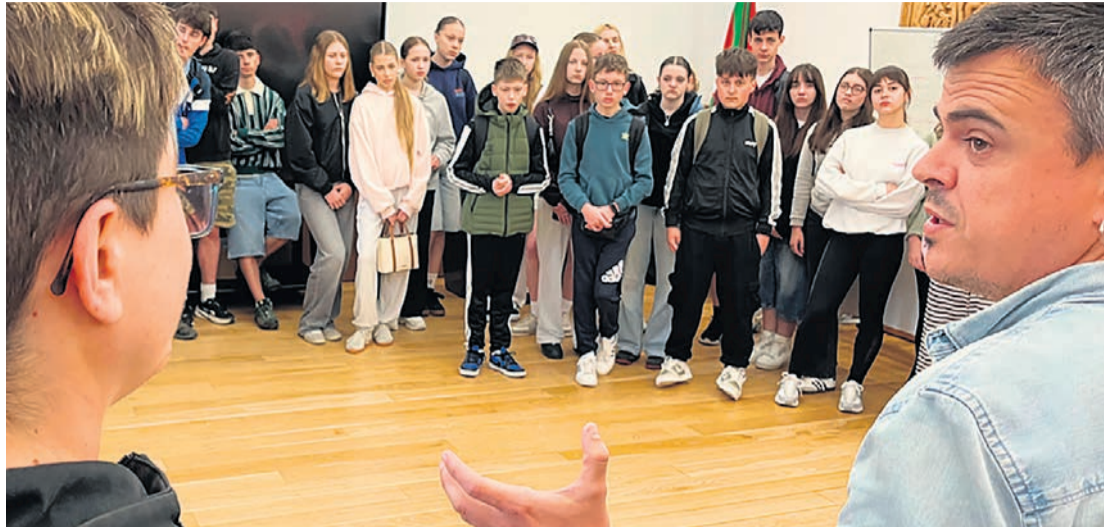
□ Los estudiantes con el alcalde de Galdakao.

Arriandiaga destacó el valor de la cultura y las tradiciones locales