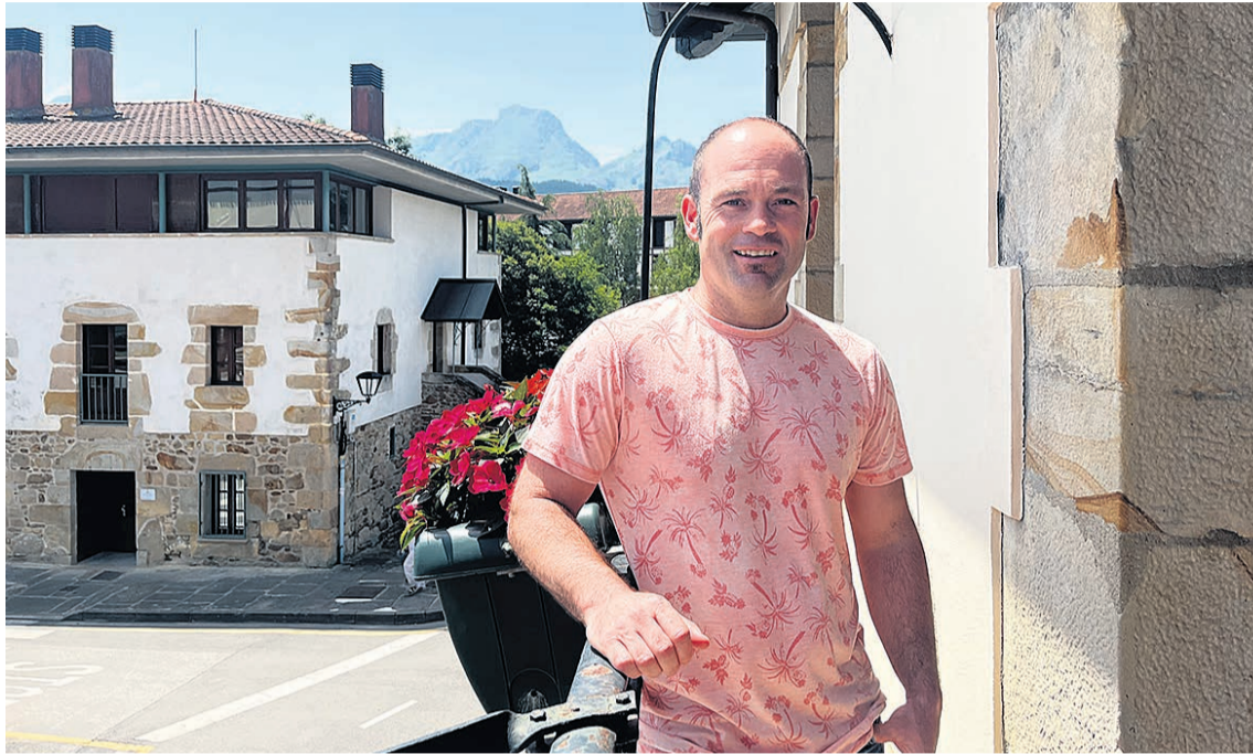
El alcalde de Abadiño, Mikel Urrutia.