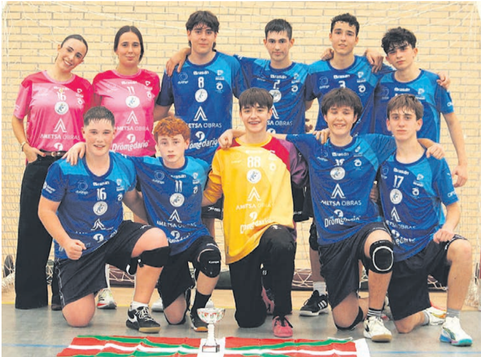
□ Jugadores y entrenadoras con el trofeo.