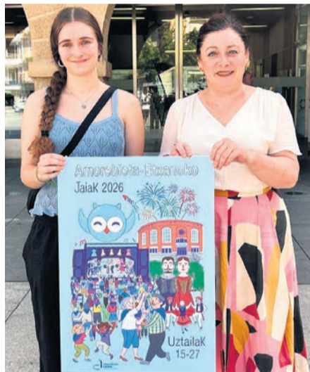
Presentación del cartel.

"Recibí con ganas la propuesta de trabajar con ellos, fui al centro Nafarroa y mantuve una charla con los usuarios. Fue una experiencia enriquecedora, sus aportaciones ofrecían una perspectiva diferente", explica la autora. Recuerdos y vivencias resultaron el eje principal. "Explicaron cómo viven las