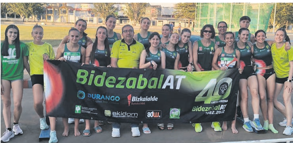
□ Integrantes del equipo tras la jornada final en Huesca.