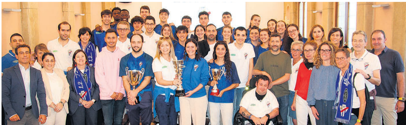
□ Representantes del club de baloncesto durangués y del Ayuntamiento durante el acto.