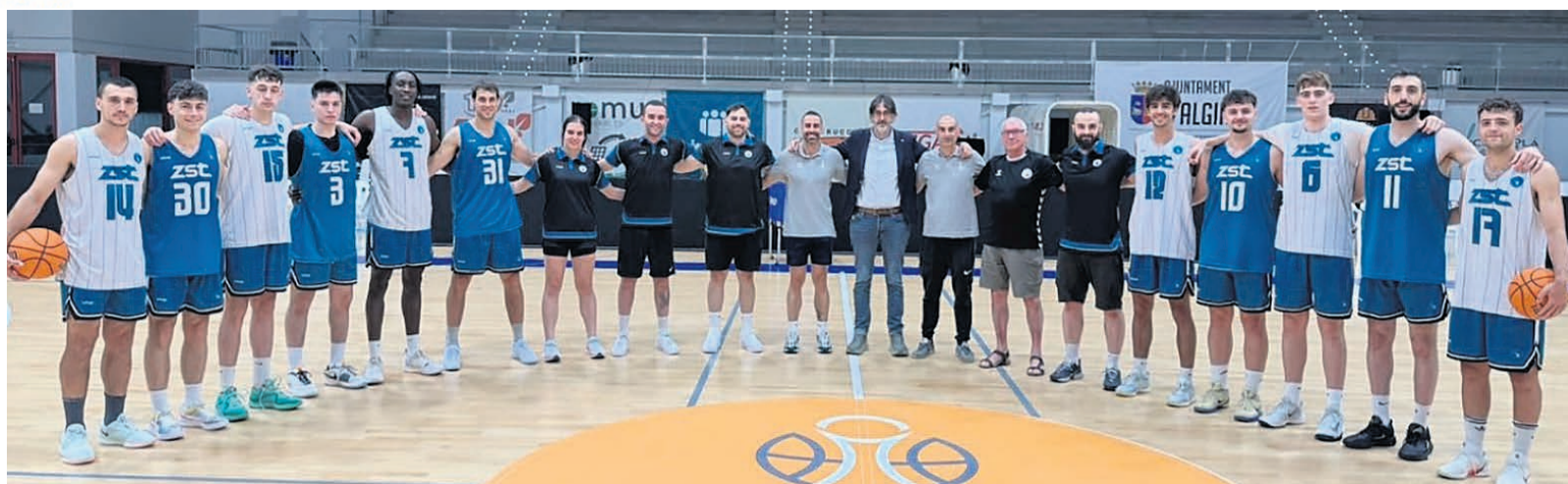
□ Jugadores, cuerpo técnico y dirigentes en Alginet.