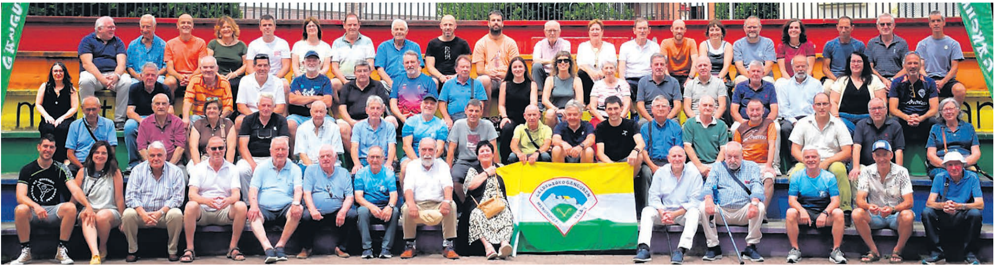
□ Foto de familia en el acto homenaje.