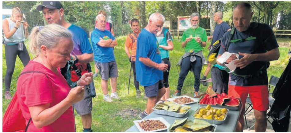
□ Momento en unas fiestas anteriores