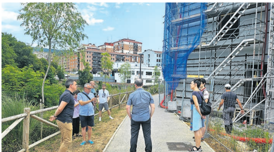
Presentación de la nueva zona.

La visita arrancó en el paso peatonal de Zuhatzu. El alcalde señalaba que la canalización del Ibaizabal era uno de los grandes nudos. Para resolverlo, fue necesario realizar muchos trámites y el resultado ahora es claro: desde hace unos cuatro años ya no se registran inundaciones. Esto permitió iniciar una transformación que ha dado una cara al barrio.