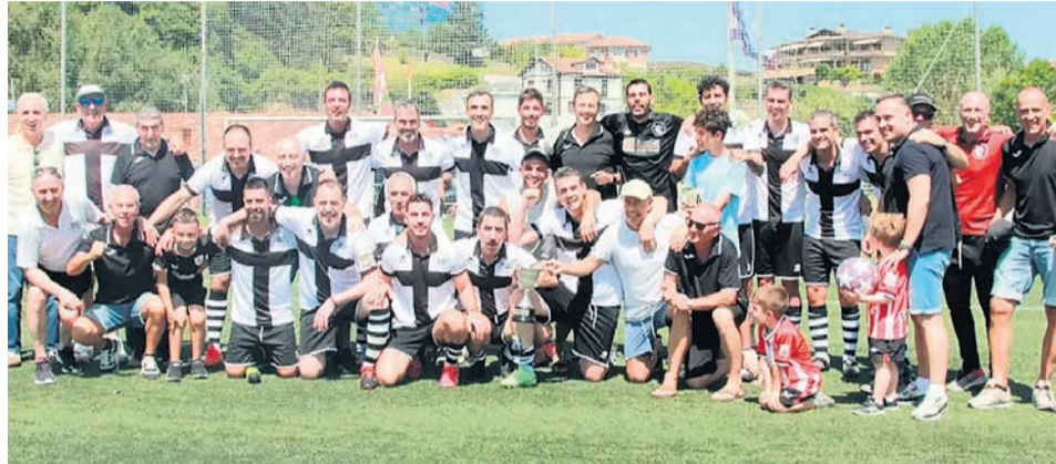
□ La plantilla de Veteranos del Galdakao celebra el título de campeones con el trofeo.