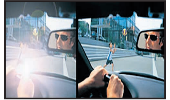
Sin lentes polarizadas. Con lentes polarizadas.

Proteger los ojos a la vez que disponer de una buena visión es fundamental para el cuidado y disfrute de una buena salud ocular. Siempre es importante proteger nuestros ojos de agentes externos que